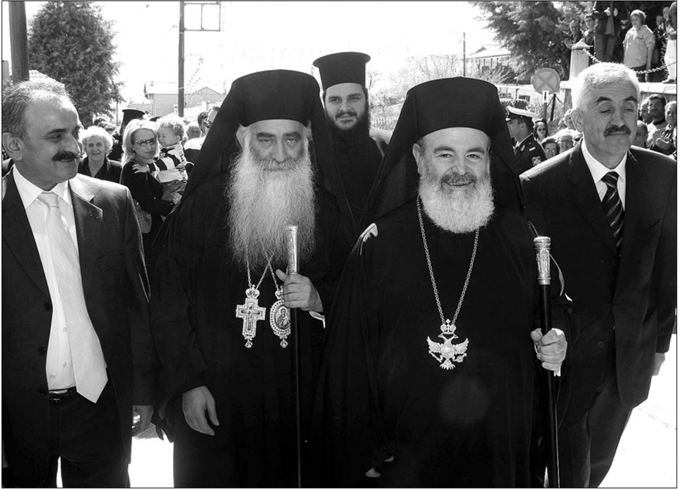
‘Ο Σεβ. Μητροπολίτης Σισαίου και Σιατίστης κ. Παῦλος κατά την ημέρα τῆς ἐνθρόνισεώς του συνοδευόμενος ἀπὸ τὸν Μακαριώτατο Ἀρχιεπίσκοπο Ἀθηνῶν και πάσης Ἑλλάδος κ. Χριστόδουλο, τοὺς τοπικοὺς ἄρχοντες και τὸ λαὸ τῆς μητροπολιτικῆς του περιφερείας

ρίζω καλῶς ὅτι διὰ τὸν καθένα ἐξ ὑμῶν θὰ δώσω λόγον ἐν ἡμέρᾳ κρίσεως.