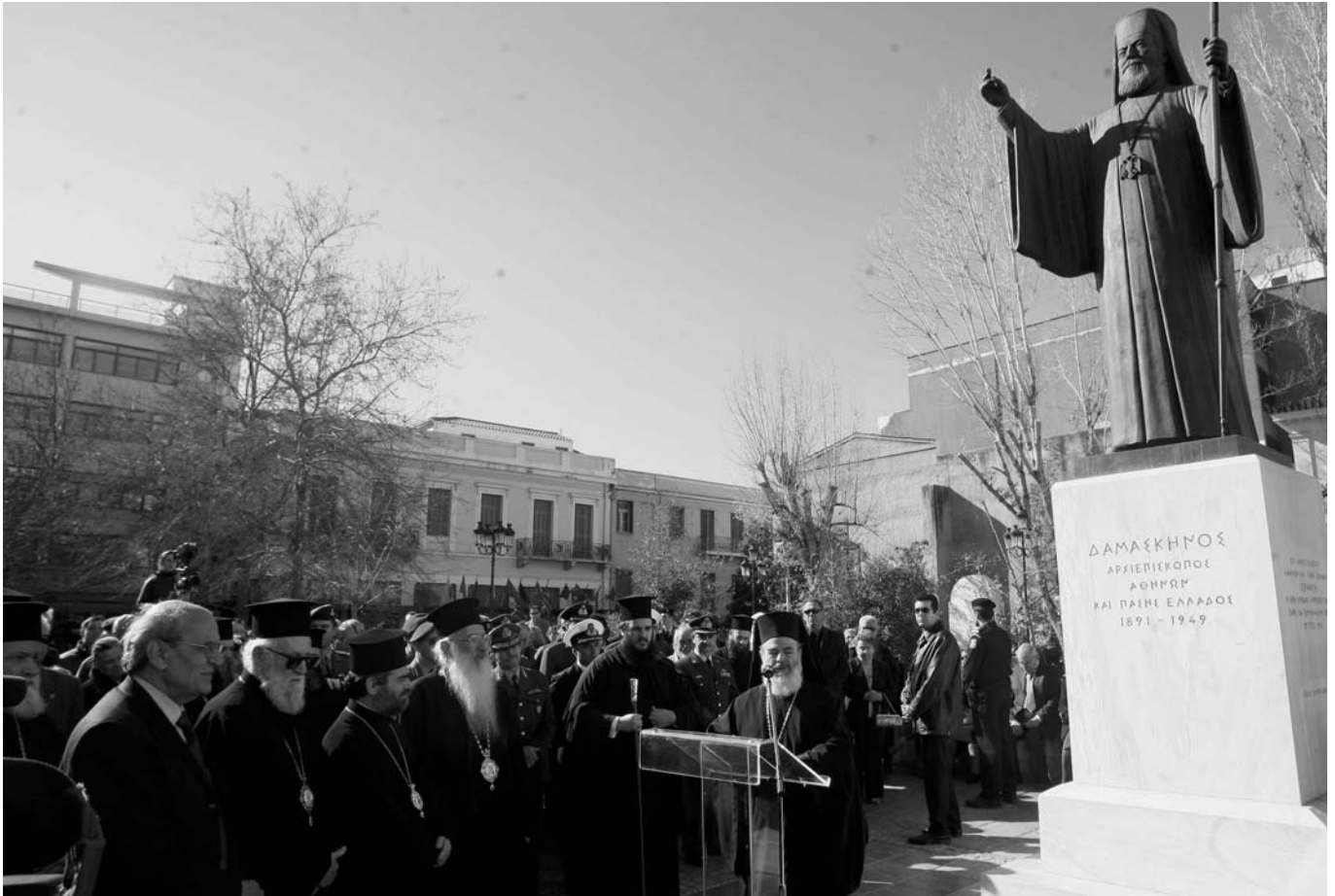
Άπο τὴν ὁμιλία τοῦ Μακαριωτάτου Ἀρχιεπισκόπου Ἀθηνῶν καὶ πάσης Ἑλλάδος κ. Χριστοδοῦλου ἐνώπιον τοῦ ἀνδριάντος τοῦ μακαριστοῦ Ἀρχιεπισκόπου κυροῦ Δαμασκηνοῦ.

ντανὴ ἱστορικὴ μνήμη. Λαοὶ ποὺ δὲν θέλουν νὰ θυμοῦνται τὸ παρελθόν, δὲν δικαιοῦνται νὰ ἔχουν μέλλον. Ὅλοι ἐμεῖς ὑποχρεούμεθα νὰ διαφυλάξουμε γιὰ ἐμᾶς καὶ τοὺς νεωτέρους μας ἀπαραχάρακτη τὴν Ἱστορία, μὴ ἐφαρμόζοντες ἐπ' αὐτῆς μεθόδους Προκρούστη. Καὶ στὸ μέτρο τῶν δυνάμεων τοῦ ὁ καθένας μας νὰ μὴν ἐπιτρέψει ποτὲ νὰ ἐπιβάλλουν τὰ ἀπάνθρωπα ἰδεολογήματα τοὺς στὴν κοινωνία ὀλιγάριθμες ἀκραῖες, ρατσιστικὲς, τρομοκρατικὲς καὶ ὀλοκληρωτικὲς ὁμάδες. Πιστεύουμε στὴν ἀνεκτικότητά πρὸς τὴ διαφορετικότητα τῶν συνανθρώπων μας, στὸν σεβασμὸ τῆς ὅποιας ἀποψῆς τοῦ ἄλλου, στὴν κατάργηση τῆς ποινῆς τοῦ θανάτου καὶ τῶν βασανιστηρίων, στὴν ἐλευθερία τῆς ἔκφρασης καὶ στὰ ἀνθρώπινα δικαιώματα. Ὅπως ὡς Χριστιανοί, ὡς ἄνθρωποι μὲ ὄρθια τὴ συνείδηση, καὶ ὡς πολῖτες ἐλεύθεροι καὶ ὑπεύθυνοι, ἔχουμε ἐπίσης ταχθεῖ ὑπὲρ τῆς ὀλοκληρωτικῆς ἀντίστασης κατὰ τῆς τρομοκρατίας, κατὰ τοῦ ρατσισμοῦ, κατὰ τῆς ξενοφοβίας, κατὰ τῆς κατάργησης τῶν διαφορετικότητων, κατὰ τῆς