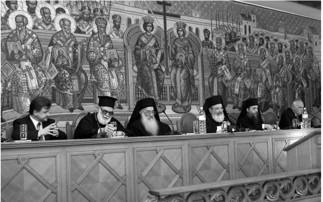
Στιγμιότυπο από την εκδήλωση για τον ι. Φώτιο στο Διορθόδοξο Κέντρο της Ίερας Μονής Πεντέλης.

λονικοῦν μεταξύ τους ἢ νὰ ἀνταλλάσσουν ὕβρεις... Ἄρα ἡ ἀγάπη καὶ ἡ ἀνεγκικότητα μπορεῖ πάντα νὰ ἐπιφέρει καλύτερο ἀποτέλεσμα στὶς σχέσεις μας. Ἡ ταπεινὴ ἀγάπη ἔχει ἐνίοτε μεγαλύτερη ἰσχύ καὶ μεγαλύτερη δύναμη ἀπὸ τὴν πιὸ ἰσχυρὴ καὶ φοβερὴ βία.