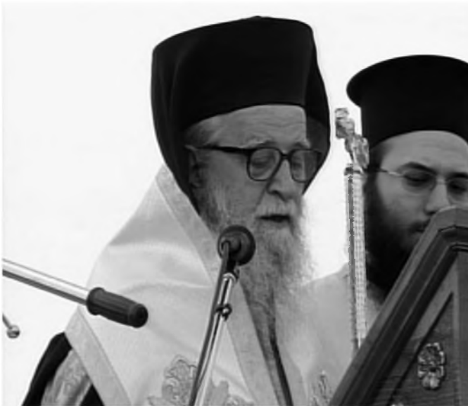
Ὁ Σεβ. Μητροπολίτης Καρυστίας κ. Σεραφεῖμ κατὰ τὸν ἑσπερινὸν στὸν Ἄρειο Πάγιο.

ἀλλὰ τὸν ἐνδιαφέρει νὰ καταστήσει σαφὲς πὼς ὁ Θεὸς κινεῖται πρὸς τὸν ἄνθρωπο, ἀκόμη καὶ ὅταν αὐτὸς τὸν ἀποστρέφεται. Συνοδοιοπορεῖ μὲ τὸ πλάσμα Του προτεινοντας, χωρὶς νὰ ἐπιβάλλει, πορεῖες ζωῆς καὶ λύσεις σὲ ἀδιέξοδα. Σὲ κάθε δὲ περίπτωση ἐπιμένει νὰ διεκδικεῖ τὸν ἄνθρωπο ἀκόμη κι ὅταν, ἢ καλύτερα, ἰδίως ὅταν ἐκεῖνος τὸν ἀρνεῖται. Ψάλλει χαρακτηριστικὰ ἡ Ἐκκλησία μας: «Τὸ ἔλεός σου Κύριε, καταδιώξει με πάσας τὰς ἡμέρας τῆς ζωῆς μου» (Ψαλμ. κβ', 6), γιὰ νὰ δείξει σαφῶς ὅτι ὁ Θεὸς δὲν παραιτεῖται ποτὲ ἀπὸ τὸν πόθο Του νὰ ἐλκύσει «πάντας πρὸς ἑαυτόν» (Ἰω. ιβ', 32).