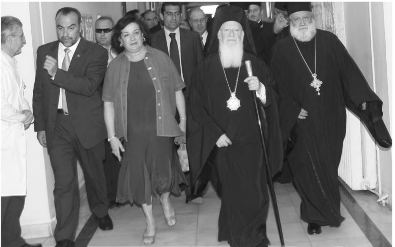
Ἡ Α.Θ.Π. ὁ Οἰκουμενικὸς Πατριάρχης κ. Βαρθολομαῖος ἐπισκέφθη τὸν Μακαριώτατο στὸ Νοσοκομεῖο ΑΡΕΤΑΙΕΙΟ συνοδευόμενος ἀπὸ τὴν Ὑπουργὸ Ἐθνικῆς Παιδείας καὶ Θρησκευμάτων κ. Μαριέττα Γιαννάκου.

Συγκινητικὴ ἐπίσης εἶναι ἡ συμπαράσταση τῶν Προκαθημένων τῶν Ὁρθοδόξων Ἐκκλησιῶν, ἡ ὁποία ἐκφράζεται εἴτε μὲ ἐπὶ τόπου ἐπισκέψεις στὸν κ. Χριστόδουλο εἴτε μὲ τὴν ἔκφραση εὐχῶν μέσῳ ἐπιστολῶν. Ἐξ ἄλλου ἡ πολιτειακὴ καὶ πολιτικὴ ἡγεσία τῆς χώρας μας στάθηκε σύσσωμη στὸ πλευρὸ τοῦ Μακαριώτατου. Ὁ Πρόεδρος τῆς Δημοκρατίας κ. Κάρολος Παπούλιας τὸν ἐπισκέφθη στὸ Νοσοκομεῖο, ὅπως ἔπραξαν ὁ Πρωθυπουργὸς κ. Κ. Καραμανλῆς, ὁ Ἀρχηγὸς τῆς ἀξιωματικῆς ἀντιπολιτεύσεως κ. Γ. Παπανδρέου, ἡ ἡγεσία τῶν ἄλλων κομμάτων καὶ πλῆθος ὑπουργῶν, βουλευτῶν, δικαστικῶν καὶ στρατιωτικῶν ἀξιωματῶν. Ὁ Ἀρχιεπίσκοπος Χριστόδουλος ἤδη ἐπέτυχε μία μεγάλη νίκη. Ἀπέδειξε ὅτι εὐρίσκεται μέσα στὴν καρδιά ὄλων τῶν Ἑλλήνων. Τὸν χρειάζομαστε ὅλοι. Τὸν χρειάζεται ἡ Ἐκκλησία, ἡ Πατρίδα, ἡ Κοινωνία. Τὸν χρειάζονται ἀκόμη καὶ αὐτοὶ ποὺ γιὰ διαφόρους λόγους ἐπικρίνουν τὶς ἀπόψεις του. Καὶ εὐχόμεστε συντόμως νὰ τὸν ξαναδοῦμε ἰερούργουντα