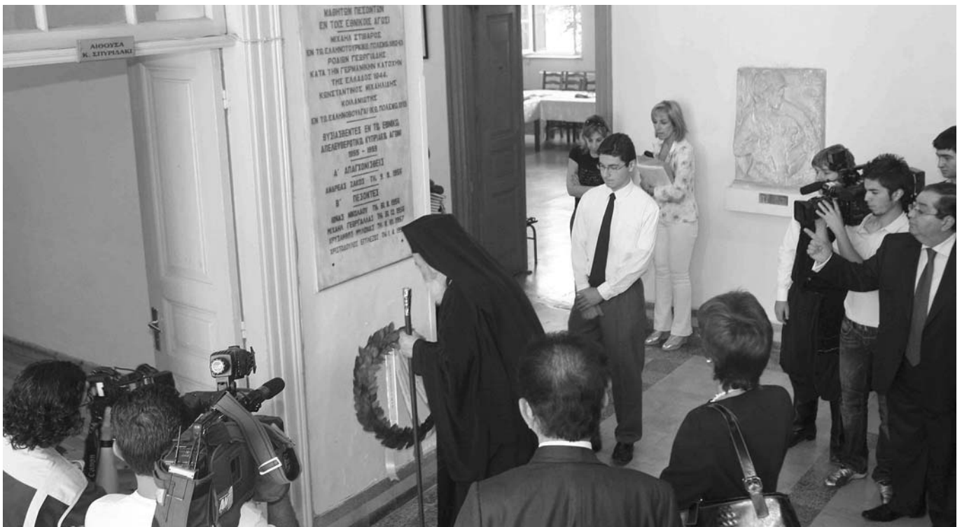
Ὁ Μακαριώτατος Ἀρχιεπίσκοπος Ἀθηνῶν καὶ πάσης Ἑλλάδος κ. Χριστόδουλος καταθέτει στεφάνι στὸ μνημεῖο τῶν μαθητῶν τοῦ Παγκυπρίου Γυμνασίου ποὺ ἔπασαν στὸ πεδίο τῶν Ἑθνικῶν Ἀγῶνων.

Στὸ σύλλογο τῶν ἐπιφανῶν διδασκάλων καταγράφονται τὰ ὀνόματα τῶν: Ἰακώβου Διασσωρινοῦ τοῦ Ροδίου, Ἰλαρίωνος καὶ Σωφρονίου, Ἀρχιεπισκόπων Κύπρου, τοῦ σοφοῦ διδασκάλου καὶ μετέπειτα Πατριάρχου Ἱεροσολύμων, Ἐφραὶμ τοῦ Ἀθηναίου. Ὁ τελευταῖος διακριτικὰ εἰσάγει τὸ πρόγραμμα τῆς Πατμιάδος σχολῆς στὴν Κύπρο, ἐνῶ ἀργότερα κατατίθεται εἰσήγηση λειτουργίας τῆς Σχολῆς ἐπὶ τῇ βάσει τῆς λειτουργίας τῆς Ἡγεμονικῆς Ἀκαδημίας τοῦ Ἰαοῦ καὶ τοῦ Φιλολογικοῦ Γυμνασίου Σμύρνης. Μεταξὺ τῶν διαπρεπῶν γυμνασιαρχῶν μνημονεύομε τὰ ὀνόματα τῶν Ἰωάννου Δέλιου ἐκ Σερρών, Μιχαὴλ Βολονάκη ἐκ Σύμης, Κωνσταντίνου Ἀμάντου ἐκ Χίου, Στίλπωνος Κυριακίδη ἐκ Κομοτηνῆς, Γεωργίου Σάκκαρη ἐκ Κυδωνιῶν, Κωνσταντίνου Κοσμίδη ἐκ Κωνσταντινουπόλεως, Λεάνδρου Παντάκη ἐκ Ξάνθης καὶ ἄλλων.