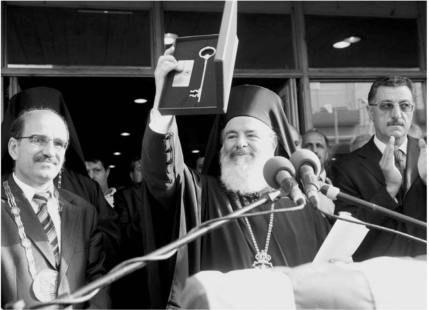
Ὁ Μακαριώτατος παραλαμβάνει ἀπὸ τὸν Δήμαρχο Παραλιμνίου τὸ χρυσοῦ κλειδί τῆς πόλεως.

στικῆς ἀναβαθμίσεως τῆς περιοχῆς ἀποτελεῖ ἡ ἀπόφαση τῆς Ἱερᾶς Συνόδου τῆς Ἐκκλησίας τῆς Κύπρου γιὰ τὴν ἵδρυση Ἱερᾶς Μητροπόλεως Ἀμμοχώστου μὲ προσωρινὴ ἔδρα τὴν πόλη σας, μέχρι νὰ ἔλθῃ ἡ εὐλογημένη μέρα πού θὰ ἀναστηθῇ ἡ νεκρὴ ἐπὶ τρεῖς καὶ πλέον δεκαετίες πόλη τῆς Ἀμμοχώστου.