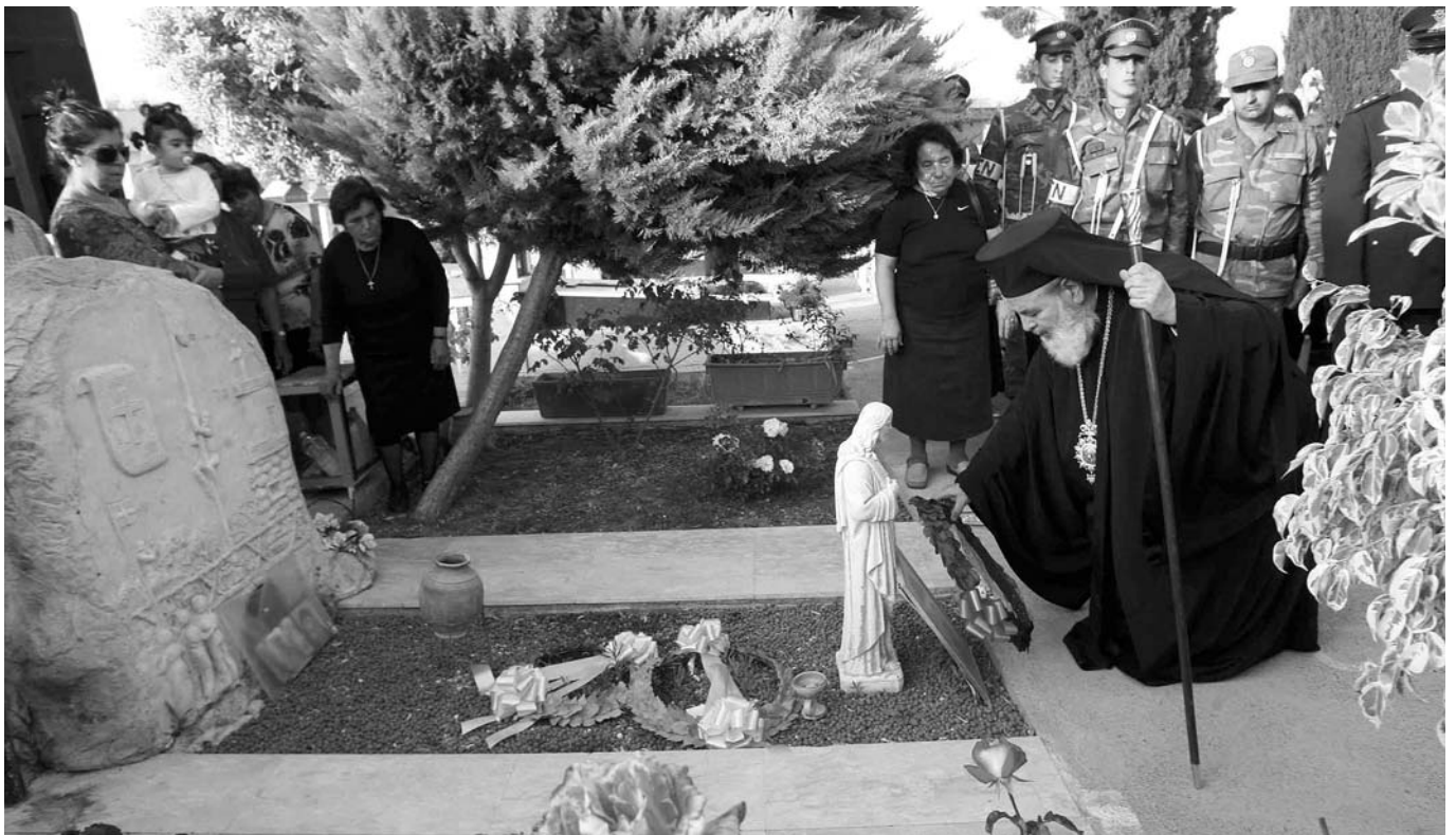
Ὁ Ἀρχιεπίσκοπος κ. Χριστόδουλος καταθέτει στεφάνι στοὺς τάφους τῶν ἡρώων Τάσου Ἰσαὰκ καὶ Σολωμοῦ Σολωμοῦ στὸ Παραλίμνι.

Ἀπὸ τίς πιὸ συγκινητικὲς στιγμὲς τῆς παρουσίας τοῦ Μακαριωτάτου Ἀρχιεπισκόπου κ. Χριστοδούλου