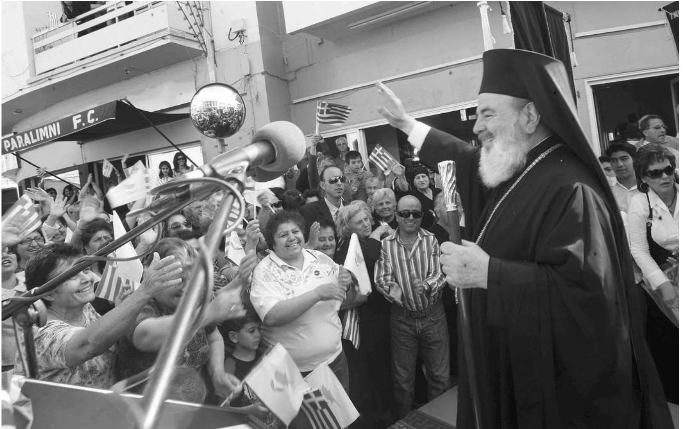
Ὁ Προκαθήμενος τῆς Ἐκκλησίας τῆς Ἑλλάδος ἔγινε δεκτὸς με ἐνθουσιασμό ἀπὸ τὸν λαὸ τῶν ἐλευθέρων περιοχῶν τῆς Ἐπαρχίας Ἀμμοχώστου.

μας καὶ τῆς λαμπρῆς πορείας τῶν ἀγῶνων γιὰ ἐλευθερία, αὐτοδιάθεση καὶ ἀξιοπρεπῆ βίωση, γιὰ νὰ μὴν κληθοῦμε κάποτε νὰ δώσουμε ἐξηγήσεις σὲ ταπεινωμένες μελλοντικὲς γενιές.