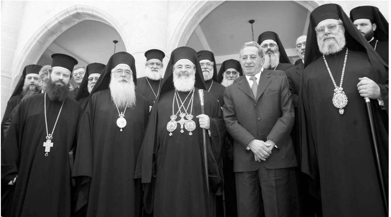
Ὁ Μακαριώτατος Ἀρχιεπίσκοπος Ἀθηνῶν καὶ πάσης Ἑλλάδος κ. Χριστόδουλος καὶ ἡ συνοδεία του μετὸν Πρόεδρο τῆς Κύπρου κ. Τάσσο Παπαδόπουλο καὶ τὸν Μακαριώτατο Ἀρχιεπίσκοπο Κύπρου κ. Χρυσόστομο Β΄.

ριακόπουλο, καὶ τὸν Πρόεδρο τῆς Ἑλλάδος κ. Δημήτριο Ράλλη.