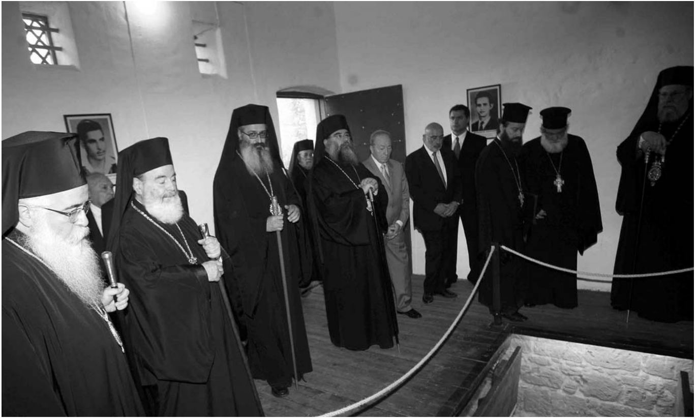
‘Ο Μακαριώτατος Αρχιεπίσκοπος Αθηνών και πάσης Ελλάδος κ. Χριστόδουλος κατά την επίσκεψή του στον τόπο απαγχονισμού των αγωνιστών της ΕΟΚΑ (1955-59).

μπαράσταση την οποία έχει από τις εκάστοτε Έλληνικές Κυβερνήσεις και από τη σημερινή.