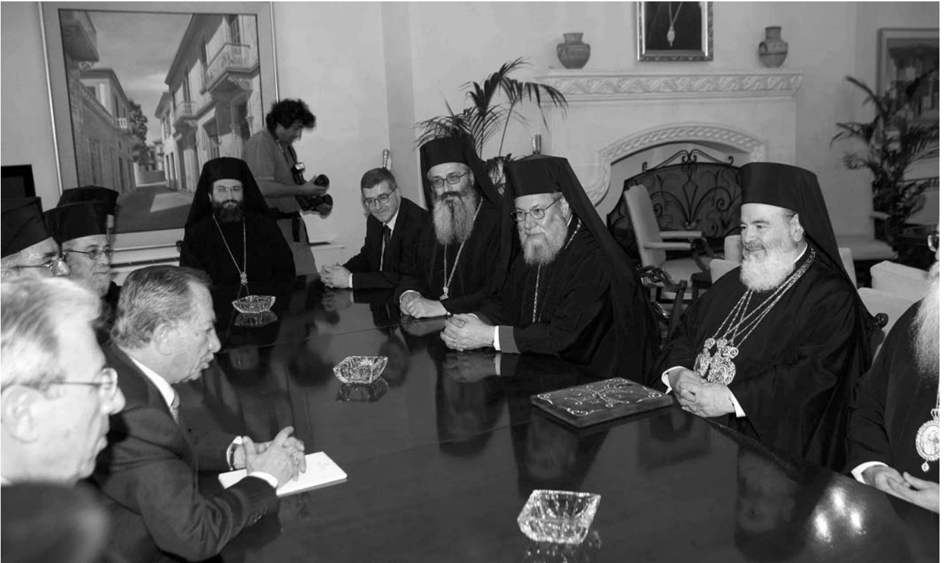
Στιγμιότυπο από την συνάντηση του Μακαριωτάτου Αρχιεπισκόπου Αθηνών και πάσης Ελλάδος κ. Χριστοδούλου με τον Πρόεδρο της Κύπρου κ. Τάσσο Παπαδόπουλο.

Θεού και εύκλειαν της Αγιοτάτης ήμων Ἐκκλησίας, ἐπ' ἀγαθῷ δὲ τῆς ἐμπειστευμένης ὑμῖν Θεολέκτῳ Ποίμνῃς.