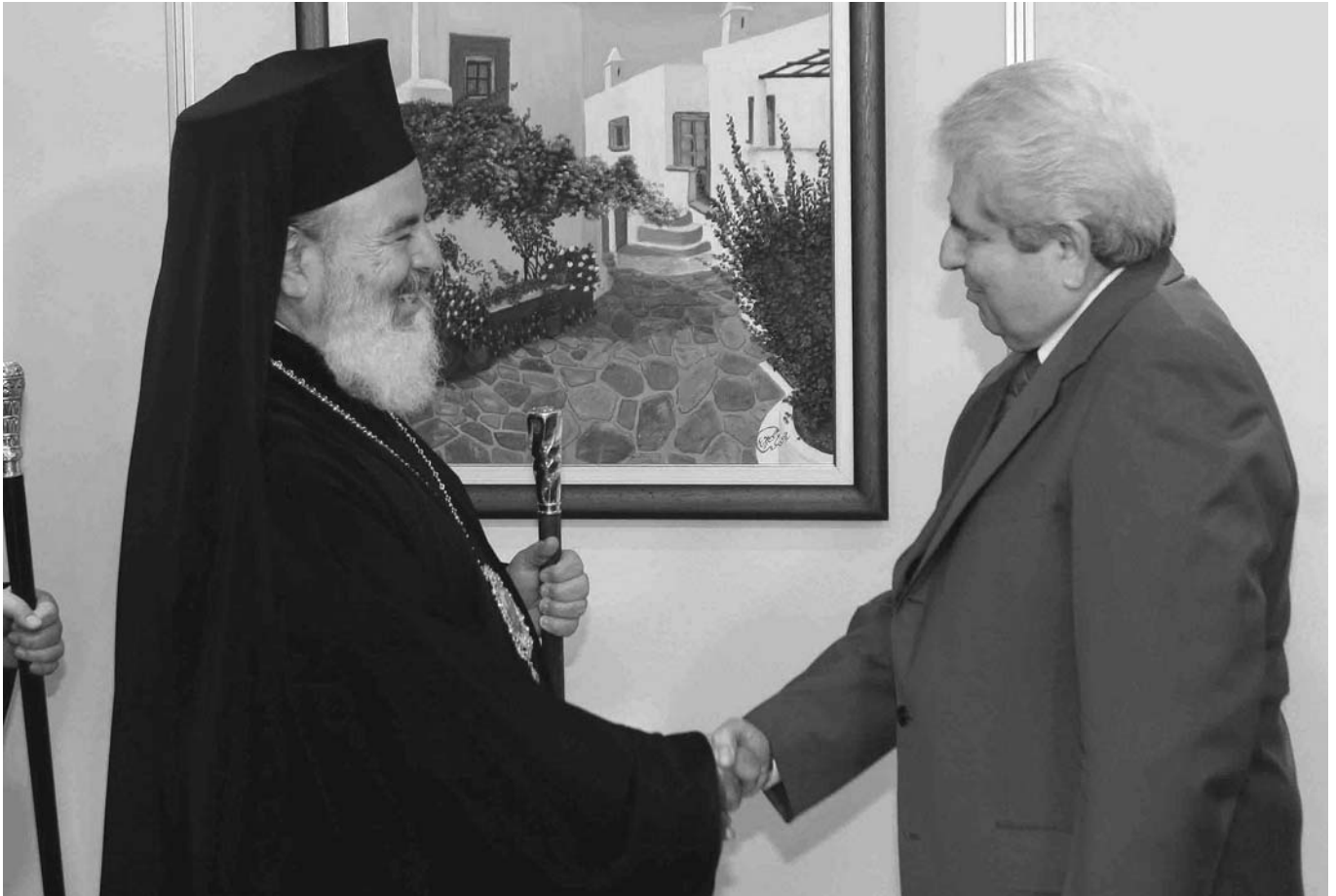
Ὁ Μακαριώτατος Ἀρχιεπίσκοπος Ἀθηνῶν καὶ πάσης Ἑλλάδος κ. Χριστόδουλος κατὰ τὴν συνάντησή του μὲ τὸν Πρόεδρο τῆς Κυπριακῆς Βουλῆς κ. Δημήτρη Χριστόφια.

Μ.Μ.Ε.: «Θέλω νὰ εὐχαριστήσω τὸν κ. Πρόεδρο γιὰ τὴν ἐγκαρδιότητα ποὺ ἐπικράτησε στὴν διάρκεια τῆς συνάντησης. Μᾶς ἀνέλυσε διάφορες πτυχὲς τοῦ Κυπριακοῦ προβλήματος, τοῦ ὁποῖου ἡ λύση ἐξαρτᾶται ἐν πολλοῖς καὶ ἀπὸ τὴν πολιτικὴ κατάσταση, ἡ ὁποία ἐπικρατεῖ στὴ γειτονικὴ χώρα τὴν Τουρκία. Στὴ συνέχεια συζητήσαμε γιὰ τὸν ἄνθρωπο τῶν ἡμερῶν μας, γιὰ τὶς ἀνάγκες του, ἀλλὰ καὶ τὸ καθῆκον τῆς Ἐκκλησίας καὶ τῆς Πολιτείας νὰ στέκονται στὸ πλευρὸ τοῦ ἀγωνιζομένου, τοῦ ἐργαζομένου, τοῦ πάσχοντος ἀνθρώπου, ὁ ὁποῖος ἔχει ἀνάγκη ἀπὸ τὴν βοήθειά μας γιὰ νὰ ὑπερκεράσει τὰ πολλαπλὰ βιοπαλαιστικά, βιοποριστικά, καθὼς καὶ τὰ λοιπὰ πνευματικά προβλήματα ποὺ τὸν ἀπασχολοῦν. Διαβεβαιώσαμε τὸν κ. Πρόεδρο ὡς ἐκπρόσωποι τῶν Ἐκκλησιῶν μας ὅτι στὸν κοινωνικὸ τομέα οἱ Ἐκκλησίες μας εἶναι στὸ πλευρὸ τοῦ λαοῦ μας».