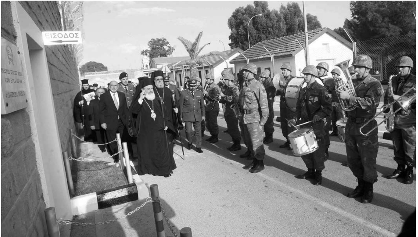
Ὁ Μακαριώτατος Ἀρχιεπίσκοπος Ἀθηνῶν καὶ πάσης Ἑλλάδος κ. Χριστόδουλος κατὰ τὴν ὑποδοχὴ του στὰ Φυλακισμένα Μνήματα.