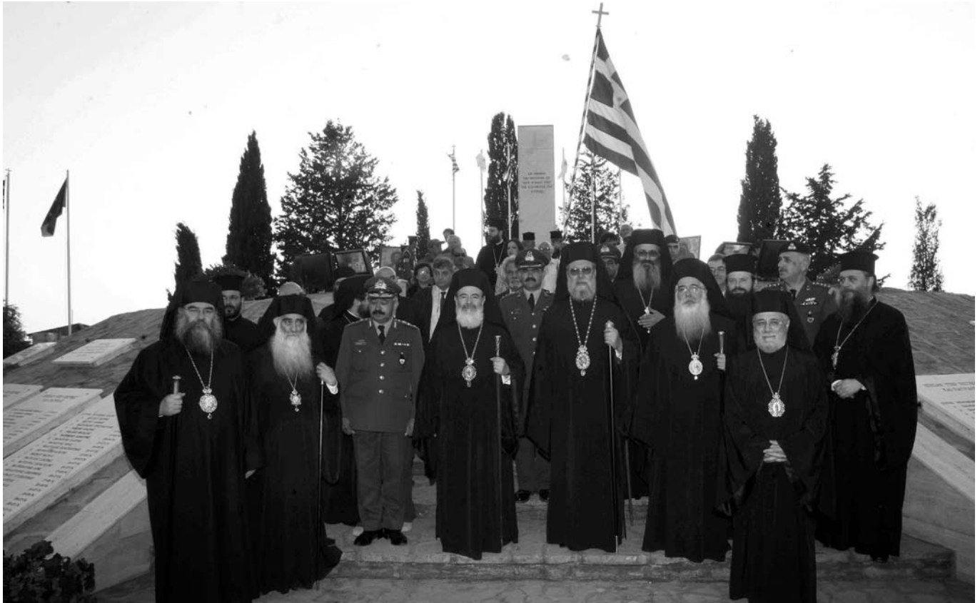
Ο Μακαριώτατος Αρχιεπίσκοπος Ἀθηνῶν καὶ πάσης Ἑλλάδος κ. Χριστόδουλος καὶ ἡ συνοδεία του, μαζί με τὸν Μακαριώτατο Αρχιεπίσκοπο Κύπρου κ. Χρυσόστομο Β΄ στὸν Τύμβο τῆς Μακεδονίτισσας (Μνημεῖο πεσόντων κατὰ τὴν Τουρκικὴ Εἰσβολὴ τοῦ 1974).

παιδιῶν τῆς Κύπρου γιὰ τὴν ἀνάκτηση τῆς ἐλευθερίας τους.