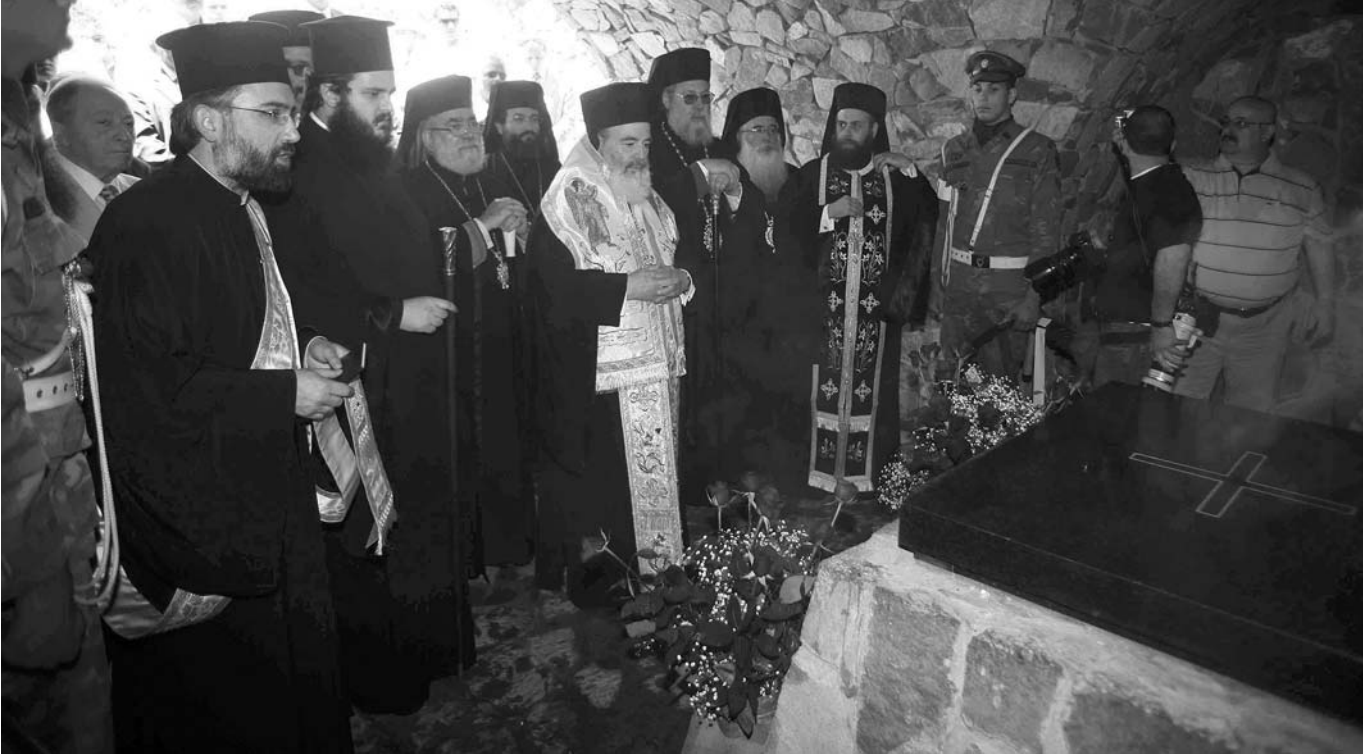
Στιγμιότυπο από τὸ Τρισάγιο στὸν τάφου τοῦ Μακαριστοῦ Ἀρχιεπισκόπου Κύπρου Μακαρίου Γ΄, ἀπὸ τὸν Μακαριώτατο Ἀρχιεπίσκοπο Ἀθηνῶν καὶ πάσης Ἑλλάδος κ. Χριστόδουλο.

ὕφ' ὑμῶν καὶ τῆς ὑφ' ὑμᾶς Ἀδελφότητος ἐπιτελούμενον ἐνταῦθα ἔργον τῆς πρὸς τὸν Θεόν, τὴν Κυρίαν Θεοτόκον καὶ τὸν πλησίον ἀγάπης, ἡ ὁποία οὐδέποτε ἐκπίπτει, ἔργον εἰς τὸ ὅποιον ἐπεδόθητε ἐξ ὅλης τῆς ψυχῆς καὶ ἐξ ὅλης τῆς διανοίας ὑμῶν.