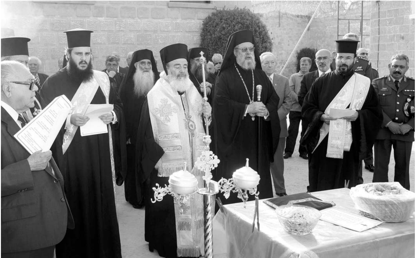
Στιγμιότυπο από τὸ Τρισάγιο στὰ Φυλακισμένα Μνήματα πὺν τέλεσε ὁ Μακαριώτατος Ἀρχιεπίσκοπος Ἀθηνῶν καὶ πάσης Ἑλλάδος κ. Χριστόδουλος εἰς μνήμην τῶν ἀπαγχονισθέντων καὶ πεσόντων μαχητῶν τοῦ Ἐθνικοῦ Ἀγῶνος τῆς Κύπρου (1955-59).

ντας ὅτι «Εἶναι ἀστεῖο νὰ λέμε ὅτι ἡ Ἐκκλησία, ἡ ὁποία ὑπῆρξε καὶ ἐθναρχοῦσα, δὲν ἔχει λόγο καὶ ρόλο στὶς ἐθνικὲς μας ἐξελίξεις».