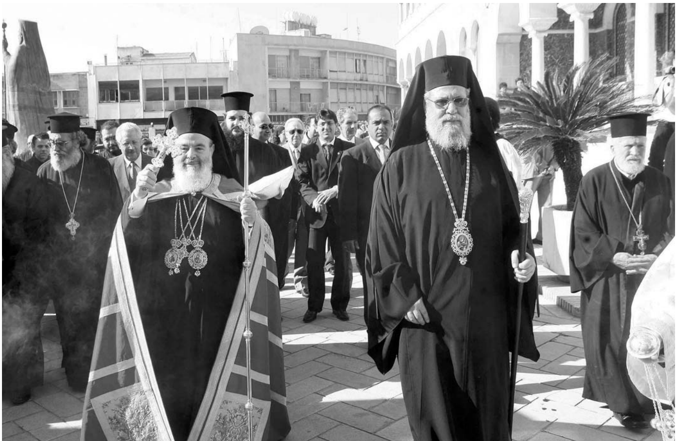
Ὁ Μακαριώτατος Ἀρχιεπίσκοπος Ἀθηνῶν και πάσης Ἑλλάδος κ. Χριστόδουλος κατὰ τὴν ὑποδοχή του στὴν Ἱερά Ἀρχιεπισκοπὴ Κύπρου, συνοδευόμενος ἀπὸ τὸν Μακαριώτατο Ἀρχιεπίσκοπο Κύπρου κ. Χρυσόστομο Β'.

Τὴν Ἀναστάσιμη αὐτὴ περίοδο και ἀπὸ τοῦ ἐλευθέρου ἐδάφους τῆς Κυπριακῆς Δημοκρατίας ἡ σκέψη μας διαβαίνει τὸ Πενταδάκτυλον ὄρος και ἀγκαλιάζει τοὺς εἰσέτι ἐσταυρωμένους ἀδελφούς μας. Τοὺς διαβεβαιώνουμε ὅτι προσευχόμεθα θερμῶς ἡ Ἀνάστασι των νὰ εἶναι ἐγγύς. Ἡ ἐπίσκεψή μας ἔχει και τὴν ἰδιαιτερότητα νὰ συμπίπτει μὲ τὴ συμπλήρωση 50 ἐτῶν ἀπὸ τῆς θυσίας τῶν Ἑλλήνων ἡρώων τοῦ Ἀπελευθερωτικοῦ Ἀγῶνα τῆς Κύπρου Γρηγορίου Αὐξεντίου και Εὐαγόρα Παλληκαρίδη. Τὸ ἦθος, τὸ παράδειγμα και ἡ θυσία τους ἐμπνέει ὅλους μας. Θὰ ἐπισκεφθοῦμε τοὺς τάφους τους, θὰ προσευχηθοῦμε γι' αὐτοὺς και θὰ τοὺς διαβεβαιώσουμε ὅτι ἡ μνήμη τους, ὅπως και ὅλων τῶν ἄλλων Ἑλλήνων ἡρώων τῆς Κύπρου εἶναι αἰωνία.