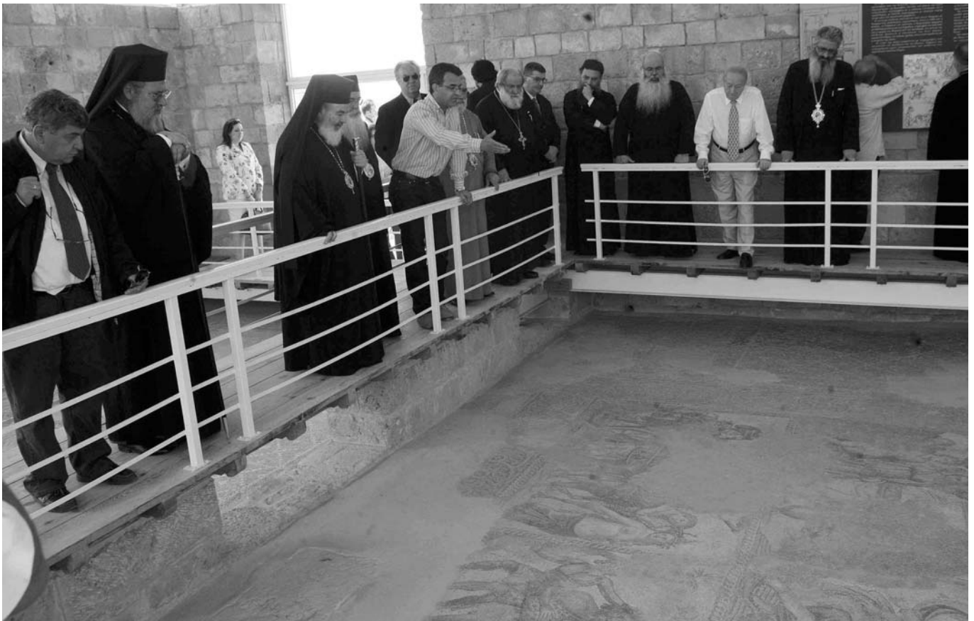
Ὁ Μακαριώτατος Ἀρχιεπίσκοπος Ἀθηνῶν καὶ πάσης Ἑλλάδος κ. Χριστόδουλος καὶ ἡ συνοδεία του κατὰ τὴν ἐπίσκεψή τους στὸν Ἀρχαιολογικὸν χῶρον τῆς Πάφου.