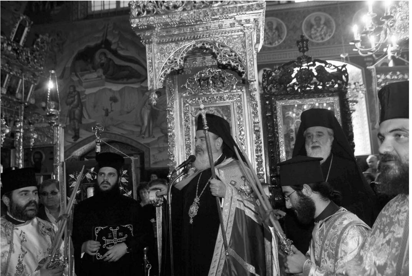
Στιγμιότυπο ἀπὸ τὴν ὑποδοχὴ τοῦ Μακαριωτάτου Ἀρχιεπισκόπου Ἀθηνῶν καὶ πάσης Ἑλλάδος κ. Χριστοδούλου στὴν Ἱερὰ Μονὴ Κύκκου.

δὲν ἀξιώθηκε, δυστυχῶς, ἐξ αἰτίας τῶν ἀνόμων συμπεφρόντων τῶν ἰσχυρῶν τῆς γῆς, νὰ γευτεῖ τὴν ἐκπλήρωση τῶν ὄραματισμῶν καὶ τῶν προσδοκιῶν του.