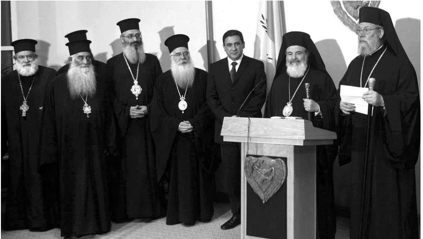
Ὁ Μακαριώτατος Ἀρχιεπίσκοπος Ἀθηνῶν καὶ πάσης Ἑλλάδος κ. Χριστόδουλος καὶ ἡ συνοδεία αὐτοῦ κατὰ τὴν ἀφίξη του στὴν Κύπρο, λίγο πρὶν τὴν προσφώνηση ἀπὸ τὸν Μακαριώτατο Ἀρχιεπίσκοπο Κύπρου κ. Χρυσόστομο Β΄. Διακρίνεται καὶ ὁ Ὑπουργὸς Παιδείας τῆς Κύπρου κ. Ἄκης Κλεάνθους.

Κυπριακὸ λαό, πὺν βρίσκεται σὲ συνεχῆ ἀγώνα γιὰ ἀνάκτηση τῆς ἐλευθερίας του.