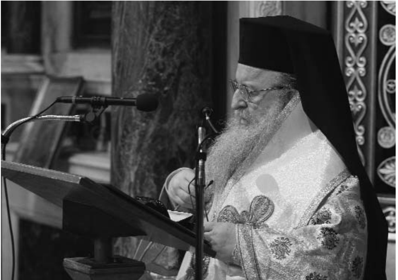
Ὁ Σεβ. Μητροπολίτης Θεσσαλονίκης κ. Ἄνθιμος κατὰ τὴν ὁμιλία του γιὰ τὴν Κυριακὴ τῆς Ὁρθοδοξίας στὸν Καθεδρικό Ναὸ Ἀθηνῶν.

ὡσπερ φερομένης πνοῆς βιαίας καὶ ἐπλήρωσεν ὅλον τὸν οἶκον, οὗ ἦσαν καθήμενοι· ὠφθησαν αὐτοῖς διαμεριζόμεναι γλῶσσαι, ὡσεὶ πυρός, ἐκάθισε ἐφ' ἓνα ἕκαστον αὐτῶν καὶ ἐπλήσθησαν ἅπαντες Πνεύματος ἁγίου καὶ ἤρξαντο λαλεῖν ἐτέραις γλώσσαις, καθὼς τὸ Πνεῦμα ἐδίδου αὐτοῖς ἀποφθέγγεσθαι». Ἀπὸ ἐκείνης τῆς ὥρας ὁ οὐρανὸς ἄρδευε τὶς ψυχὰς τῶν ἀνθρώπων καὶ τὴν γῆ μεθεῖα δωρήματα, καθὼς ἡ Ἐκκλησία συγκροτούμενη ἐπὶ τὸν θεμέλιο λίθο, τὸν Κύριον Ἰησοῦ, ἐγίνετο ἡ κιβωτὸς τῆς σωτηρίας γιὰ τὶς ψυχὰς τῶν πιστῶν τέκνων αὐτῆς.