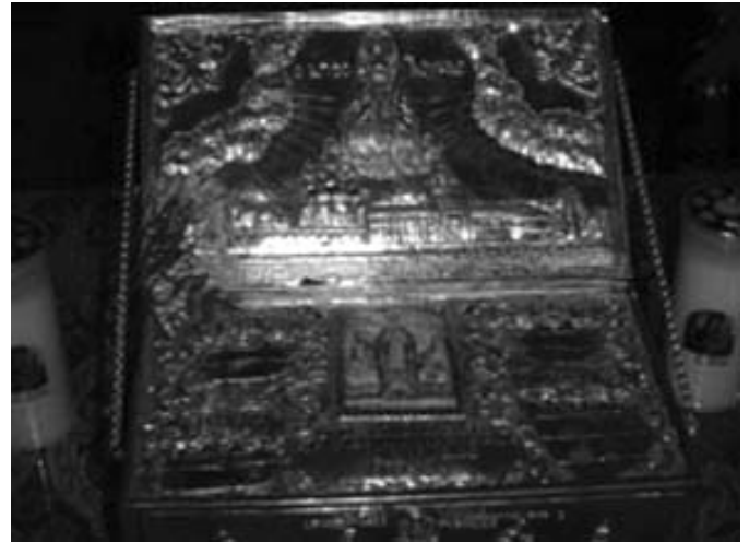
Τὸ ἱερὸν λείψανον τοῦ ἁγίου Λουκᾶ

Ἡ Ἱερὰ Μητρόπολις σὲ συνεργασία μὲ τὴν Ἑνωσὴ Χριστιανῶν Ἐπιστημόνων Ν. Κερκύρας, πραγματοποιήσε μὲ τὴν εὐκαιρία τοῦ ἐρχομοῦ στὴν Κέρκυρα λειψάνου τοῦ νεοφανοῦς Ἀγίου Λουκᾶ, Ἀρχιεπισκόπου Συμφερουπόλεως Κριμαίας, τοῦ ἱατροῦ, ἐκδήλωση τὸ Σάββατο 5 Ἀπριλίου τὸ ἀπόγευμα, στὸ κατάμεστο ἀπὸ κόσμον Ἀμφιθέατρο τοῦ Ἰδρύματος Χρονίως Πασχόντων «Ἡ Πλησιότερα», μὲ ὀμιλητὴ τὸν Πανοσιολογιώτατο Ἀρχιμανδρίτη π. Νεκτάριο Ἀντωνόπουλο, ἡγούμενο τῆς Ἱερᾶς Μονῆς Σαγματᾶ Θηβῶν, ὁ ὁποῖος μίλησε γιὰ τὸν Ἅγιο, καὶ σχολίασε εἰδικὸ ντοκιμαντέρ τὸ ὁποῖο ἀναφέρονταν μὲ συγκλονιστικὲς λεπτομέρειες στὴ ζωὴ καὶ τὰ θαύματά του.