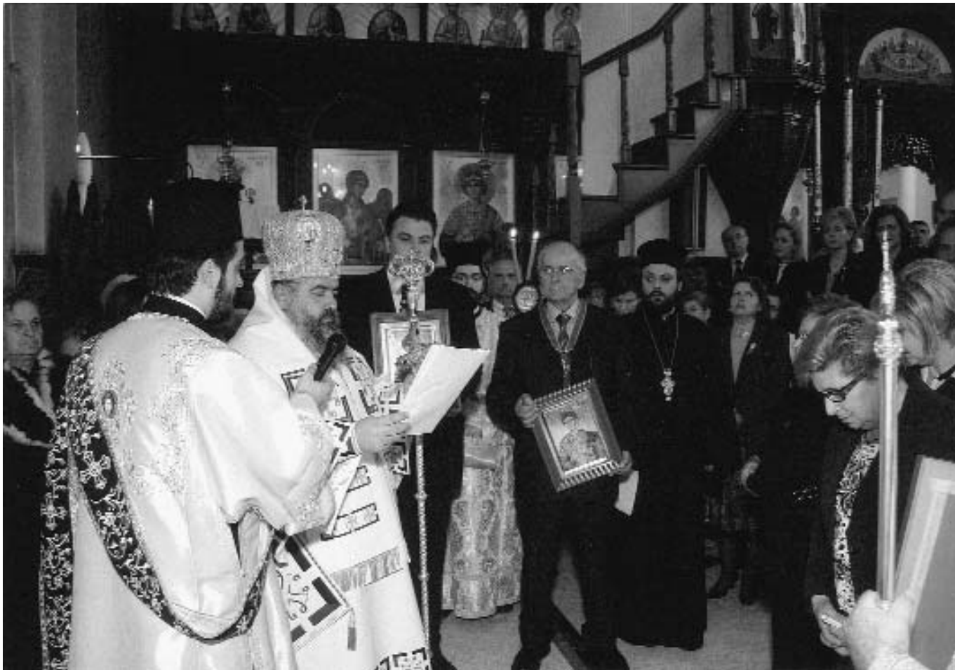
Ὁ Σεβ. Μητροπολίτης Νεαπόλεως καὶ Σταυρουπόλεως κ. Βαρνάβας τὴν Κυριακὴ τῆς Ὁρθοδοξίας κατὰ τὴν λιτάνευση τῶν ἱερῶν εἰκόνων.

δέχθηκε τοὺς προσκεκλημένους, –τοπικοὺς βουλευτές, Δημάρχους τῆς Δυτικῆς Θεσσαλονίκης, ἐκπροσώπους Ἀρχῶν καὶ Φορέων τῆς πόλης, ἀνθρώπους τῶν Γραμμάτων καὶ Ἐπιχειρηματίες–, στὸ γεῦμα ποὺ παρέθεσε πρὸς τιμὴν τους τὴν Κυριακὴ τῆς Ὁρθοδοξίας, συνεχίζοντας τὴν παράδοση τῆς τοπικῆς Ἐκκλησίας καὶ ἐκφράζοντας μὲ τὸν τρόπο αὐτὸ τὴ σημασία τῆς μεγάλης αὐτῆς ἡμέρας.