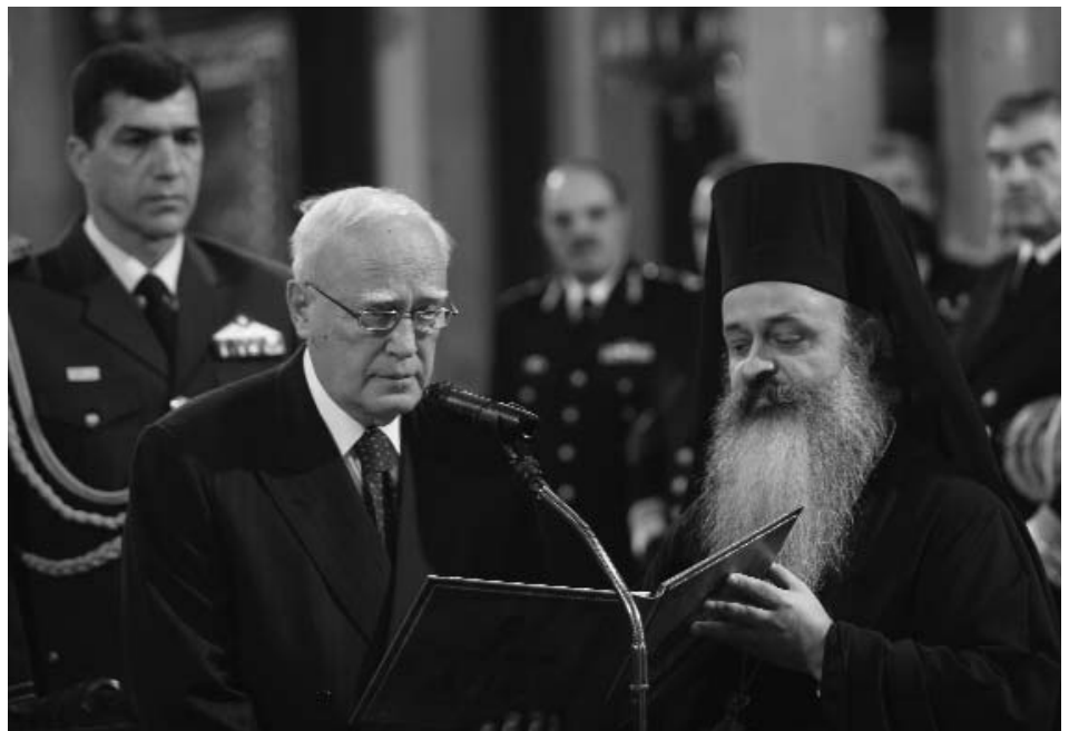
Στιγμιότυπο μὲ τὸν Πρόεδρο τῆς Δημοκρατίας κ. Κάρολο Παπούλια, ὁ ὁποῖος ἀπαγγέλλει τὸ Σύμβολον τῆς Πίστεως

Πρὸ τῆς Ἀπολύσεως τῆς Θείας Λειτουργίας πραγματοποιήθηκε Λιτάνευση τῶν Ἱερῶν Εἰκόνων σὲ ἀνάμνηση τῆς λιτανευτικῆς πομπῆς, ἡ ὁποία προηγήθηκε τῆς ιστορικῆς ἀναστηλώσεως τῶν εἰκόνων τὸ 843. Τὸν Πανηγυρικό τῆς ἡμέρας ἐξεφώνησε ὁ Σεβασμιώτατος Μητροπολίτης Θεσσαλονίκης κ. Ἄνθιμος. Στὴν ὁμιλία του ὁ Σεβασμιώτατος, μεταξὺ ἄλλων, παρατήρησε ὅτι: «Ἡ ἀναστήλωση τῶν εἰκόνων εἶναι θρίαμβος καὶ δόξα τῆς Ἐκκλησίας, ἐπειδὴ ἡ ἴδια ἡ Ὁρθόδοξη εἰκόνα εἶναι μία δοξολογία. Περιορρέεται ἀπὸ τὴν δόξα καὶ τὴν ὕμνεϊ μὲ τὰ δικά της μέσα. Τὸ ἀληθινὸ κάλλος δὲν ἔχει ἀνάγκη