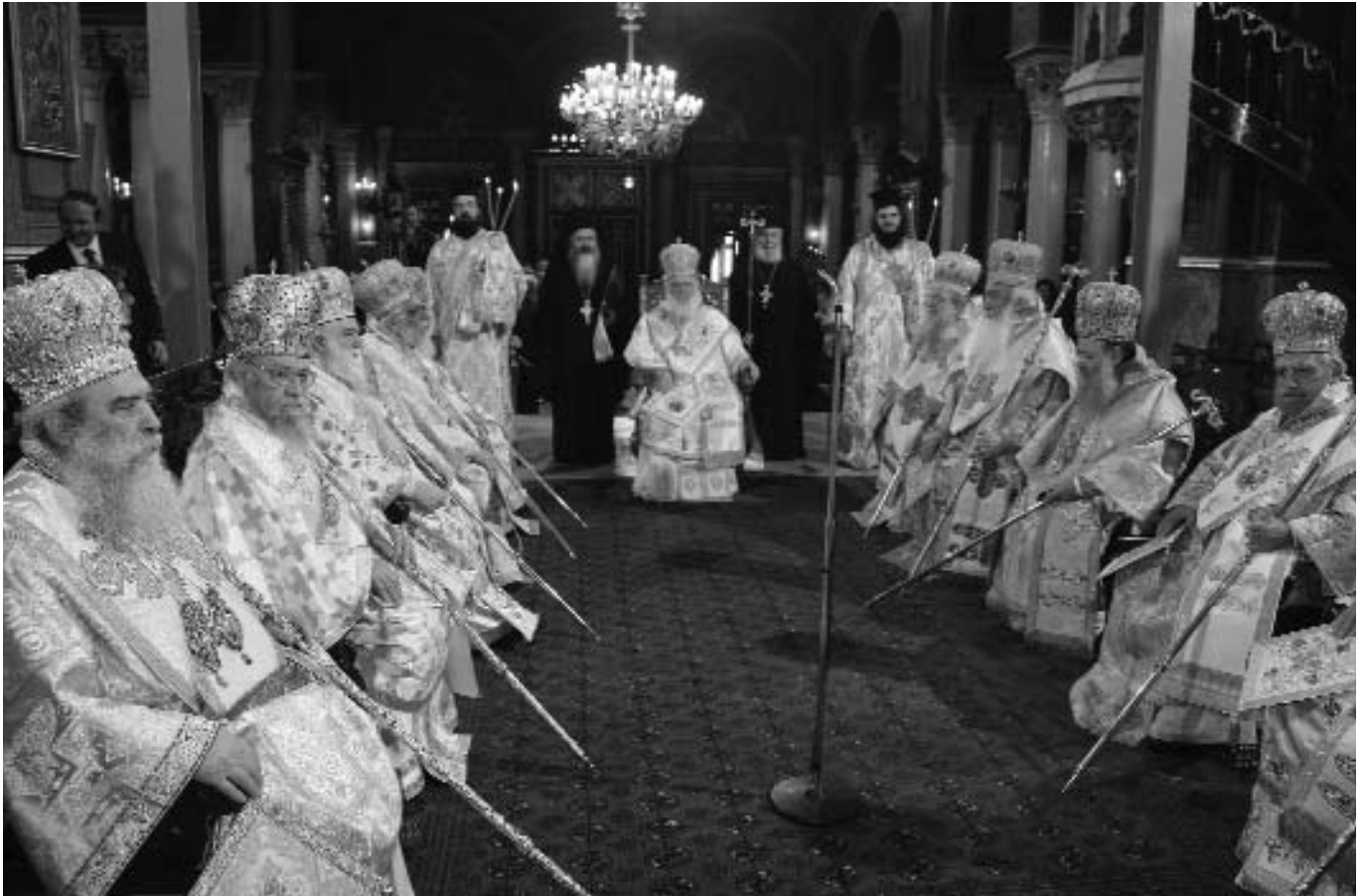
Ἡ χορεία τῶν Σεβασμιωτάτων Ἀρχιερέων μελῶν τῆς ΔΙΣ, προεξάρχοντος τοῦ Μακαριωτάτου Προέδρου τῆς Ἀρχιεπισκόπου Ἀθηνῶν καὶ πάσης Ἑλλάδος κ. Ἱερωνύμου, κατὰ τὴν Κυριακὴ τῆς Ὁρθοδοξίας.

ἀπὸ ἀποδείξεις. Εἶναι μία προφάνεια πὸν γίνεται ἁγιογραφικὸ ἐπιχείρημα τῆς θείας ἀλήθειας. Τὸ νοητὸ περιεχόμενον τῶν εἰκόνων εἶναι δογματικόν, γι' αὐτὸ καὶ «ὠραία» δὲν εἶναι ἡ εἰκόνα ὡς ἔργο τέχνης, ἄλλ' ἡ ἀλήθειά της. Μία εἰκόνα δὲν μπορεῖ ποτὲ νὰ εἶναι «ὁμορφη», ἡ ὠραιότητά της ἀπαιτεῖ μία πνευματικὴ ὠριμότητα γιὰ νὰ τὴν ἀναγνωρίσωμε. Εἶναι ὑπέροχο τὸ θαυμάσιο χάρισμα κάθε πλάσματος νὰ εἶναι μορφή, κάτοπτρο τοῦ ἄπλαστου. Αὐτὸ τὸ ὕψος τῆς θεοπνευστίας προϋποθέτει ἡ χαρισματικὴ διακονία τῶν «ἁγίων ἁγιογράφων» καὶ ὁδηγεῖ ἀπὸ τὴν τέχνη σὲ «ἱερὴ τέχνη».