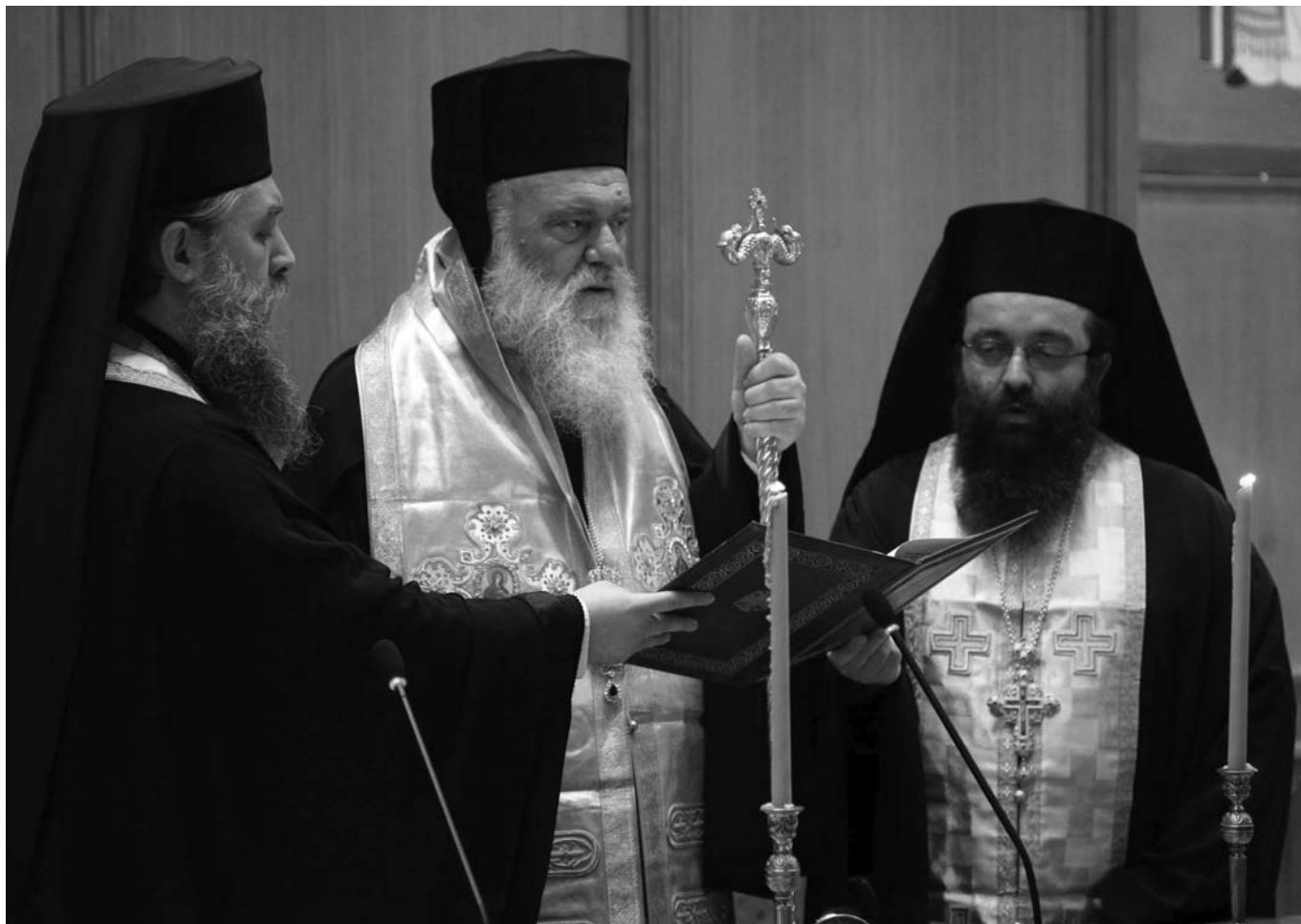
Ὁ Μακαριώτατος Ἀρχιεπίσκοπος Ἀθηνῶν καὶ πάσης Ἑλλάδος κ. Ἱερώνυμος τελεῖ τὸν Ἁγιασμό πρὸ τῆς ἐνάρξεως τῶν ἐργασιῶν τῆς Ἱερᾶς Συνόδου τῆς Ἱεραρχίας.

Ἀκολούθησε ἡ διαδικασία τῆς πληρώσεως τῆς Ἱερᾶς Μητροπόλεως Λευκάδος καὶ Ἰθάκης δι' ἐκλογῆς. Γιὰ τὴν κατάρτιση τοῦ τριπροσώπου ἐπὶ συνόλου 73 ψηφισάντων ἔλαβαν: