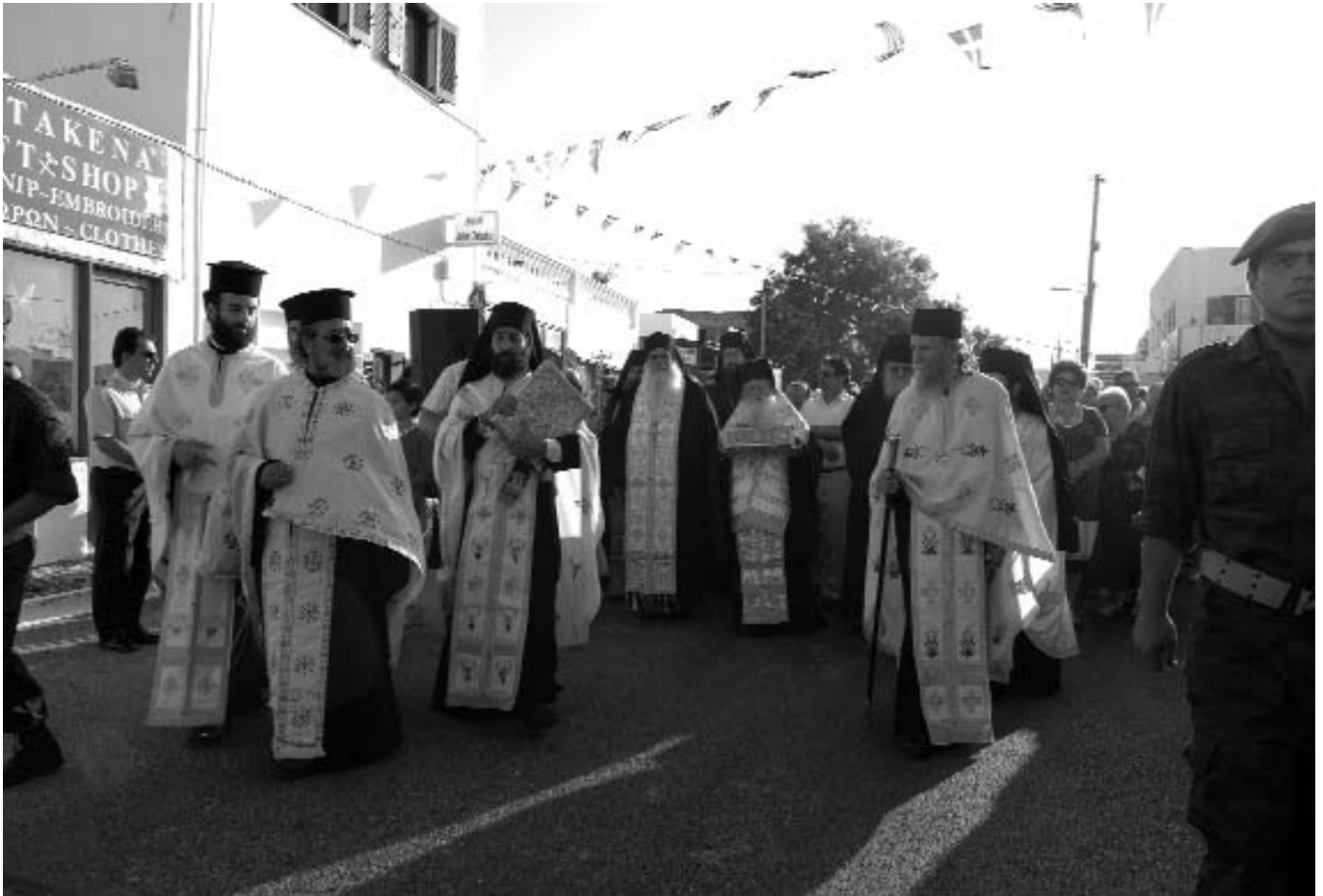
Ἡ ὑποδοχὴ τῶν Τιμίων Δώρων στὴν νῆσο Θήρα (4.6.2008).

χει πληρότητα στὸν ἄνθρωπο, διότι «οὐκ ἐπ' ἄρτω μόνῳ ζήσεται ἄνθρωπος, ἀλλ' ἐπὶ παντὶ ρήματι ἐκπορευομένῳ διὰ στόματος Θεοῦ (Ματθ. Δ', 4)».