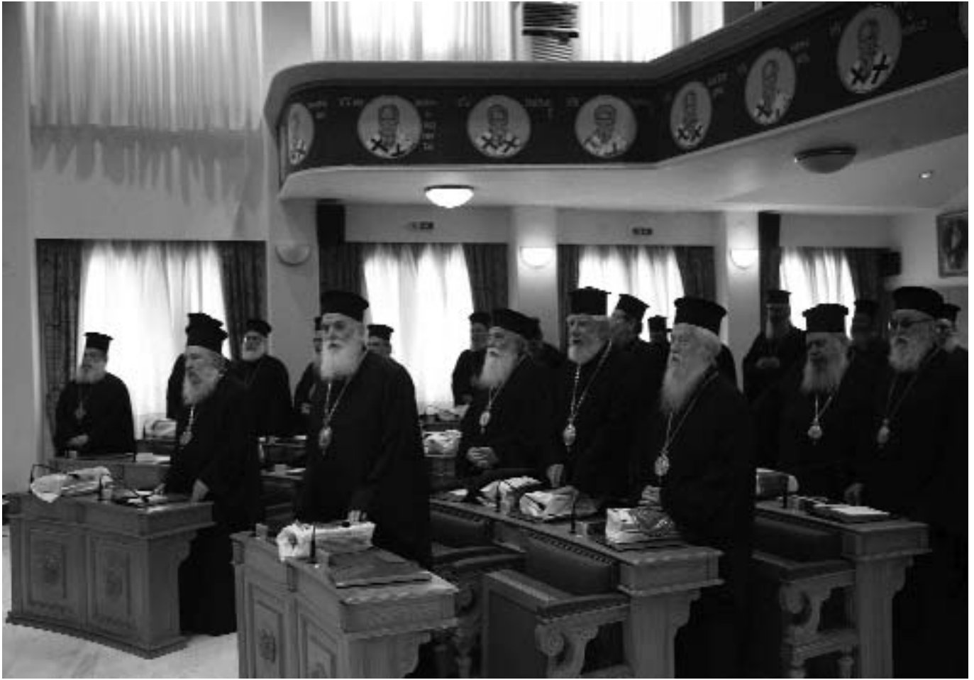
Στιγμιότυπο ἀπὸ τὴν Ἑκτακτὴ Σύγκληση τῆς Ι.Σ.Ι.

Ἐπειτα ἄρχισε ἡ διαδικασία πληρώσεως τῆς Ἱερᾶς Μητροπόλεως Παροναξίας δι' ἐκλογῆς. Γιὰ τὴν κατάρτιση τοῦ τριπροσώπου ἐπὶ συνόλου 73 ψηφισάντων ἔλαβαν: