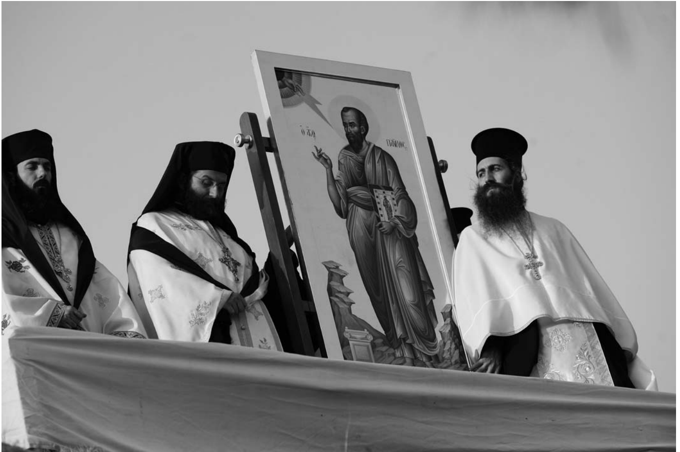
Ὁ Πανηγυρικός Ἐσπερινὸς εἰς ἀνάμνησιν τῆς διδασκαλίας τοῦ Ἀπ. Παύλου στὴν Ἀθήνα ἐτελέσθη στίς 29.6.2008 στὸ Βράχο τοῦ Ἀρείου Πάγου, μερίμνη τῆς Ἱερᾶς Ἀρχιεπισκοπῆς Ἀθηνῶν.

σων μαζικῆς ἐνημέρωσης καὶ τοῦ διαδικτύου ἐνισχύουν τὴν ἀποδόμηση παραδοσιακῶν θεσμῶν καὶ ἀξιών καὶ ἔχουν ἐπίπτωση στὰ θεμέλια τοῦ πολιτισμοῦ μας, καὶ μεταξὺ ἄλλων συνεπικουροῦν σὲ μία συνεχῶς ἐπιτεινόμενη οἰκολογικὴ κρίση γιὰ τὸ περιβάλλον.