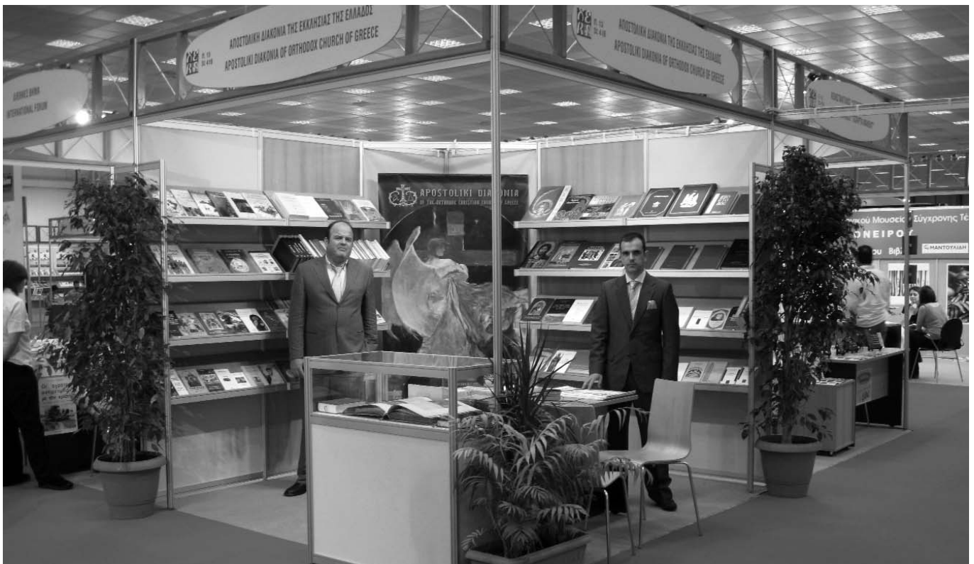
Τὸ Περίπτερο τῆς Ἀποστολικῆς Διακονίας στὴν 5η Διεθνῆ Ἐκθεση Βιβλίου.

Οἱ πύλες τῆς ἐκθεσης ἀνοίξαν τὴν Πέμπτη 29 Μαΐου, στὶς 10 τὸ πρωί, καὶ ἔκλεισαν τὸ βράδυ τῆς Κυριακῆς