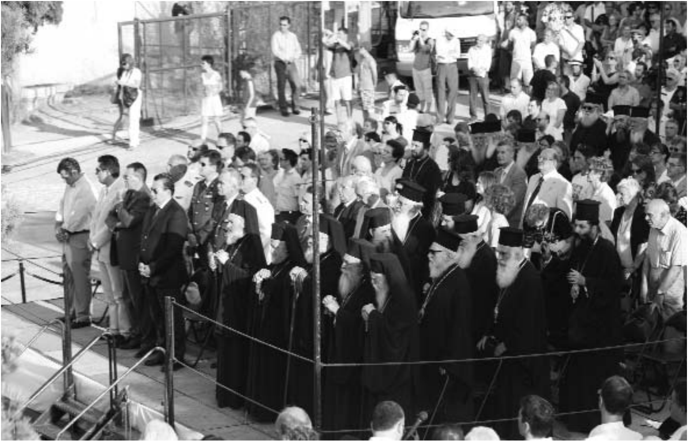
Μέλη της Δ.Ι.Σ. και ἄλλοι Ἱεράρχες παρακολοθοῦν τὸν Ἑσπερινὸ τοῦ Ἀποστόλου Παύλου μαζί με τὸν Ὑπουργὸ Ἐθνικῆς Παιδείας καὶ Θρησκευμάτων κ. Εὐριπίδη Στυλιανίδη καὶ τοὺς λοιποὺς ἐπισήμους.

Σήμερα, ὅσο ποτὲ ἄλλοτε, πρέπει νὰ μᾶς προβληματίσει ἡ στάση τῶν συνανθρώπων μας πού ζοῦν καὶ κινοῦνται μακρὰν τοῦ ἐκκλησιαστικοῦ γεγονότος. Σχεδὸν στὸ σύνολό τους θεωροῦν τὴν παρουσία τῆς Ἐκκλησίας στὸ σύγχρονο κόσμο σὰν ἕνα γοητευτικὸ κατάλοιπο ἐνὸς λαμπροῦ ἴσως παρελθόντος, πού θέλουν νὰ πιστεύουν ὅτι σήμερα κατάντησε νὰ ἀντιμάχεται τὴ ζωὴ καὶ τὴν πρόοδο.