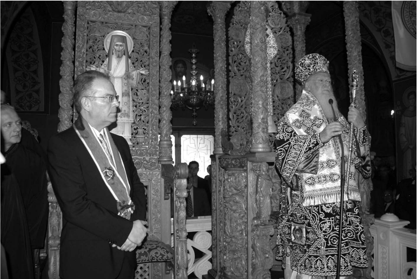
‘Ο Παναγιώτατος Οικουμενικός Πατριάρχης κ. Βαρθολομαῖος με τὸν Ὑπουργὸ Μακεδονίας - Θράκης κ. Μ. Τζίμα στὸν Καθεδρικό Ναὸ τῆς Δράμας.

ὑπερβαίνειν χαλασμοὺς καὶ καταποντισμοὺς, ἱκανοὺς καθιστᾶτε ἡμᾶς εἰς τὸ ἐξάγειν ἐκ τῶν χειρίστων δεδομένων τὸ ἄριστον δυνατόν.