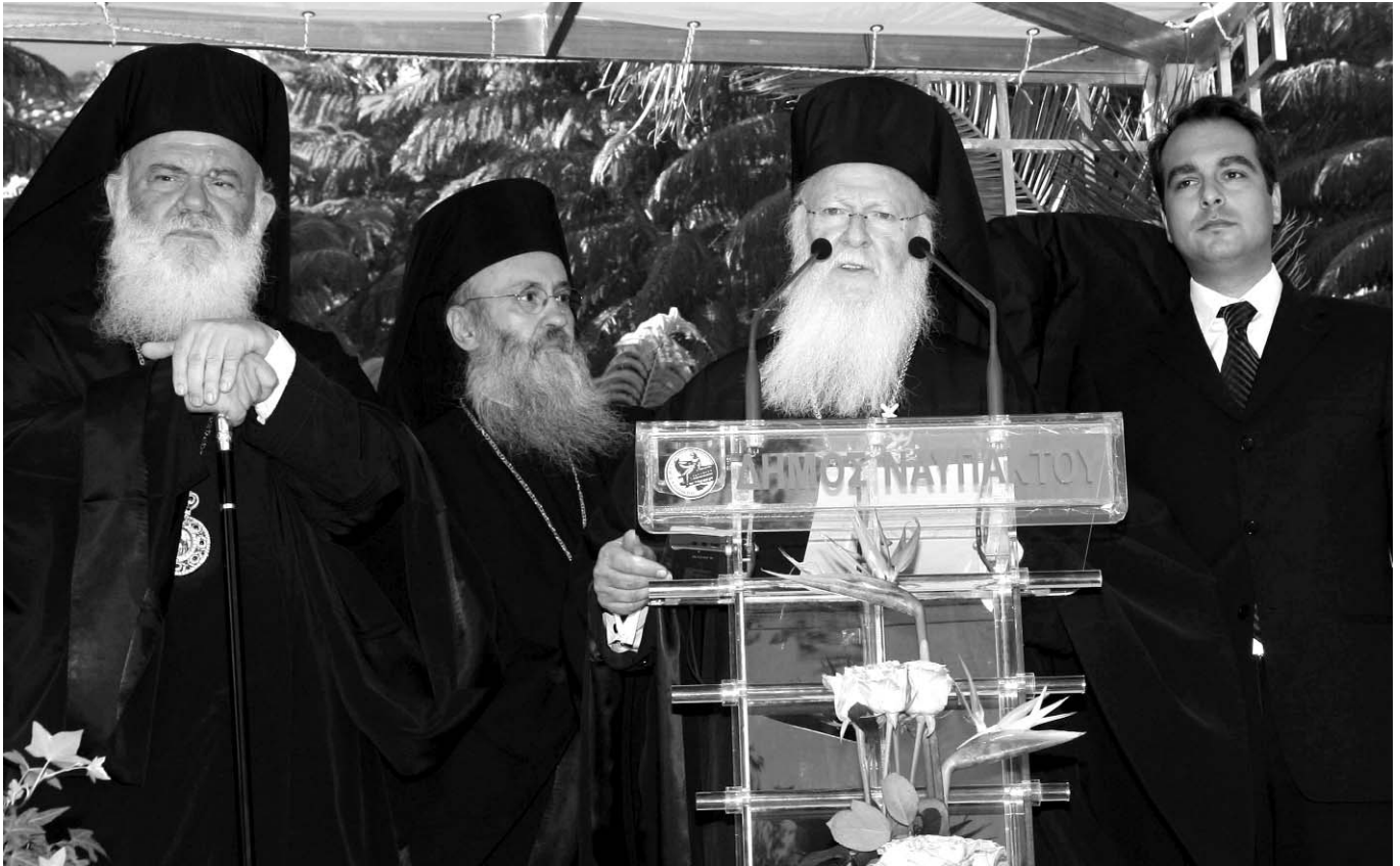
Ὁ Παναγιώτατος Οἰκουμενικὸς Πατριάρχης κ. Βαρθολομαῖος, ὁ Μακαριώτατος Ἀρχιεπίσκοπος Ἀθηνῶν καὶ πάσης Ἑλλάδος κ. Ἱερώνυμος καὶ ὁ Σεβασμιώτατος Μητροπολίτης Ναυπάκτου κ. Ἱερόθεος κατὰ τὴν ὑποδοχὴ τοῦ Πατριάρχου ἀπὸ τὸν Δήμαρχο Ναυπάκτου κ. Ἀθ. Παπαθανάση.

σιαστικές Ἐπαρχίες εἶναι Μητροπόλεις τοῦ Οἰκουμενικοῦ Θρόνου ἐν Ἑλλάδι, ἀγάπησα τὸ Οἰκουμενικὸ Πατριαρχεῖο, σεβάσθηκα τὸ ἔργο πού ἐπιτελεῖ, σεβόμεναι καὶ σέβομαι ἀπεριόριστα τὸν Προκαθήμενο αὐτοῦ. Ἰδιαίτερος αὐτὸ ἔγινε ἐπὶ τῶν ἡμερῶν Σας, διότι ἐξετίμησα τὰ ιδιαίτερα χαρίσματα μὲ τὰ ὁποῖα Σᾶς ἐπροίκισε ὁ Θεός, ἀλλὰ καὶ τὴν εὐαισθησία καὶ τὴν ιδιαίτερη ἀγάπη μὲ τὴν ὁποία περιέβαλε καὶ περιβάλλει καὶ τὴν ἐλαχιστότητά μου. Αὐτὸ εἶναι τὸ μεγαλεῖο τῆς Ὁρθοδόξου Ἐκκλησίας στὴν ὁποία οἱ μεγάλοι δέχονται καὶ ἐπαινοῦν καὶ τοὺς μικροὺς. Ἐκφράζω δημοσίως τὶς εὐχαριστίες μου καὶ τὴν εὐγνωμοσύνη μου πρὸς τὸ τίμο πρόσωπό Σας.