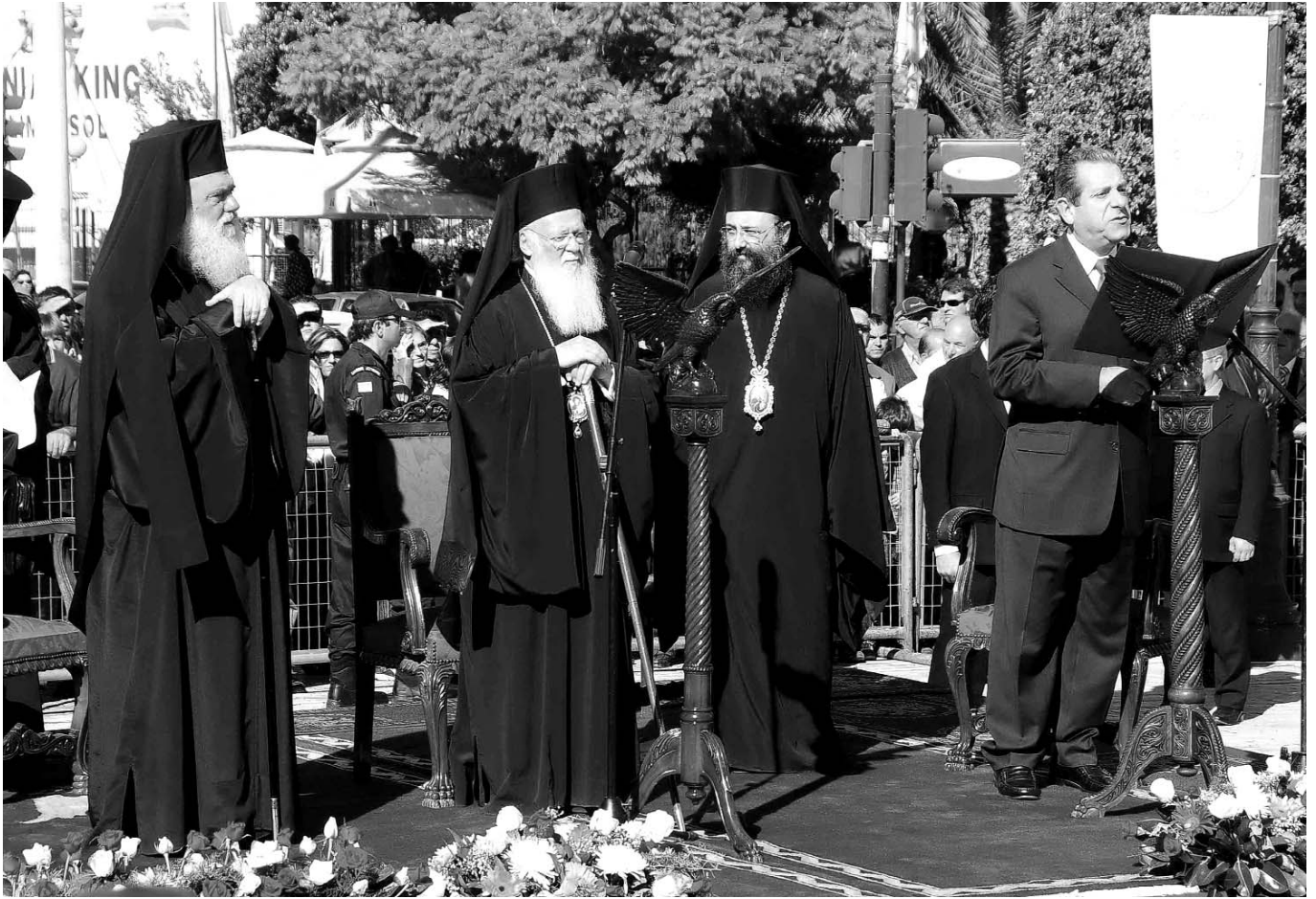
Ὁ Παναγιώτατος Οἰκουμενικὸς Πατριάρχης κ. Βαρθολομαῖος, ὁ Μακαριώτατος Ἀρχιεπίσκοπος Ἀθηνῶν καὶ πάσης Ἑλλάδος κ. Ἱερώνυμος καὶ ὁ Σεβασμιώτατος Μητροπολίτης Πατρῶν κ. Χρυσόστομος κατὰ τὴν ἐπίσημη ὑποδοχὴ τοῦ Πατριάρχου ἀπὸ τὸν Δήμαρχο Πατραίων κ. Α. Φούρα.

σον, καὶ τὰ κοινὰ τῶν Πατέρων ἦθη, ἡ κοινὴ Πίστις καὶ πνευματικότης καὶ λειτουργικὴ προᾶξις, τὸ ὁμόψυχον καὶ ὁμοκάρδιον καὶ ὁμόφωνον τῆς γνώμης καὶ τοῦ φρονήματος, καὶ ὁ ἀρχαῖος ἀδελφικὸς σύνδεσμος τῆς εἰρήνης καὶ τῆς ἀγάπης, οὐδέποτε ἐπέτρεψαν νὰ μακρυνθῆ τὸ παράπαν ἡ καρδιά τῆς Μητρὸς Ἐκκλησίας ἀφ' ὑμῶν, ἀλλ' εὐρίσκεσθε πάντοτε κυριολεκτικῶς εἰς τὸ κέντρον τῆς, ὅπως εὐρίσκεσθε καὶ εἰς τὸ κέντρον τῶν προσευχῶν μας. Ἡ δόξα σας εἶναι δόξα μας “ἡ χαρὰ σας εἶναι χαρὰ μας” ἡ πρόοδος σας εἶναι καὶ ἰδική μας, ὅπως, ἐξ ἀντιθέτου καὶ ὁ πόνος σας εἶναι πόνος μας καὶ τὰ προβλήματα σας εἶναι προβλήματα μας. Οὕτω καὶ ὁ σεισμὸς ποὺ σᾶς ἐπληξεν, ἐδόνησε καὶ ἡμῶν τὰς καρδίας, καὶ αἱ πυρκαϊαί, αἱ ὁποῖαι ἔκαυσαν ἐνωρίτερον τὰς περιουσίας σας, ἐνεπύρισαν καὶ ἡμῶν τὴν ψυχὴν, καὶ εἴμεθα συμπάσχοντες, συνοδυνώμενοι, ἀλλὰ καὶ συμπροσευχόμενοι