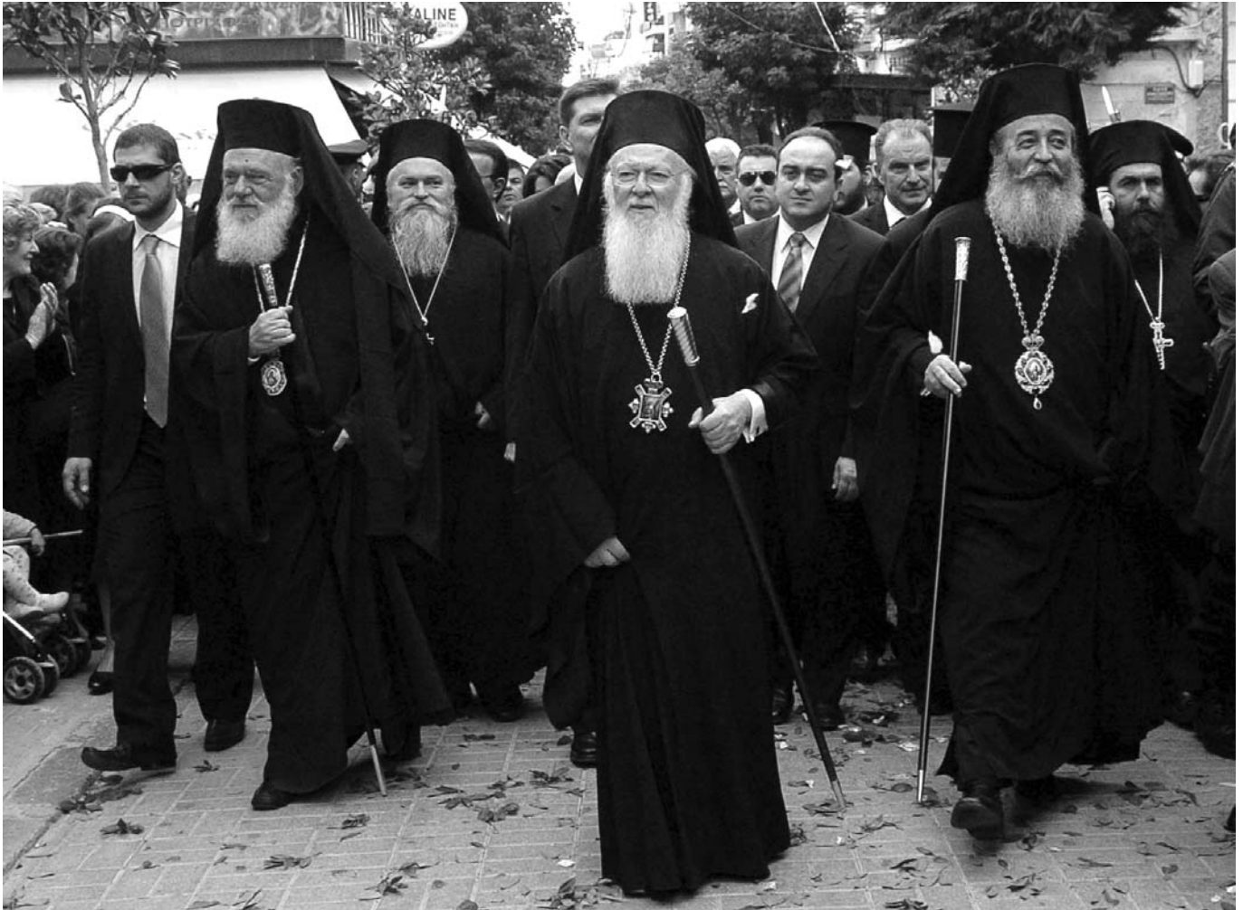
Ὁ Παναγιώτατος Οἰκουμενικὸς Πατριάρχης κ. Βαρθολομαῖος, ὁ Μακαριώτατος Ἀρχιεπίσκοπος Ἀθηνῶν καὶ πάσης Ἑλλάδος κ. Ἱερώνυμος καὶ ὁ Σεβασμιώτατος Μητροπολίτης Φθιώτιδος κ. Νικόλαος κατὰ τὴν ὑποδοχὴ τοῦ Πατριάρχου ἀπὸ τὸν λαὸ τῆς Λαμίας.

νήσεώς του ὁ Σεβασμιώτατος προσέφερε στὸν Πατριάρχη ὡς δῶρο ἐκ μέρους τοῦ Διοικητικοῦ Συμβουλίου τοῦ Ἰδρύματος ἕναν ἀσημένιο Σταυρὸ εὐλογίας. Τὸν Παναγιώτατο προσεφώνησε καὶ ἡ Δήμαρχος Στυλίδος κ. Ἀλεξάνδρα Καραγεώργου-Σχορετσανίτου, ἡ ὁποία ἀνακοίνωσε τὴν ἀπόφαση τοῦ Δημοτικοῦ Συμβουλίου γιὰ τὴν ἀνακήρυξη τοῦ Παναγιωτάτου ὡς Ἐπίτιμου Δημότη τοῦ Δήμου Στυλίδος καὶ τοῦ προσέφερε ὡς συμβολικὸ δῶρο ἕνα στεφάνι ἐλιᾶς. Ἀκολούθησε ἡ ἀντιφώνηση τοῦ Παναγιωτάτου καὶ ἡ ἀποκάλυψη τῆς ἀναμνηστικῆς πλάκας. Στὴ συνέχεια ὁ Οἰκουμενικὸς Πατριάρχης κ. Βαρθολομαῖος, ὁ Μακαριώτατος Ἀρχιεπίσκοπος Ἀθηνῶν, οἱ Σεβασμιώτατοι Ἀρχιερεῖς, οἱ ἐπίσημοι ἀλλὰ καὶ ὁ κόσμος ποὺ εἶχε συγκεντρωθεῖ γιὰ νὰ ἐπευφημήσει τὸν Πατριάρχη