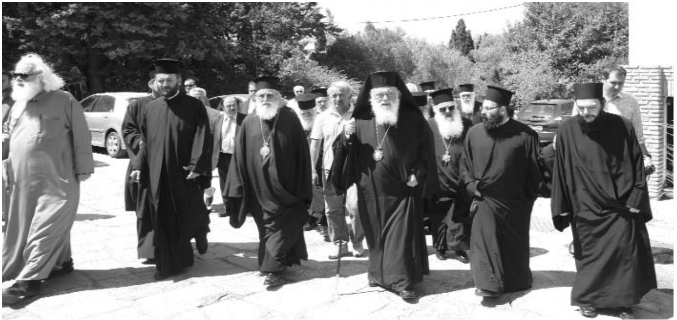
Ο Μακαριώτατος Αρχιεπίσκοπος Αθηνών και πάσης Ελλάδος κ. Ιερώνυμος και οι συνεργάτες του επισκέφθηκαν στις 24.8.2009 τις πληγείσες από τη φωτιά περιοχές της Αττικής.

τις γενιές των νέων δικαστικών λειτουργιών που θα ακολουθήσουν. Έργο, που σμιλεύτηκε με μεράκι. Πλάστηκε με θυσία, ποτίστηκε με ιδρώτα και ανδρώθηκε με στέρψη και ξενύχτι.