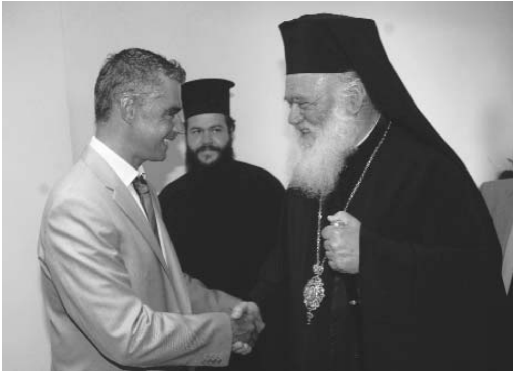
Στιγμιότυπο από την συνάντηση του Μακαριωτάτου Ἀρχιεπισκόπου Ἀθηνῶν καὶ πάσης Ἑλλάδος κ. Ἱερωνύμου μετὸν Ὑπουργὸ Ἐθνικῆς Παιδείας καὶ Θρησκευμάτων κ. Ἰ. Ἀρ. Σπηλιωτόπουλο.

σκοπος Ἀθηνῶν καὶ πάσης Ἑλλάδος κ. Ἱερώνυμος Β΄, συνοδευόμενος ἀπὸ τὸν Πρωτοσύγκελλο τῆς Ἱερᾶς Ἀρχιεπισκοπῆς Ἀθηνῶν, Ἀρχιμ. Γαβριὴλ Παπανικολάου, τὸν Διευθυντὴ τοῦ Ἰδιαίτερου Γραφείου τοῦ Ἀρχιεπισκόπου, Ἀρχιμ. Ἀθηνᾶγορα Δικαίᾶκο καὶ τὸν Διευθύνοντα Σύμβουλο τῆς Μ.Κ.Ο. “Ἀθληηγγύη” τῆς Ἐκκλησίας τῆς Ἑλλάδος, κ. Κωστῆ Δήμτσα.