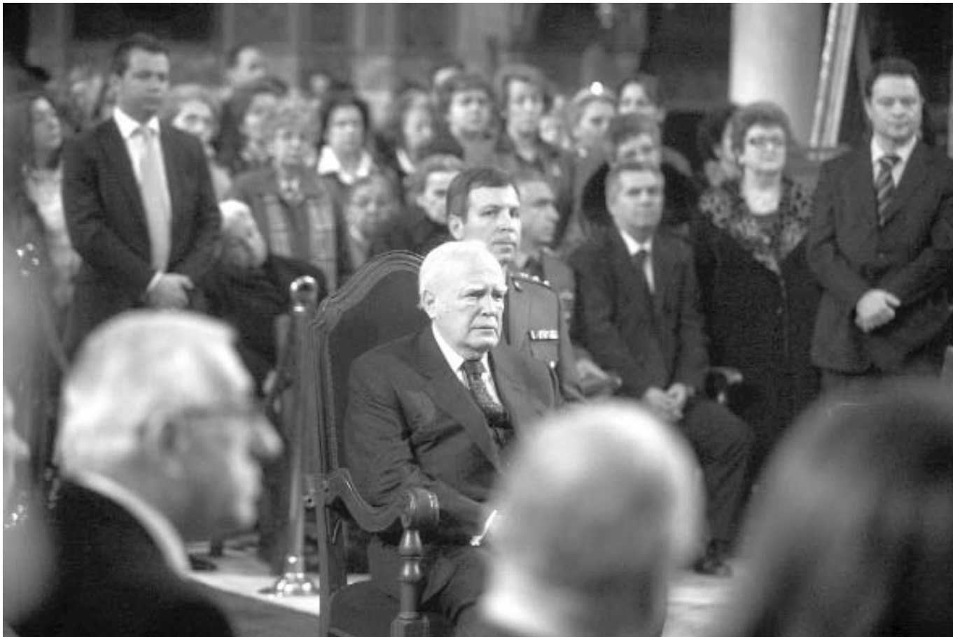
Ο Πρόεδρος της Δημοκρατίας κ. Κάρολος Παπούλιας παρέστη στον Πανηγυρικό έορτασμό της Κυριακής της Όρθοδοξίας στον Ί. Ναό Αγίου Διονυσίου Αρεοπαγίτου.

Στην χρήση τους για την λατρεία του Κυρίου όλα αυτά αγιάζονται. Άλλα δεν θεανθρωποποιούνται.