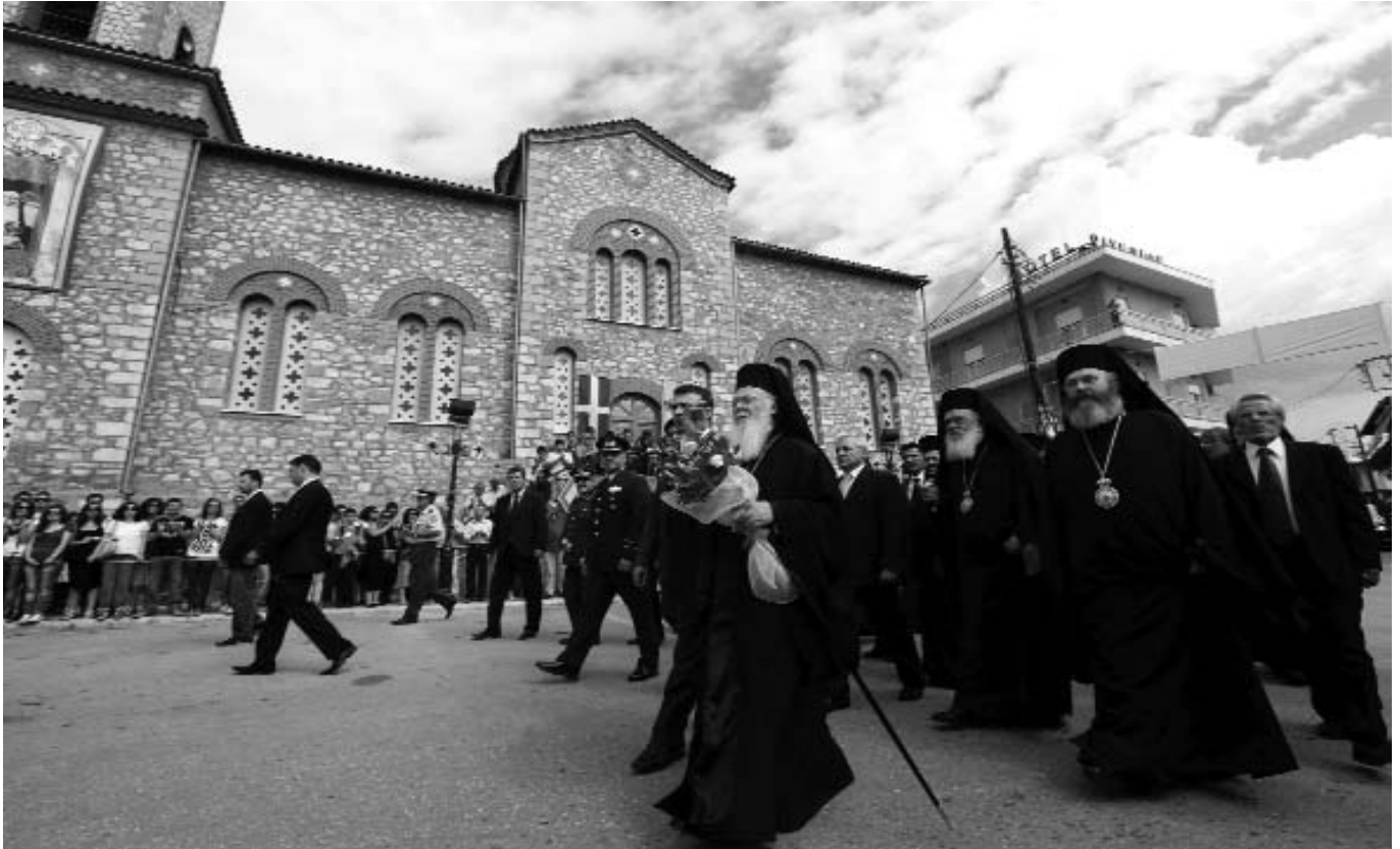
Ἀπὸ τὴν ὑποδοχὴ τῆς Α.Θ.Π. τοῦ Οἰκουμενικοῦ Πατριάρχου στὴν Ἐλασσώνα. Διακρίνονται ὁ Μακαριώτατος Ἀρχιεπίσκοπος Ἀθηνῶν καὶ πάσης Ἑλλάδος κ. Ἱερώνυμος καὶ ὁ Σεβ. Μητροπολίτης Ἐλασσῶνος κ. Βασίλειος.

Ἄλλ' εἶπομεν, ἀγαπητοί, ὅτι ἡ σημερινὴ εὐχαριστιακὴ σὺναξις, τῆς Κυριακῆς μετὰ τὴν Ὑψωσιν, συνδέεται ἀμέσως πρὸς τὸν Τίμιον Σταυρὸν τοῦ Κυρίου. Ὁ Σταυρὸς τοῦ Χριστοῦ, καθὼς γνωρίζετε, εἶναι ὄχι μόνον ὁ «φύλαξ πάσης τῆς οἰκουμένης», ἡ «ὠραιότης τῆς Ἐκκλησίας», τῶν «πιστῶν τὸ στήριγμα», τῶν «ιερέων ἢ εὐπρέπεια», τῶν «Ἀγγέλων ἢ δόξα καὶ τῶν δαιμόνων τὸ τραῦμα», ἀλλ' εἶναι καὶ ἡ μεγάλη κληρονομία καὶ σφραγὶς τῆς γνησιότητος τῆς κλήσεως ἡμῶν ὡς Χριστιανῶν, ἡ ἐλπίς καὶ τὸ καύχημά μας. «Ἐμοὶ δὲ μὴ γένοιτο καυχᾶσθαι, εἰ μὴ ἐν τῷ Σταυρῷ τοῦ Κυρίου ἡμῶν Ἰησοῦ Χριστοῦ, δι' οὗ ἔμοι κόσμος ἐσταύρωται καὶ γὰρ τῷ κόσμῳ» (Γαλ. 6:14), διακηρύττει ὁ Ἀπόστολος Παῦλος. Ἀσταύρωτος βίος διὰ τοὺς Χριστιανούς εἶναι ἀδιανόητος! Δὲν ὑφίσταται! Ὅσοι ἐκλαμβάνουν τὴν χριστιανικὴν ζωὴν ὡς ὑπόθεσιν συναισθηματικῆς πληρώσεως, ἱερῶν συγκινήσεων, ἐνθουσιαστικῶν ἐξάρσεων μέσα εἰς ἓνα «βίον ἀνθόσπαρτον», καὶ μεταφυσικῆς κατόπιν ἐξασφαλίσεως