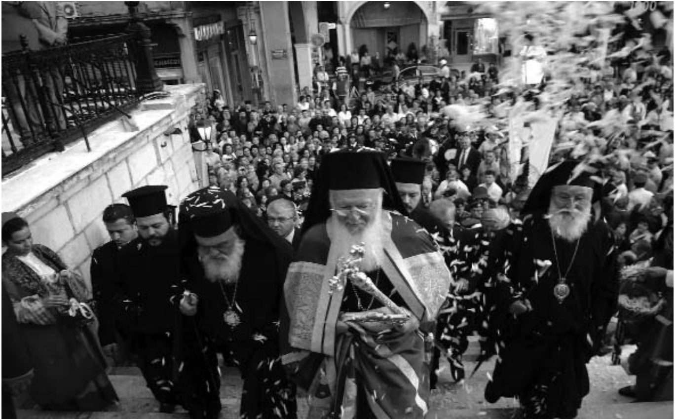
Ὁ λαὸς τῆς Τριπόλεως ραίνει μὲ ἄνθη τὸν Παναγιώτατο Οἰκουμενικὸ Πατριάρχη κ. Βαρθολομαῖο. Τὸν συνοδεύουν ὁ Μακαριώτατος Ἀρχιεπίσκοπος Ἀθηνῶν καὶ πάσης Ἑλλάδος κ. Ἱερόνυμος καὶ ὁ Σεβ. Μητροπολίτης Μαντινείας καὶ Κυνουρίας κ. Ἀλέξανδρος.

Σήμερα ἡ θεόσωστος αὕτη Μητρόπολις ποιμαίνεται ἐλέω Θεοῦ ὑπὸ τοῦ Ἀρχάδος πεφιλημένου ἡμῖν ἀδελφοῦ, τοῦ ἀξίου κατὰ πάντα Ἱερωτάτου Μητροπολίτου κυρίου Ἀλεξάνδρου.