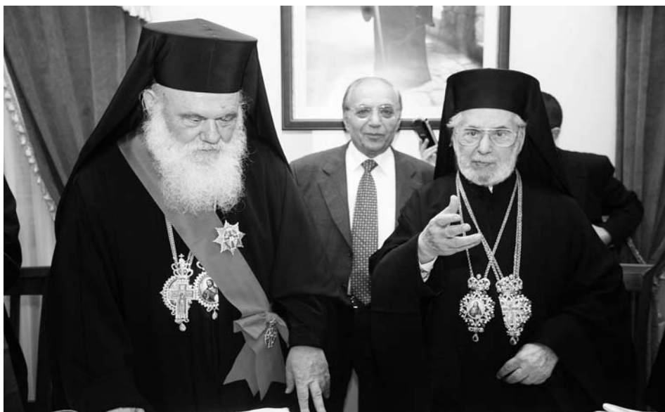
Ό Πατριάρχης Άντιοχείας κ. Ίγνάτιος απένεμε στον Προκαθήμενο τής Έκκλησίας τής Ελλάδος τήν ανώτατη τιμητική διάκριση του Πατριαρχείου Άντιοχείας.

Η «Άποστολή» θά έχει έδρα τόσο στή Δαμασκό, όσο και στο πανεπιστήμιο του Balamand και, σύμφωνα μέ τό μνημόνιο, οί τομείς συνεργασίας τών δύο πλευρών άφορούν στήν κοινωνική συνοχή, τό περιβάλλον, τήν παγκόσμια πολιτιστική κληρονομιά και αρχιτεκτονική, τόν πολιτισμό, τόν τουρισμό καθώς και τή βοήθεια αναβάθμισης του βιοτικού επιπέδου τών λαών τών αναπτυσσόμενων χωρών.