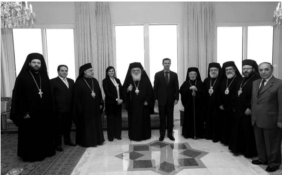
Ὁ Μακαριώτατος καί ἡ συνοδεία του μέ τόν Πρόεδρο τῆς Συρίας κ. Ἄσαντ.

Ὁ Μακαριώτατος τέλεσε τρισάγιο γιά τούς ὀρθόδοξους χριστιανούς πού ἔχασαν τή ζωή τους στήν περιοχή ἐξαιτίας τοῦ πολέμου. «Ὅλοι οἱ πνευματικοί ἡγέτες, χριστιανοί, μουσουλμάνοι καί ἄλλοι, ἔχουν τήν εὐθύνη νά συμβάλουν στό τέλος τῶν πολέμων.