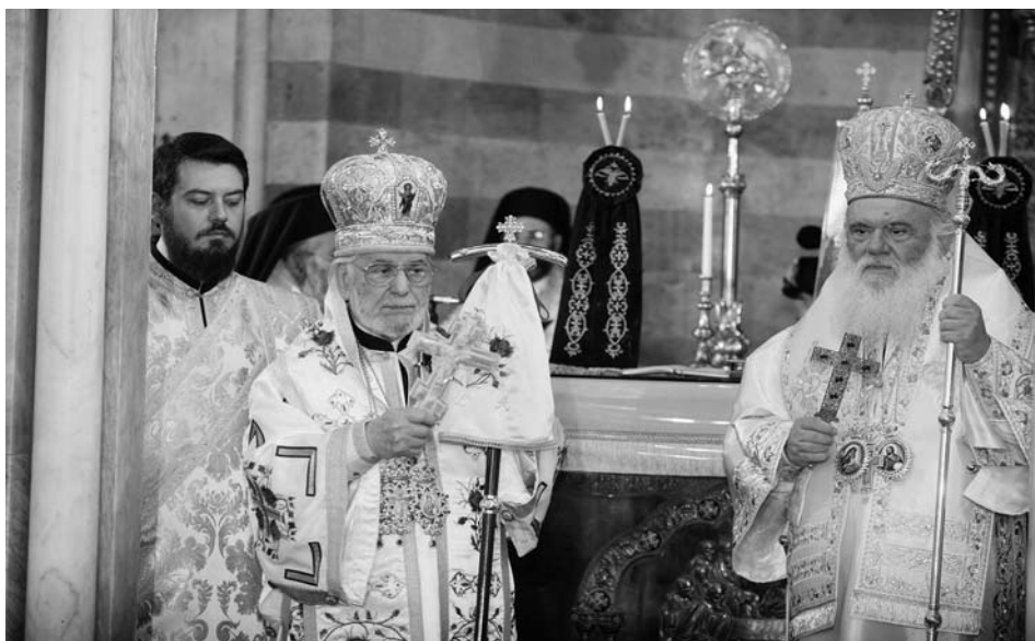
Ὁ Μακαριώτατος Πατριάρχης Ἀντιοχείας κ. Ἰγνάτιος καί ὁ Μακαριώτατος Ἀρχιεπίσκοπος Ἀθηνῶν καί πάσης Ἑλλάδος κ. Γερώνυμος κατὰ τό Ἀρχιερατικό Συλλείτουργο στή Δαμασκό (30.1.2011).

Δοξάζουμε τόν Θεάνθρωπον Χριστόν, τήν ἔνδοξη Κεφαλή τῆς Ἐκκλησίας, πού μᾶς ἐνώνει στό ἴδιο τό Σῶμα Του. Ὑμνοῦμε τόν Τριαδικόν Θεόν γιά τούς κοινούς Ἁγίους μας, ὅπως τόν Ἀπόστολον Παῦλον καί τόν ἅγιον Ἰωάννην τόν Χρυσόστομον, τόν ἅγιον Ἰωάννην τόν Δαμασκηνόν καί πολλούς ἄλλους διδα-