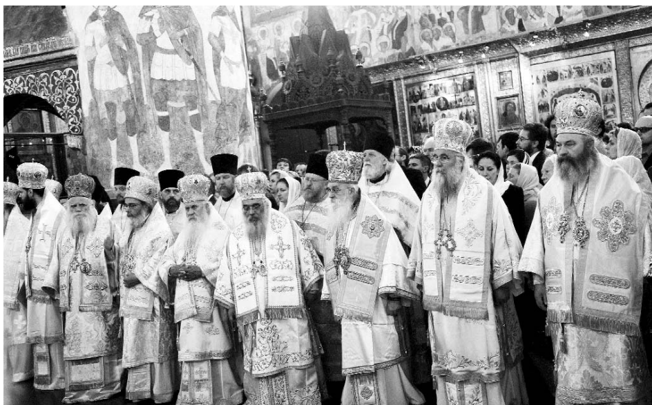
Τά Μέλη τῆς Διαρκοῦς Ἱεράς Συνόδου, τά ὁποῖα συνόδευσαν τόν Μακαριώτατο κατά τήν ἐπισκεψή του στήν Ἐκκλησία τῆς Ρωσίας.

Ὁ ἡγούμενος Θεοδόσιος, ὁ ὁποῖος διαδέχθηκε τόν Βαρλαάμ (1062), ἀναδείχθηκε σέ ἐξέχουσα μορφή τοῦ ρωσικοῦ μοναχισμοῦ ὄχι μόνο γιατί κατά τήν περίοδο τῆς ἡγεμονίας τοῦ (1062-1074) ἡ Λαύρα γνώρισε μεγάλη ἀνάπτυξη σέ ἀριθμό καί σέ ποιότητα μοναχῶν, ἀλλά καί γιατί ὑπῆρξε ὁ μεγαλύτερος ὄραματιστής τοῦ ἰδιαίτερου πνευματικοῦ ρόλου τοῦ μοναχισμοῦ στή Ρωσία. Ἡ συμβολή τῆς Λαύρας ἦταν μεγάλη τόσο γιά τή διάδοση τῆς χριστιανικῆς πίστεως σέ ὅλες τίς ἡγεμονίες τῆς Ρωσίας, ὅσο καί γιά τήν αὐθεντική βίωση ἀπό τούς πιστούς τῆς ἀσκητικῆς πνευματικότητας τῆς ἐν Χριστῷ καινῆς ζωῆς. Ἀπό τούς ζηλωτές μοναχούς τῆς Λαύρας ἀναδείχθηκαν οἱ πρώτοι ἅγιοι τῆς Ἐκκλησίας τῆς Ρωσίας, πολλοί ἐπίσκοποι τῶν νεοσύστατων ἐπισκοπῶν στίς ρωσικές ἡγεμονίες, πολλοί ἡγούμενοι τῶν ἰδρυομένων νέων μο-