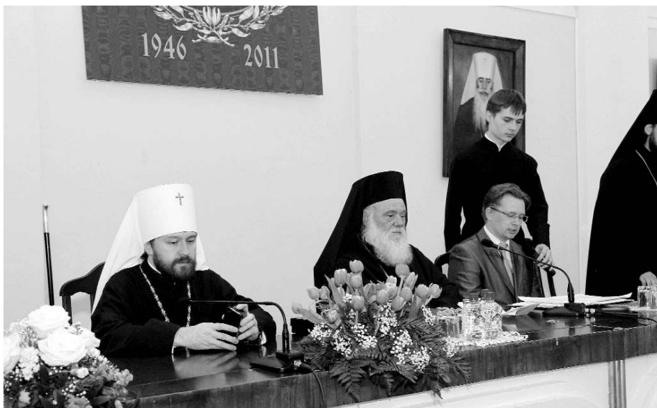
Ὁ Μακαριώτατος Ἀρχιεπίσκοπος Ἀθηνῶν καὶ πάσης Ἑλλάδος κ. Ἱερώνυμος ἐκφωνεῖ ὁμιλία στὴν Θεολογικὴ Ἀκαδημία τῆς Ἁγίας Πετρούπολεως πλαισιούμενος ἀπὸ τὸν Σεβ. Μητροπολίτη τοῦ Βολοκολάμσκ κ. Ἰλαρίωνα τῆς Ρωσικῆς Ἐκκλησίας.

Ὁ διάλογος αὐτός προέκυψε ἀπὸ τὴν ὀξύτατη διαλεκτικὴ ἀντιπαράθεση μεταξὺ τῆς ἐκκλησιαστικῆς ὀρθοδοξίας καὶ τῶν ἀκραίων αἰρετικῶν προκλήσεων γιά τὴν ἐρμηνεία τῆς σχέσεως τοῦ ἀνθρώπου μέ τὸν Θεὸ καὶ μέ τὸν κόσμον, ἡ ὁποία ἐντασσόταν στὴ διαδικασία προσλήψεως τοῦ ἀνθρωπίνου γένους στὴ νέα ἐν Χριστῷ πραγματικότητα καὶ ἐκκλησιαστικοποίησε τοῦ κόσμου. Ὑπὸ τὴν ἐννοια αὐτὴ, τό πρόσωπο καὶ τό ἔργο τοῦ Χριστοῦ, τό ὁποῖο προσδιορίζει καὶ τὴν ταυτότητα τῆς Ἐκκλησίας, τέθηκε σὸ ἐπίκεντρο τῆς διαλεκτικῆς αὐτῆς ἀντιπαράθεσεως καὶ ἀπασχόλησε ὄχι μόνο τοὺς ἐγκρίτους Πατέρες, ἀλλὰ καί τὶς ἐπτὰ Οἰκουμενικὲς Συνόδους τῆς πρώτης χιλιετίας τοῦ ἱστορικοῦ βίου τῆς Ἐκκλησίας, οἱ ὁποῖες διακήρυξαν ἀφ' ἐνός μὲν τὴ φυσικὴ θεότητα τοῦ Υἱοῦ καὶ