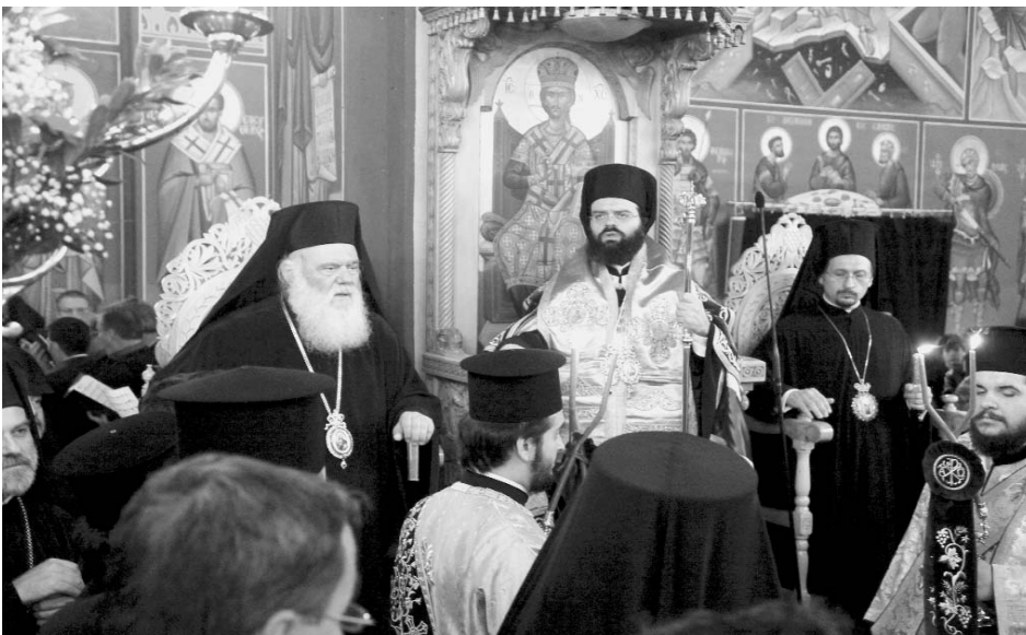
Στιγμιότυπο από τήν τελετή Ένθρονίσεως του Μητροπολίτου Μαρωνείας και Κομοτηνής κ. Παντελεήμονος.

Γινόμαστε μέτοχοι στόν τρόπο ύπάρξεως του Τριαδικού Θεού, τόν όποιο τρόπο, μετά τήν Θεία Λειτουργία, πρέπει νά μεταφέρουμε μέσα στήν κοινωνία απλά και άθόρυβα. Αν εφαρμόσουμε αὐτή τήν αρχή, δηλαδή ότι ό άνθρωπος γιά τήν Έκκλησία δέν υπάρχει, ως κάτι τό έντελῶς άνε-