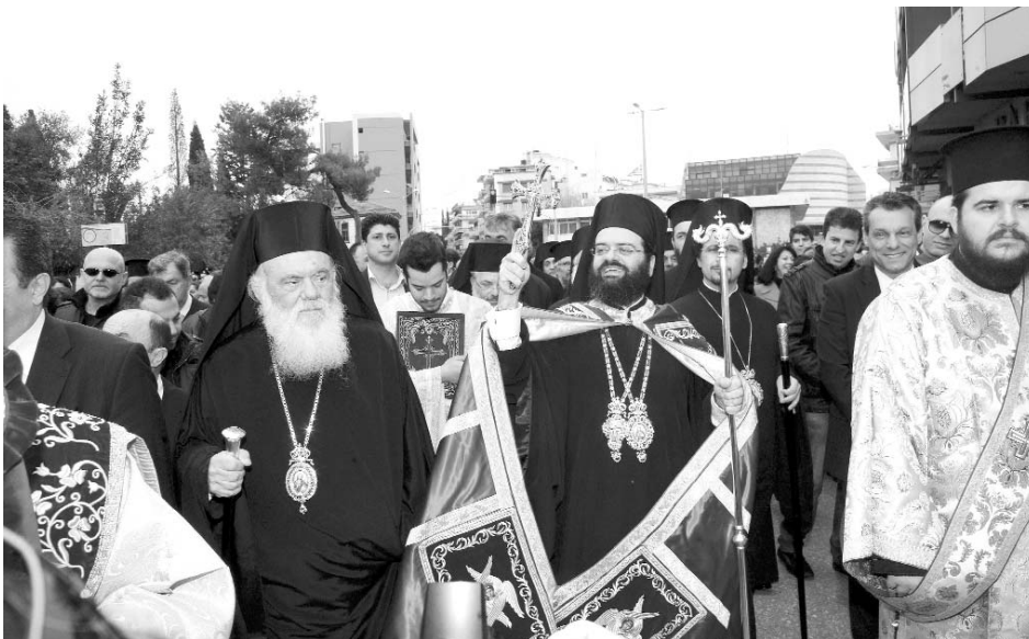
Στιγμιότυπο ἀπό τήν ὑποδοχή τοῦ Μακαριωτάτου Ἀρχιεπισκόπου Ἀθηνῶν και πάσης Ἑλλάδος κ. Γερωνύμου και τοῦ νέου Μητροπολίτου κ. Παντελεήμονος στήν Κομοτηνή.

Ἐπομένως, ὁ Χριστός προσδιορίζεται σέ σχέση και ἀναφορά μέ ἕνα ἄλλο πρόσωπο, τό πρόσωπο τοῦ Θεοῦ Πατέρα. «Κάθε πρόσωπο τῆς Ἁγίας