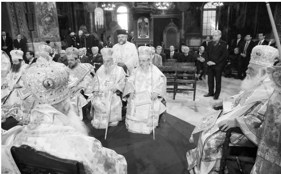
Ὁ Μακαριότατος Ἀρχιεπίσκοπος Ἀθηνῶν καὶ πάσης Ἑλλάδος κ. Ἱερώνυμος προεξήρχε τῆς Θείας Λειτουργίας συλλειτουργούντων Αὐτῷ μελῶν τῆς Διαρκοῦς Ἱεράς Συνόδου.

Ἡ Θεία Εὐχαριστία εἶναι ἡ ἐνεργοποίηση του νέου αἰῶνος μέσα στά τοπικά καὶ χρονικά πλαίσια του παλαιοῦ, ἡ διακήρυξη του ἐρχομένου αἰῶνος μέσα στον νῦν αἰῶνα. Μέσα στή Θεία Εὐχαριστία ὁ Ὁρθόδοξος Πιστός καταλλάσσεται μέ τόν ἑαυτό του «ἐν εἰρήνῃ του Κυρίου δεηθῶμεν», καταλλάσσεται μέ τόν Θεό «ὑπὲρ τῆς ἄνωθεν εἰρήνης», καὶ καταλλάσσεται μέ τοὺς ἀδελφούς του «ὑπὲρ τῆς εἰρήνης του σύμπαντος κόσμου».