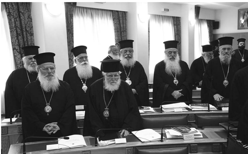
Στιγμιότυπο ἀπό τήν ἔναρξη τῶν ἐργασιῶν τῆς Ἱεράς Συνόδου τῆς Ἱεραρχίας.

Ὁ γάμος καί ἡ οἰκογένεια, γεγονός κατ' ἐξοχήν ἐκκλησιαστικόν καί κοινωνικός θεσμός θεμελιώδους σημασίας γίνεται, ὅλο καί περισσότερο, ἀτομική ὑπόθεση πού ἐντάσσεται στή σφαιρα τοῦ ἰδιωτικοῦ βίου.