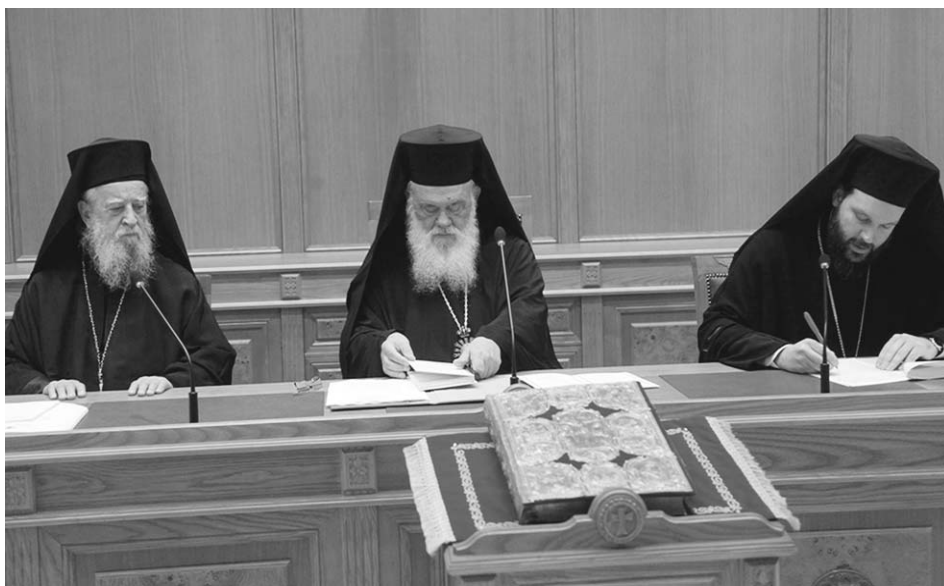
Ὁ Μακαριώτατος Ἀρχιεπίσκοπος Ἀθηνῶν καί πάσης Ἑλλάδος κ. Ἱερώνυμος κηρύσσει τήν ἐναρξή τῶν ἐργασιῶν τῆς Ἱεραρχίας τῆς Ἱεραρχίας (15.10.2013).

Ἡ σύγχρονη πραγματικότητα ἐπιτάσσει νά διατηρήσουμε πάνω ἀπ' ὅλα τήν ἐν Χριστῷ ἐνότητα, τόν σύνδεσμο τῆς εἰρήνης τοῦ Σώματος τῆς Ἱεραρχίας καί τοῦ ἐκκλησιαστικοῦ σώματος γενικότερα. Ἐπιτρέψτε μου ἐπ' αὐτοῦ νά προσθέσω κι ἕναν ἀκόμη προβληματισμό. Πολλοί ἐπιχειροῦν νά ταυτίσουν τήν Ἐκκλησία μέ μέρος τοῦ κοινωνικοῦ καί πολιτικοῦ συστήματος. Νά μᾶς παρουσιάσουν σάν συνδιαχειριστές κοσμικῆς ἐξουσίας. Δέν ὑπάρχει τίποτα πιό ἐπικίνδυνο ἀπό αὐτό. Ἡ Ἐκκλησία, παρ' ὅτι συνιστᾶ σάρκα ἀπό τή σάρκα τοῦ τόπου μας καί ἔχει συνδεθεῖ ἀδιαχώριστα μέ τήν ἱστορική του πορεία, οὔτε ταυτίζεται μέ κόμματα οὔτε ἀντλεῖ τήν ὑπαρξή της ἀπό τήν Πολιτεία. Ἐντάσσεται φυσιολογικά σέ ἕνα εὐνομούμενο κράτος, σεβομένη τούς νόμους πού διέπουν τό δημοκρατικό πολίτευμα. Κάθε ἄλλη προσέγγιση ὑπαγορεύεται ἀπό κοσμικά κριτήρια. Ὁ Ἰησοῦς Χριστός εἶναι γιά μᾶς «ἐχθές καί σήμερον ὁ αὐτός, καί εἰς τούς αἰῶνας» (Ἐβρ. 13, 8). Οὔτε συναποτελοῦμε μέρος τοῦ συστήματος, οὔτε ἀντιπροσωπεύουμε κάποιο συστημικό μόρφωμα. Ἡ Ἐκκλησία ἔχει πνευματική ἀποστολή νά ὀδηγῆ τά μέλη της πρὸς τή σωτηρία καί νά εὐαγγελίζεται «Χριστόν, καί τοῦτον ἐσταυρωμένον» (Α' Κορ. 2, 2). Ἀγαπᾶ, συγχωρεῖ,