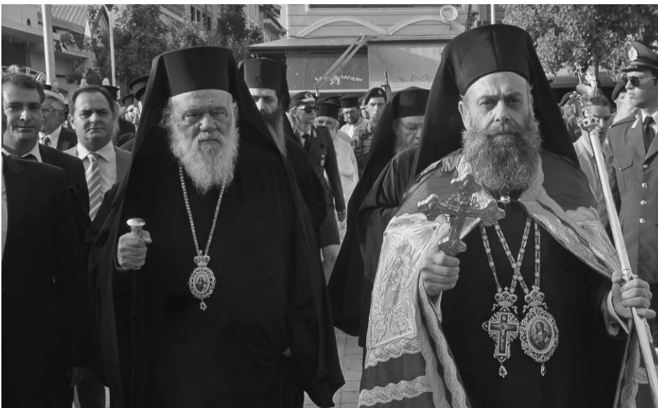
Ὁ Μακαριώτατος Ἀρχιεπίσκοπος Ἀθηνῶν καί πάσης Ἑλλάδος κ. Γερῶννος καί ὁ νέος Μητροπολίτης Θεσσαλιώτιδος καί Φαναριοφερσάλων Σεβ. κ. Τιμόθεος κατά τήν επίσημη ὑποδοχή στήν Καρδίτσα.

Ἡ φροντίδα γιά τούς ἀσθενεῖς καί ἀδυνάτους, θά λάβουμε μέριμνα ὥστε νά ἐνταθεῖ καί νά τούς ἐξασφαλίζει ἀνακούφιση καί αἰσιοδοξία. Ἡ βελτίωση τῶν ὑπηρεσιῶν τῶν παρεχομένων στό Ἐκκλησιαστικό Γηροκομεῖο, ἡ λειτουργία τῶν παιδικῶν κατασκηνώσεων, ἡ ἀποδοτικότερη λειτουργία τῆς Σχολῆς Βυζαντινῆς Μουσικῆς, τό φυτώριο