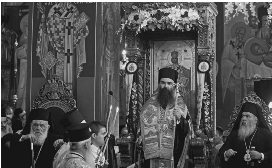
Στιγμιότυπο ἀπὸ τὴν Ἐνθρόνιση τοῦ Σεβ. Μητροπολίτου Ἐλασσῶνος κ. Χαρίτωνος μέ τὴν παρουσία τοῦ Μακαριωτάτου Ἀρχιεπισκόπου Ἀθηνῶν καὶ πάσης Ἑλλάδος κ. Ἱερωνύμου.

Εἶναι ὁ τόπος πού δέν ἔρχομαι γιὰ πρώτη φορά. Ἐπανερχομαι ὡς Ἐπίσκοπος καὶ Μητροπολίτης αὐτῆς τῆς Ἐπαρχίας, ἀφοῦ γιὰ δεκατέσσερα συναπτά ἔτη ὑπηρέτησα ὡς κληρικός αὐτῆς. «Γινώσκω τὰ ἐμὰ καὶ γινώσκομαι ὑπὸ τῶν ἐμῶν» (Ἰωάν.10,14). Κατὰ τὴν ἱερατικὴ διακονία μου στὴν Ἱερὰ Μητρόπολη Ἐλασσῶνος μοῦ δόθηκε ἡ εὐκαιρία νὰ ζήσω ἀπὸ κοντὰ καὶ νὰ ἀγαπήσω τὸν φιλόθεο, φιλόξενο καὶ ἀρχοντικὸ λαὸ τούτου τοῦ τόπου. Ὅλα αὐτὰ τὰ χρόνια ἔγινα κοινωνὸς τῆς ἐκτιμήσεως καὶ τῆς ἀγάπης των. Θὰ τοὺς ἀνταποδίδω αὐτὴν τὴν ἀγάπη καὶ θὰ παραμείνω γι' αὐτοὺς πατέρας, ἀδελφός, φίλος καὶ συμπαραστάτης στοὺς πνευματικὸς ἀγῶνες ἀλλὰ καὶ στίς προκλήσεις τῶν καιρῶν. Ἡ θύρα τῆς καρδιάς μου ἀλλὰ καὶ τῆς Μητροπόλεως θὰ εἶναι πάντοτε ἀνοικτὴς πρὸς ὅλους. Γνωρίζω ἀπὸ τὴν ἐμπειρία μου κοντὰ στὸν Μακαριστὸ Βασίλειο ὅτι τὸ ἔργο καὶ ἡ εὐθύνη τοῦ ἐπισκόπου δέν εἶναι εὐκόλη ὑπόθεση. Ὅσο καὶ ἂν τὸ ἀξίωμα ἐξωτερικὰ φαίνεται νὰ κατέχει περίζηλον θέσιν, στὴν πραγματικότητα εἶναι πορεία μέ ἐμπόδια, δοκιμασίες καὶ προβλήματα δύσκολα καὶ σύνθετα. Δανεῖζομαι ὁμως καὶ παρη-