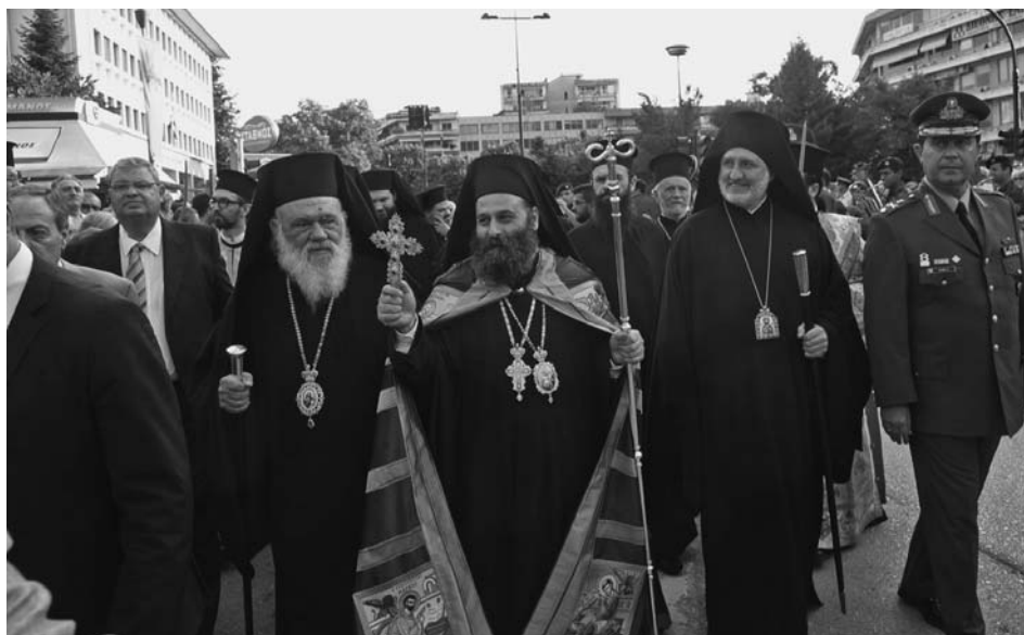
Ὁ Μακαριώτατος Ἀρχιεπίσκοπος Ἀθηνῶν καὶ πάσης Ἑλλάδος κ. Ἱερώνυμος, ὁ νέος Μητροπολίτης Ἰωαννίνων Σεβ. κ. Μάξιμος καὶ ὁ Μητροπολίτης Προύσσης κ. Ἐλπιδοφόρος τοῦ Οἰκουμενικοῦ Πατριαρχείου προσέρχονται στὴν τελετὴ τῆς Ἐνθρονίσεως.

«Καθάπερ γὰρ τό σῶμα ἓν ἐστὶ καὶ μέλη ἔχει πολλά, πάντα δὲ τὰ μέλη τοῦ σώματος τοῦ ἑνός, πολλά ὄντα, ἓν ἐστὶ σῶμα, οὕτω καὶ ὁ Χριστός· καὶ γὰρ ἐν ἐνὶ Πνεύματι ἡμεῖς πάντες εἰς ἓν σῶμα