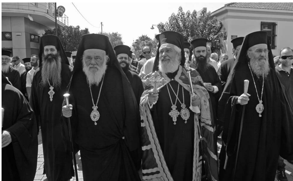
Ό Μακαριώτατος Άρχιεπίσκοπος Άθηνών και πάσης Ελλάδος κ. Γερώνυμος, ό Τοποτηρητής Σεβ. Μητροπολίτης Ναυπάκτου κ. Γερόθεος και ό νέος Μητροπολίτης Φωκίδος κ. Θεόκτιστος κατά τήν επίσημη ύποδοχή στήν Άμφισσα.

έξαθλίωσης, ή άρπαγή τής γης και τών πατρικών σπιτιών μας, πού άδιατάρακτα κληρονομούνται από τους γονείς και τους παππούδες μας, δηλαδή λαμβάναμε τήν πατρική μας γη ως δωρεά, προκειμένου να έχουμε άνάμνηση του παρελθόντος και να πορευόμαστε μέ σιγουριά στό μέλλον. Σήμερα, λοιπόν, έχουμε τή βεβαιότητα ότι αυτή ή άρπαγή και ή έξαθλίωση δέν είναι άποτέλεσμα καμιάς οικονομικής κρίσης, όπως άλλωστε ή ιστορία άποδεικνύει, ότι πάρα πολλές φορές οι άνθρωποι βρέθηκαν σέ άνάλογες περιπτώσεις, αλλά είναι άποτέλεσμα μίας βλάσφημης κατανόησης του ανθρώπου και τής κτίσης, απ' αυτόν τόν ίδιο τόν άνθρωπο. Δηλαδή, του μέν πρώτου ως καταναλωτή και άπλου θηλαστικού, πού έχει μόνο θεραπείσιμα ένστικτα, αλλά και τής δημιουργίας, τής κτίσης όλόκληρης, ως χρηστικού περιβάλλοντος έγκαταβίωσης του. Και έδω έδράζεται ό συνεχώς αυξανόμενος παραλογισμός μας. Άκόμα και από εμάς του ανθρώπου τής Έκκλησίας, πού έχουμε μείνει μετέωροι, γιατί άθετήσαμε τόν λόγον του αιώνιου Λόγου του Ουράνιου Πατέρα και τήν παρουσία του άγιου Πνεύματος. Δέν όμολογοϋμε πιά ότι δέν μπορούμε να ζήσουμε μόνο μέ τό ψωμί. Για να ζήσει ό κόσμος πρέπει να αναζητά τόν Ουράνιο Άρτο, τήν τροφή του παντός κόσμου. Οι μέν Λειτουργοί άστοχα, προβάλλουμε τήν Έκκλησία ως μία κοινωνική ύπηρεσία. Τά δε κάθε είδους κινήματα