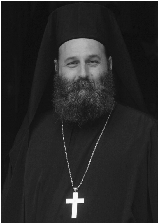
Ὁ Σεβασμιώτατος Μητροπολίτης Ἰωαννίνων κ. Μάξιμος (Παπαγιάννης) γεννήθηκε στό Λεβερ-

κοῦζεν τῆς Γερμανίας τό 1968 ἀπό γονεῖς Ἑλληνες μετανάστες. Τό 1988, μετά τήν ὀλοκλήρωση τῶν θεολογικῶν σπουδῶν του στήν Ἑλλάδα, ἐπέστρεψε στή Γερμανία ὅπου καί ὑπηρέτησε σέ νάο τῆς Στουτγκάρδης. Σπούδασε Θεολογία στό Καποδιστριακό Πανεπιστήμιο Ἀθηνῶν καί ἔχει μεταπτυχιακό τίτλο στήν Ἐκκλησιαστική Ἱστορία ἀπό τό Πανεπιστήμιο Marc Bloch τοῦ Στρασβούργου. Ἐπίσης ἔκανε μεταπτυχιακές σπουδές στή Σχολή Καθολικῆς Θεολογίας τοῦ Πανεπιστημίου Eberhard Karls στό Tübingen τῆς Γερμανίας καί εἶναι ὑποψήφιος διδάκτωρ στό ἴδιο Πανεπιστήμιο.