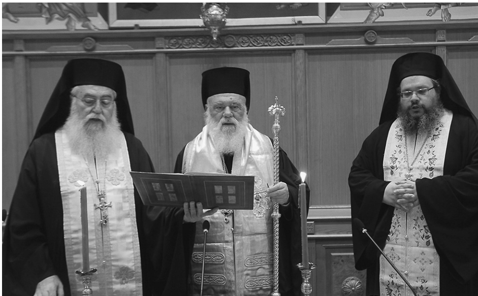
Ὁ Μακαριώτατος Ἀρχιεπίσκοπος Ἀθηνῶν καὶ πάσης Ἑλλάδος κ. Ἱερώνυμος τέλεσε τὸν Ἁγιασμό κατὰ τὴν Ἐναρξη τῆς Ἑκτάκτου Συγκλήσεως τῆς Ἱερᾶς Συνόδου τῆς Ἱεραρχίας

«Ἡ ἐκλογή νέων ἐπισκόπων εἶναι πολὺ σημαντικὴ στιγμή στὴ ζωὴ τῆς Ἐκκλησίας. Ἀποτελεῖ μίαν ἀπὸ τίς πιὸ βαρύνουσες Συνοδικὲς λειτουργίες καὶ ἐνέχει μείζονες εὐθύνες καὶ ἀπαιτήσεις.