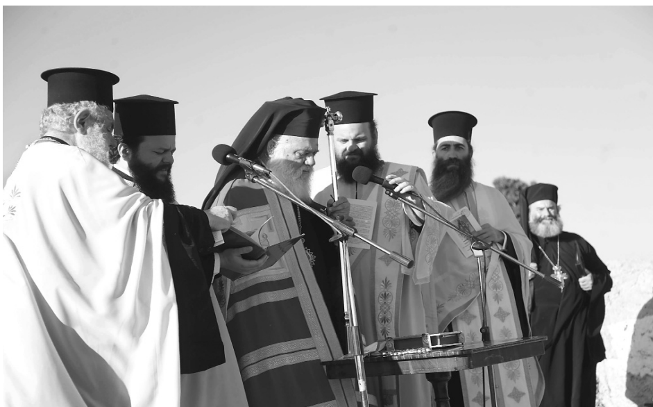
Ὁ Μακαριώτατος Ἀρχιεπίσκοπος Ἀθηνῶν και πάσης Ἑλλάδος κ. Ἰερώνυμος χοροστάτησε στόν Μεθέοργο Ἐσπερινό τῆς 29.6.2014 στόν Ἄρειο Πάγο

Ἀπ' ὅλες τίς ἀνθρώπινες λέξεις, ἀγάπη εἶναι ἡ ὠραιότερη λέξη. Καί αὐτό γιατί «ὁ Θεός ἀγάπη ἐστὶ» (Α' Ἰω. 4, 16). Ἡ Καινή Διαθήκη μᾶς δίδει τόν μεγάλο αὐτόν ὄρισμό. Ὁ Θεός εἶναι ἡ ἐνυπόστατος ἀγάπη, ἡ ἄπειρη ἀγάπη γιά τήν κτίση και ἰδιαίτερος γιά τό πλάσμα Του, τόν ἄνθρωπο. Εἶναι ὁ πλοῦτος τῆς χρηστότητος και μακροθυμίας (Ρωμ. 2, 4). Εἶναι «ὁ πατήρ τοῦ ἐλέους και τῶν οἰκτιρῶν» (Β' Κορ. 1,3). Στήν Παναγία Τριάδα κάτ' ἐξοχὴν ὑπάρχει ἡ τελεία κοινωνία τῆς ἀγάπης. Ἐκεῖ στήν περιχώρηση τῶν τριῶν προσώπων τῆς Ἁγίας Τριάδος ἔχουμε τό θεῖο μυστήριο τῆς ἀγάπης. Καί τό δεύτερο πρόσωπο τῆς Ἁγ. Τριάδος ὁ Κύριος ἐνδύεται τήν ἀνθρώπινη φύση και ἀνέρχεται ἐπὶ τοῦ Σταυροῦ διά νά ἀνακεφαλαιώσῃ ἐκεῖ τά πάντα καθ' ὅτι «οὕτως ἠγάπησεν ὁ Θεός τόν κό-