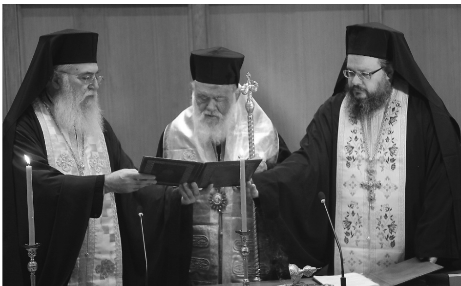
Ὁ Μακαριώτατος Ἀρχιεπίσκοπος Ἀθηνῶν καί πάσης Ἑλλάδος κ. Ἱερόννμος τελεῖ τόν Ἀγιασμό γιά τήν ἔναρξη τῶν ἐργασιῶν τῆς Ἱερᾶς Συνόδου τῆς Ἱεραρχίας.

Κατόπιν ἐγινε ἐνημέρωση τοῦ Σώματος τῆς Ἱεραρχίας γιά τά πεπραγμένα τῶν Συνοδικῶν Ἐπιτροπῶν τῆς παρελθούσης Συνοδικῆς Περιόδου