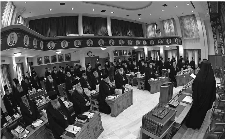
Στιγμιότυπο ἀπό τήν Τακτική Σύγκληση τής Ἱεράς Συνόδου τής Ἱεραρχίας.

Καταννοεῖ τήν ἀγωνία τῶν νέων ζευγαριῶν πού θέλουν νά τεκνοποιήσουν.