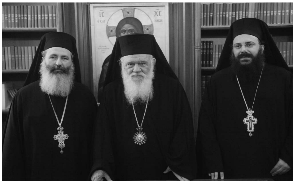
Ὁ Μακαριώτατος Ἀρχιεπίσκοπος Ἀθηνῶν καὶ πάσης Ἑλλάδος κ. Ἱερώνυμος μαζί μέ τοὺς νεοεκλεγέντες Μητροπολίτες Κεφαλληνίας κ. Δημήτριο καὶ Τρίκκης καὶ Σταγῶν κ. Χρυσόστομο.

Ἡ Ἱερά Σύνοδος τῆς Ἱεραρχίας ἀσχολήθηκε καὶ μέ τὴν ψήφιση Κανονισμῶν.