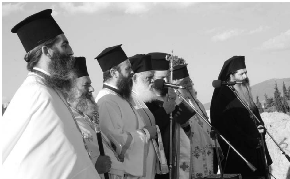
Ὁ Μακαριώτατος Ἀρχιεπίσκοπος Ἀθηνῶν καὶ πάσης Ἑλλάδος κ. Ἱερώνυμος χοροστάτησε στὸν Πανηγυρικό Ἑσπερινό στὸν βράχο τοῦ Ἀρείου Πάγου.

Ἡ ἀποκάλυψη τοῦ Θεοῦ στήν ζωὴ του δέν εἶναι ἓνα ἀτομοκεντρικό γεγονός μέ ἠθικοπλαστικό χα-