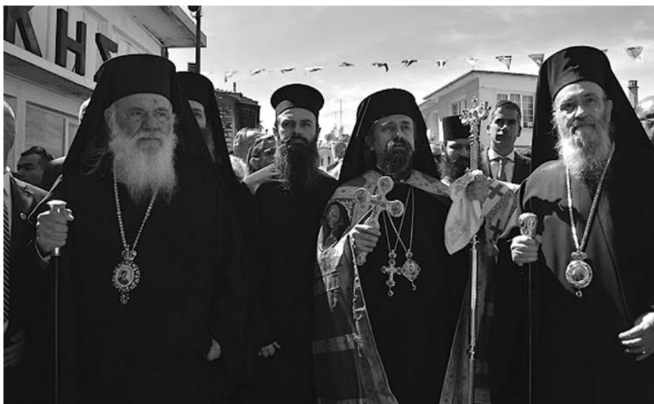
Ὁ Μακαριώτατος Ἀρχιεπίσκοπος Ἀθηνῶν και πάσης Ἑλλάδος κ. Γερῶννος, ὁ Σεβ. Μητροπολίτης Καρπενησίου κ. Γεώργιος και ὁ Τοποτηρητής Σεβ. Μητροπολίτης Ναυπάκτου κ. Γερόθεος ἔγιναν δεκτοί στό Καρπενήσι ἀπό τίς Τοπικές Ἀρχές και πλῆθος λαοῦ.

Εὐλογημένε λαέ τοῦ Θεοῦ, ζητῶ τίς προσευχές σου, ζητῶ νά ἀνεβοῦμε μαζί τόν Γολγοθᾶ γιά νά γίνουμε, στή συνέχεια, μέτοχοι τοῦ ἀνεσπέρου Φωτός και τῆς ἀνεκλαλήτου Χαρᾶς τῆς Ἀναστάσεως. Ἀμήν.