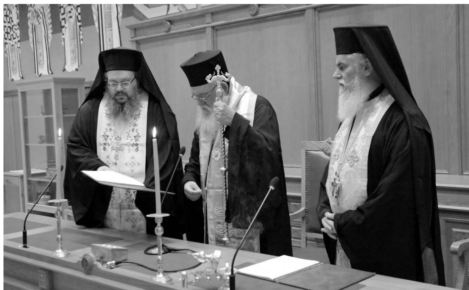
Ό Μακαριώτατος Άρχιεπίσκοπος Άθηνών και πάσης Ελλάδος κ. Γερώνυμος τελεί τόν άγιασμό κατά τήν έναρξη των εργασιών της Ι.Σ.Ι.

Η Έρα Σύνοδος της Έραρχίας, έξ άφορμής της Εισήγησης του Σεβασμιωτάτου Μητροπολίτου Διδυμοτείχου, Όρεστιάδος και Σουφλίου κ. Δαμασκηνού μέ θέμα: «Μύθοι και πραγματικό-