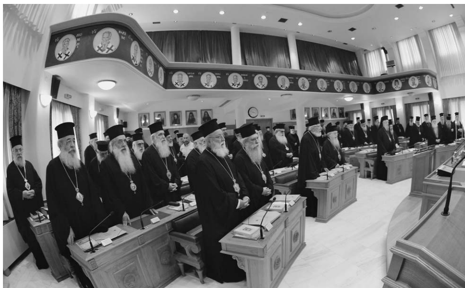
Στιγμιότυπο μέ τά μέλη τῆς Ἱεράς Συνόδου τῆς Ἱεραρχίας κατά τήν ἐναρξη τῶν ἐργασιῶν.

Μετά τήν προσευχή ἀνεγνώσθη ὁ Κατάλογος τῶν συμμετεχόντων Ἱεραρχῶν καί διαπιστώθηκε ἀπαρτία. Κατόπιν ἐπικυρώθηκαν τά Πρακτικά τῆς χθεσινῆς Συνεδρίας.