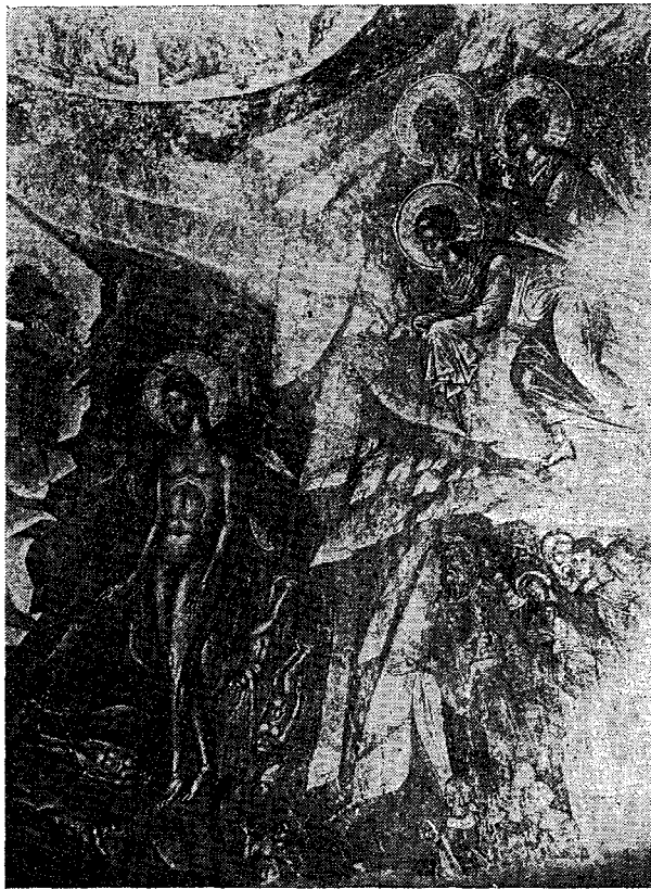
Ἡ ΒΑΠΤΙΣΙΣ ΤΟΥ ΧΡΙΣΤΟΥ

Καὶ ταῦτα μὲν εἶναι αἱ ἀπόψεις καὶ ἰδέαι τοῦ λαοῦ. Αἱ μᾶζαι δὲν σκέπτονται, ὡς ἐπὶ τὸ πολὺ παρασύρονται. Βλέπουν καὶ ἀκούουν τὰ θαυμάσια γεγονότα καὶ τοὺς λόγους, ἀλλὰ δὲν συγκινοῦνται. Τὸ σπουδαιότερον πρὸς ἐξέτασιν εἶναι πῶς σκέπτονται περὶ τοῦ Χριστοῦ οἱ ἀρχηγοὶ καὶ ὁδηγοὶ τοῦ λαοῦ;