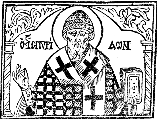
Ξυλογραφία ἐν τοῦ Μηναίου 1628 Ἐνετίσιν, παρὰ Ἀντωνίῳ τῷ Πινέλλῳ.

Κατὰ τὸ προσεχές ἔτος συμπληροῦνται 1600 ἔτη (348—1948) ἀπὸ τῆς μακαρίας τελευτῆς τοῦ ἐν Ἁγίοις Πατρὸς ἡμῶν Σπυρίδωνος, Ἐπισκόπου Τριμυθοῦντος, τοῦ θαυματουργοῦ, ἐνὸς τῶν δημοφιλεστέρων ἁγίων, ὅστις καὶ μετὰ πάροδον 16 αἰῶνων παραμένει ζῶν διδασκα βραθείας εὐσεβείας καὶ πλουσίας ἀρετῆς εἰς τὸ στερέωμα τῆς Ἐκκλησίας.