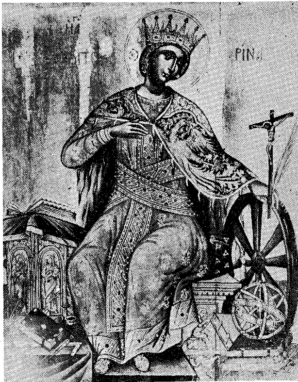
Ἡ ἁγία Αἰκατερίνη (Εἰκὼν μονῆς τοῦ Σινᾶ ἐς' αἰ.)