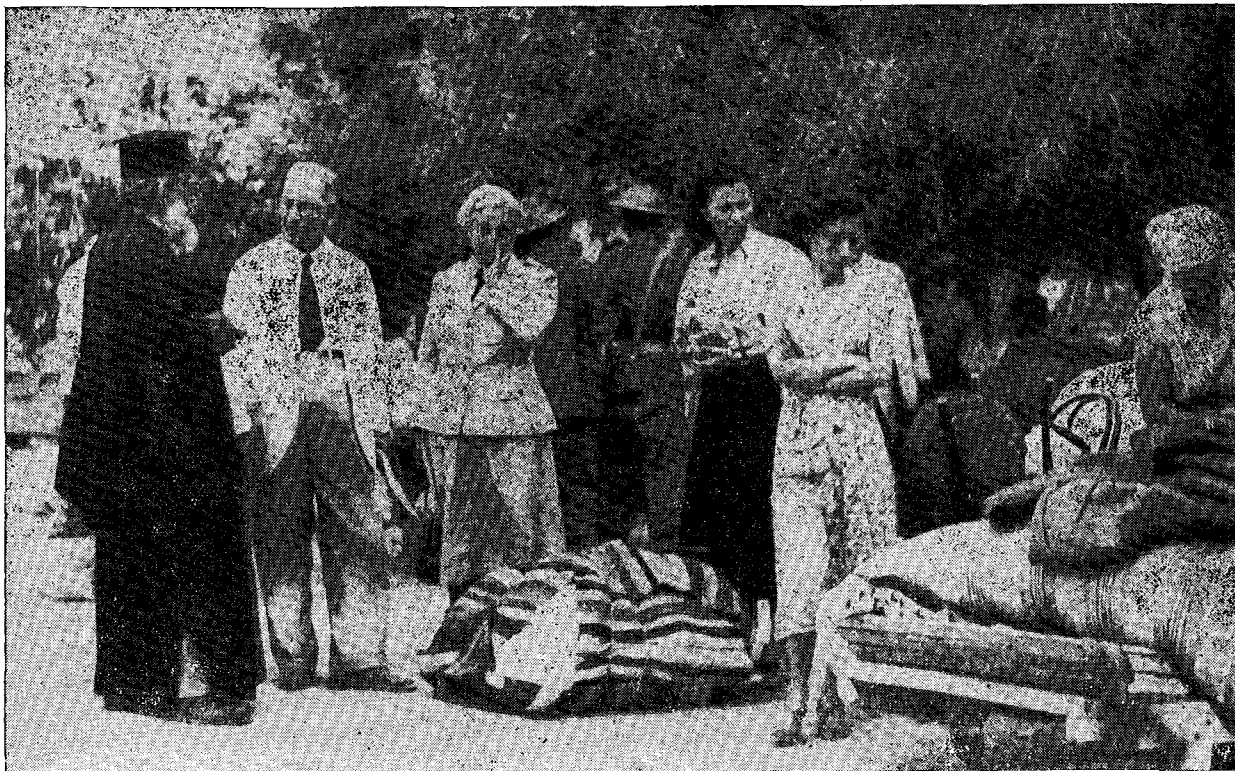
Ἀφηγήσεις τῶν σεισμοπαθῶν πρὸς τοὺς ἀντιπροσώπους τῶν Ἐκκλησιῶν καὶ τοῦ Ἐρυθροῦ Σταυροῦ.