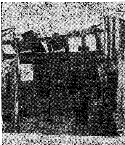
Ἡ ἐκκλησία τοῦ Ἁγίου Νικολάου εἰς Ληξοῦριον.