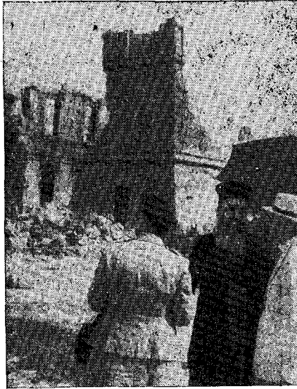
Ὅ,τι ἀπέμεινε ἀπὸ τοὺς περιφῆμους Ἁγ. Πάντας Ζακύνθου.