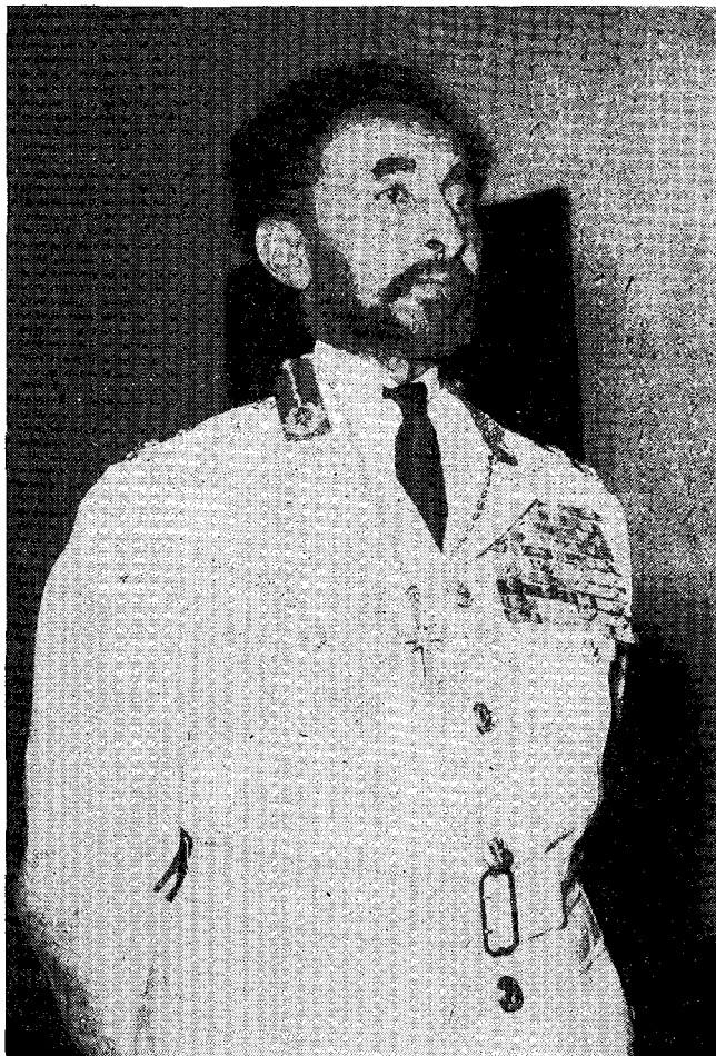
Ὁ Ἀυτοκράτωρ τῆς Αἰθιοπίας Χάιλε Σελάσιε Α' φέρων τὸν ὑπὸ τῆς Ἐκκλησίας τῆς Ἑλλάδος δωρηθέντα Αὐτῷ ἐπιστή- θιον Σταυρόν.

Τῇ δὲ 31ῃ τοῦ ἰδίου μηνὸς ὁ Μακαριώτα- τος Ἀρχιεπίσκοπος καὶ Πρόεδρος τῆς Ἱερᾶς Συνόδου, συνοδευόμε- νος ὑπὸ τῶν Συνοδικῶν Συνέδρων Σεβασμιωτά- των Μητροπολιτῶν Φλω- ρίνης κ. Βασιλείου, Φω- κίδος κ. Ἀθανασίου, Θεσσαλονίκης κ. Παν- τελεῆμονος, Καλαβρυ- των καὶ Αἰγιαλείας κ. Ἀγαθονίκου, Μεσ- σηνίας κ. Χρυσοστόμου καὶ Θεσσαλιώτιδος καὶ Φαναριοφερσάλων κ. Ἰε- ζεκίηλ, τοῦ Σεβασμιωτάτου Μητροπολίτου Ἀξώ-