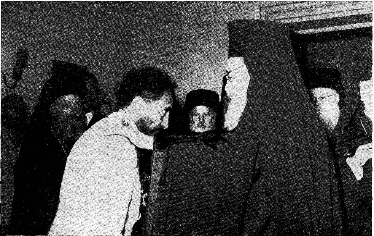
Ὁ Αὐτοκράτωρ τῆς Αἰθιοπίας εὐχαριστῶν τὸν Μακαριώτατον Ἀρχιεπίσκοπον μετὰ τὴν ὑπ' αὐτοῦ ἐπίδοσιν τοῦ ὑπὸ τῆς Ἐκκλησίας τῆς Ἑλλάδος δωρηθέντος τῇ Α. Μ. Μ. Σταυροῦ.