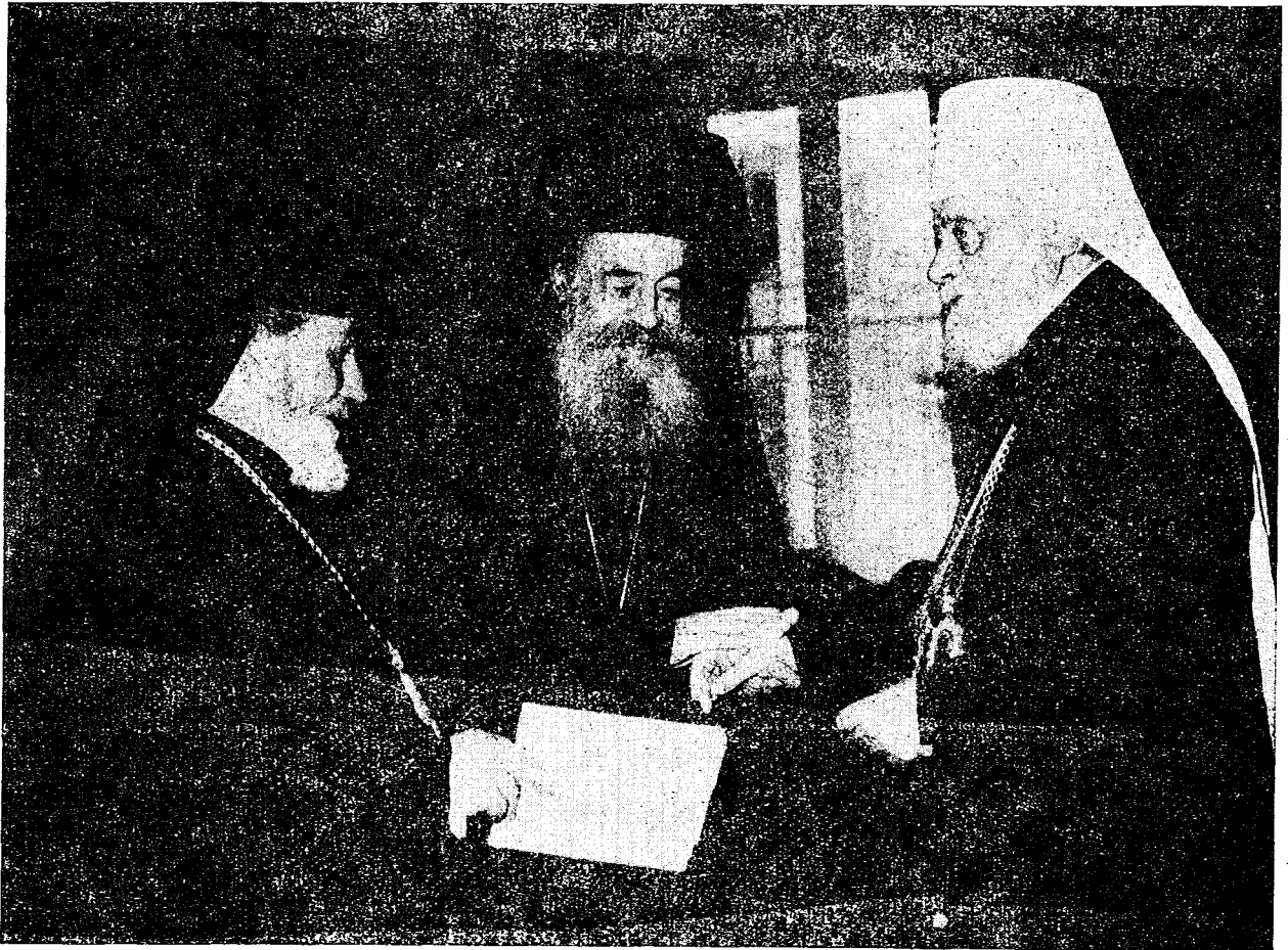
Ὁ Μακ. Ἀρχιεπίσκοπος Ἀθηνῶν καὶ Πάσης Ἑλλάδος κ. Σπυρίδων προπέμπων τὴν Α. Μακαριότητα τὸν Πατριάρχην τῶν Σέρβων κ. Βικέντιον.

Ἀναχωρήσαντες τὴν ἐπομένην ἐκ Κερκύρας, συμφώνως τῶ ἐπισήμῳ προγράμματι, ἀπεβιβάσθησαν μετὰ διήμερον εἰς Δάφνην, ἐπίνειον τοῦ Ἁγ. Ὄρους, ἔνθα ὑπεδέχθησαν αὐτοὺς ὁ Διοικητὴς τοῦ Ἁγίου Ὄρους κ. Κωνσταντόπουλος καὶ οἱ ἀντιπρόσωποι τῶν Μονῶν. Καθ' ὁδόν, ἡ βροχὴ ἠνάγκασε τοὺς προσκυνητὰς ν' ἀνακόψωσι τὴν πορείαν καὶ νὰ ζητήσωσι καταφύγιον εἰς τὴν Ἱ. Μονὴν τοῦ Ξηροποτάμου, ἔνθα μετὰ τὴν προσκύνησιν τῶν ἱερῶν λειψάνων ἀνεπαύθησαν ἐπ' ὀλίγον. Ἐκεῖθεν, μετὰ τὴν κατάπαυσιν τῆς βροχῆς, ἐπιβάντες