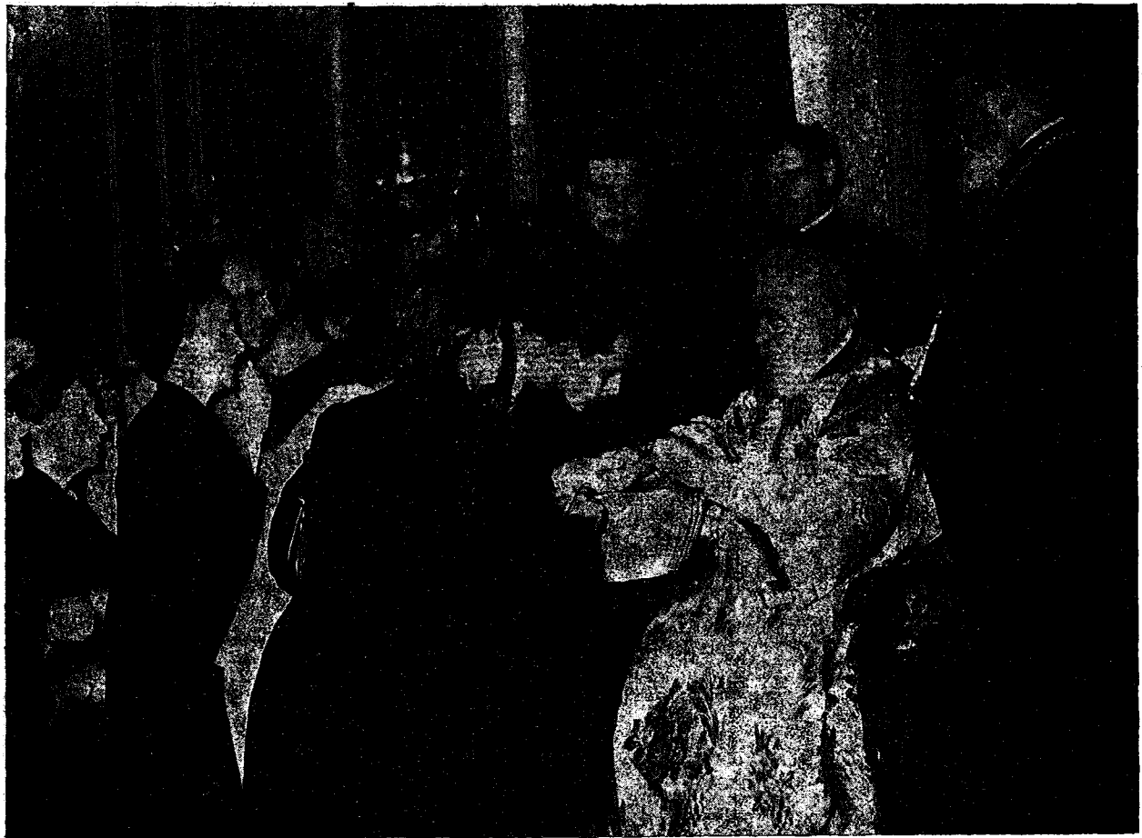
Ὁ Μακ. Πατριάρχης μετὰ τὴν ἐν τῷ Καθεδρ. Ναῷ τῶν Ἀθηνῶν θείαν Λειτουργίαν, διανέμων τὸ Ἀντίδωρον εἰς τὰς χιλιάδας τῶν ἐκκλησιασθέντων.

Ὑπὸ τὴν ἐννοίαν ταύτην ἢ ἰσχὺς τῆς Ὀρθοδόξου Ἐκκλησίας, οὐσης θείου καθιδρύματος ἐπὶ τῆς γῆς, εἶναι μεγάλη καὶ ἀκατανίκητος, οὐχὶ κυρίως ὡς διοικητικῆς ὁργανώσεως, ἀλλ' ὡς πνευματικῆς καὶ ἡθι-