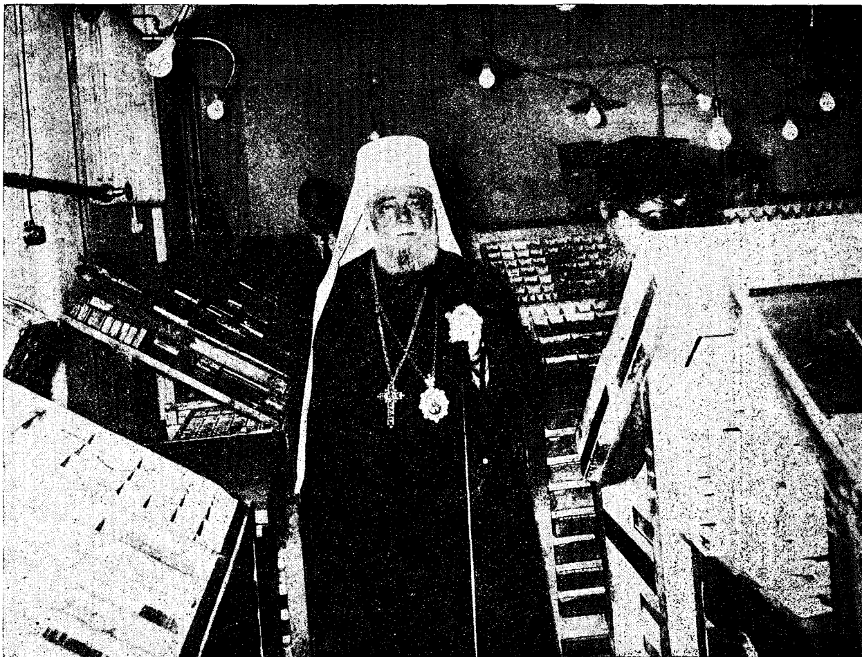
Ὁ Μακ. Πατριάρχης εἰς τὸ Ἐκκλ. Τυπογραφεῖον τῆς Ἀποστολικῆς Διακονίας.

Ἀκολούθως ἡ Α. Μακαριότης ἐπεσκέφθη τὰς ἐγκαταστάσεις τοῦ Θεολογικοῦ Οἰκοτροφείου καὶ τοῦ Ἐκκλησιαστικοῦ Τυπογραφείου, καθὼς καὶ τὴν ἐκθεσιν τῆς Ὁρησκευτικῆς Διαφώτισεως καὶ Τύπου, ἔνθα περιειργάσθη μετ' ἐνδιαφέροντος τὰ διάφορα ἐκθέματα, καὶ ἐζήτησε καὶ ἔλαβε διαφόρους σχετικὰς πληροφορίας. Μεθ' ὃ παρεκάθησαν ἅπαντες εἰς τὴν κοινὴν τράπεζαν τοῦ Θεολογ. Οἰκοτροφείου, ἔχοντες ἐν τῷ μέσῳ τοὺς δύο Πρωθυεράρχας.