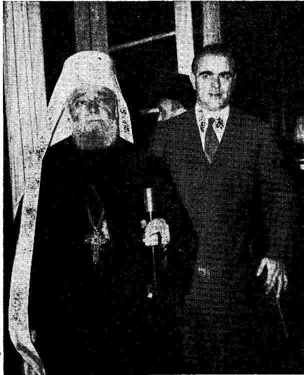
Ὁ Μακ. Πατριάρχης μετὰ τοῦ Πρωθυπουργοῦ κ. Καραμανλῆ κατὰ τὴν πρὸς αὐτὸν ἐπίσκεψίν Του.

αἰσθάνεται δυσκολίαν νὰ ἐκφράσῃ τὰ πλημμυροῦν- τα αὐτὸν αἰσθήματα εὐ- ρισκόμενος εἰς τὴν περι- πυστον πόλιν τῶν Ἀθη- νῶν, τὴν κοιτίδα τοῦ πο- λιτισμοῦ καὶ τὴν πόλιν, ὅθεν ἐξώρμησεν ὁ Ἀπό- στολος τῶν Ἑθνῶν Παῦ- λος πρὸς κατάκτησιν τῆς Εὐρώπης. «Ἐπισκεπτό- μενοι, εἶπε, τὴν πρεσβυ- τέραν ἀδελφὴν Ἐκκλησί- αν, τὴν Ἑλληνικὴν Ἐκ- κλησίαν, αἰσθανόμεθα ἐ- αυτοὺς ὡς ἀδελφούς». Πε- ραιτέρω ἐτόνισε τὸν ρό- λον τῆς Ἐκκλησίας, καὶ δὴ τῆς Ὀρθοδόξου Ἐκ- κλησίας, διὰ τοὺς λαοὺς, καὶ μάλιστα τοὺς Βαλκα- νικοὺς λαοὺς, δι' οὓς ἡ Ὀρθόδοξος Ἐκκλησία ὑπῆρξε πάντοτε πιστὴ παραστάτις, καὶ θεματο- φύλαξ τῶν ἐθνικῶν καὶ ἠθικῶν κεφαλαίων ἐκά- στου ἐξ αὐτῶν. Καταλή- γων δέ, ἠὺχαρίστησε καὶ πάλιν διὰ τὴν θερμὴν ὑποδοχὴν ἣτις ἐπεφυ-