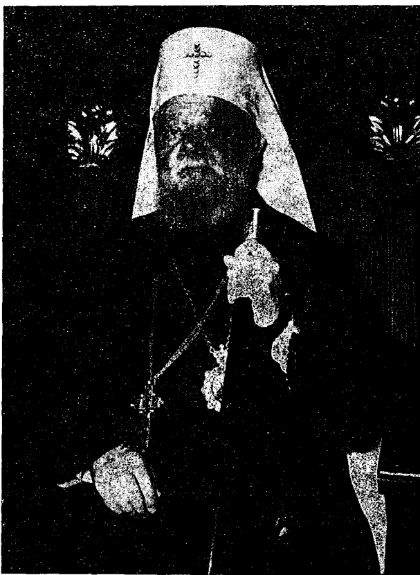
Ὁ Μακ. Ἀρχιεπίσκοπος Ἰπεκίου, Μητροπολίτης Βελιγραδίου καὶ Καρλοβικίου καὶ Πατριάρχης τῶν Σέρβων κ. Βικέντιος.

μὲν πλευρᾶς ὁ Μακαρι-ώτατος Ἀρχιεπίσκοπος Ἀθηνῶν καὶ πάσης Ἑλ-λάδος κ. Σπυρίδων, περι-στοιχούμενος ὑπὸ τῶν Σε-βασμιωτάτων Συνδικῶν Συνέδρων, τῶν Θεοφιλε-στάτων Βοηθῶν Ἐπισκό-πων, τοῦ παρὰ τῇ Ἱεραῇ Συνόδῳ Βασιλικῷ Ἐπι-τρόπου, τοῦ Ἀρχιεπισκο-πάρχου τῆς Ἱεραῆς Συνό-δου, τοῦ Πρωθιερέως τῶν Ἀνακτόρων καὶ τοῦ Ἀν-τιπροέδρου τοῦ «Ἱεροῦ Συνδέσμου» τῶν Κληρι-κῶν τῆς Ἀρχιεπισκοπῆς καὶ ὁ Ὑπουργὸς Ὀρη-σκευμάτων καὶ Ἐθν. Παι-δείας κ. Ἀχιλ. Γεροκω-στόπουλος μετὰ τοῦ Γεν. Διευθυντοῦ τοῦ Ὑπουρ-γείου Ἐξωτερικῶν, τοῦ Γεν. Γραμματέως τοῦ Ὑπουργείου Ὀρησκευμά-των, τοῦ Γεν. Διευθυν-τοῦ Ὀρησκευμάτων τοῦ Ὑπουργείου Ὀρησκευμά-των καὶ Ἐθνικῆς Παι-δείας, τοῦ Πρυτάνεως τοῦ Πανεπιστημίου Ἀθηνῶν, τοῦ Κοσμητοροῦ τῆς Θεο-λογικῆς Σχολῆς τοῦ Πα-νεπιστηρίου, τοῦ Διευθυν-