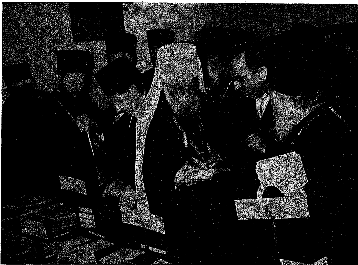
Ὁ Μακ. Πατριάρχης εἰς τὴν ἐκθεσὶν Ὁρθοκ. Διαφωτίσεως καὶ Τύπου τῆς Ἀποστολ. Διακονίας, περιεργαζόμενος τὴν τελευταίαν ἐκδοσὶν τῆς Καινῆς Διαθήκης.

Ἄλλὰ εἰς ἐκ τῶν καρπῶν τούτων, ὁ πολυτιμότερος ἴσως καὶ ὁ μᾶλλον ἐλπιδοφόρος, εὐρίσκεται ἤδη, κατὰ τὴν στιγμὴν ταύτην, ἐνώπιον ἡμῶν εἰς τὴν αἴθουσαν ταύτην. Εἶναι ὁ δίδυμος θησαυρὸς τῆς θεολογούσης Νεότητος, οἱ ὀργανωμένοι ὑπὸ τὴν αἰγίδα τῆς Ἀποστολικῆς Διακονίας παλαιοὶ καὶ σημερινοὶ τρόφιμοι τοῦ Θεολογικοῦ τῆς Οἰκοτροφείου καὶ ὁ «Σύνδεσμος τῶν Ἑλληνίδων Θεολόγων». Καὶ εἶμαι λίαν εὐτυχῆς, Μακαριώτατε, διότι εὐρίσκομαι