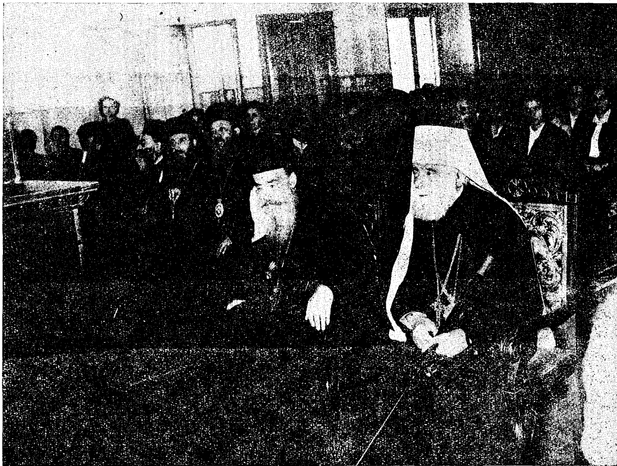
Κατὰ τὴν ἐν τῇ Ἀποστολικῇ Διακονίᾳ δεξιῶσιν, καθ' ἣν στιγμήν ὁμιλεῖ ὁ Ἀναπληρωτὴς τοῦ Γεν. Διευθυντοῦ.

Ἡ Ἀποστολικὴ Διακονία τῆς Ἐκκλησίας τῆς Ἑλλάδος, ἰδρυθεῖσα ἀπὸ τοῦ 1936, Πρωθιεραρχοῦντος τοῦ ἀοιδίμου Ἀρχιεπισκόπου Χρυσόστομου Παπαδοπούλου, ἀναδιοργανώθη μετὰ τὸν δεύτερον παγκόσμιον πόλεμον καὶ πρὶν ἀκόμη λήξωσιν αἱ ἐξ αὐτοῦ καὶ τῶν ἐπακολούθων τούτου ταλαιπωρίαι τῆς πολυπαθοῦς ταύτης χώρας, τῷ 1946, ἐπὶ νέων βάσεων, ἀνταποκρινομένων πρὸς τὰς ἐν τῷ μεταξὺ προκινῶσας νεωτέρας ἀνάγκας τοῦ ἐκκλησιαστικοῦ ἔργου, Πρωθιεραρχοῦντος τοῦ ἀειμνήστου Ἀρχιεπισκόπου Δαμασκηνοῦ. Ἐτυχε δὲ τῆς πλήρους στοργῆς σθεναρᾶς προστασίας τοῦ διαδεχθέντος ἐκεῖνον Μακαριωτάτου Ἀρχιεπισκόπου ἡμῶν Κυρίου Σπυρίδωνος, τοῦ Προκαθημένου σήμερον τῆς Ἀγιωτάτης Ἐκκλησίας τῆς Ἑλλάδος, ἵνα δυνηθῇ ν' ἀνακτήσῃ τὸ ἐπιτεταγμένον μέχρι τότε μέγαρον τοῦτο, καὶ νὰ στεγάσῃ ἐν αὐτῷ τὸ Θεολογικὸν Οἰκοτροφεῖον, τὰ γραφεῖα καὶ τὰς τυπογραφικὰς ἐγκαταστάσεις αὐτῆς. Καὶ ἔχει σήμερον τὸ μέγαρον προνόμιον ν' ἀπολαύῃ τῆς ἀόκνου καὶ ἀγρόπνου ἐν παντὶ παρακολου-