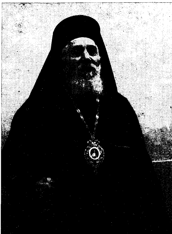
Ὁ προεδρεύσας τῆς Σ. Ἱεραρχίας κατὰ τὴν ἐκλογὴν Τοποτηρητῆς, Σεβ. Μητροπολίτης Βερροίας καὶ Ναούσης κ. Ἀλέξανδρος.

Συμφώνως τῷ ἐπισημῷ τούτῳ προγράμματι, αὐτοκίνητος τῆς Αὐλῆς (Στέμμα κυανοῦν) μετὰ Οἰκοθεράποντος ἀνέμενε τὸν Μακ. Ἀρχιεπίσκοπον ἀπὸ τῆς 12.40' μ. μ., πρὸ τοῦ Ἀρχιεπισκοπικοῦ Μεγάρου, τῇ δὲ 12.50' μ. μ. ἡ Α. Μακαριότης, περιβεβλημένη τὸν ἀρχιερατικὸν μανδύαν, ἐπέβη τούτου καὶ κατηυθύνθη εἰς τὰ Βασιλικὰ Ἀνάκτορα, συνοδευομένη ὑπὸ τοῦ Σεβ. Τοποτηρητοῦ καὶ τῶν λοιπῶν Σεβ. Συνοδικῶν Ἀρχιερέων, τοῦ Ὑπουργοῦ Ὁρησκευμάτων καὶ Ἑθν. Παιδείας κ. Π. Λεβαντῆ, τοῦ παρὰ τῷ αὐτῷ Ὑπουργεῖῳ Γεν. Διευθυντοῦ Ὁρησκευμάτων Καθηγητοῦ τοῦ Πανεπιστημίου Ἀθηνῶν κ. Κ. Μπόνῃ, τοῦ παρὰ τῇ Ἱερᾷ Συνόδῳ Βασιλικῷ Ἐπιτρόπου Καθηγητοῦ τοῦ αὐτοῦ Πανεπιστημίου κ. Γ. Καρμίρη καὶ τοῦ Ἀρχιγραμματέως τῆς Ἱεράς Συνόδου Πανοσιολ. Ἀρχιμανδρίτου κ. Χρυσοστόμου Θέμελη, ἐπιβαινόντων ἰδίων αὐτοκινήτων. Τῇ 12.55' μ. μ., ἀφικόμενος εἰς τὰ Ἀνάκτορα τοῦ Μακ. Ἀρχιεπισκόπου μετὰ τῶν συνοδευόντων αὐτόν, ἀπένευμε τὰς νενομισμένας τιμὰς ἡ ἐν τῷ προαυλίῳ τῶν Ἀνακτόρων, φροντίδι τοῦ Ἀρχηγοῦ τοῦ Στρατιωτικοῦ Οἴκου, καθ' ὑψηλὴν ἐπιταγὴν, παρατεταγμένη Βασιλικὴ φρουρά, μεθ' ὃ ἀδηγήθησαν ἅπαντες ὑπὸ τοῦ ἐκτάκτου Τελετάρχου κ. Γ. Ἰατρίδου εἰς τὴν μεγάλην αἰθούσαν τῶν τελετῶν, ἐνθα κατέλαβον τὰς δι' αὐτοὺς προκαθορισμένας θέσεις. Ἡ Α. Μακαριότης ἔλαβε θέσιν ἔμπροσθεν τῆς Ὁραίας Πύλης τοῦ ἐν τῇ αἰθούσῃ Βασιλικῷ Παρεκκλησίου, πρὸ τῆς προηυτρεπισμένης τραπέζης, ἐφ' ἧς τὸ Ἱερὸν Εὐαγγέλιον καὶ ὁ Τίμιος Σταυρός.