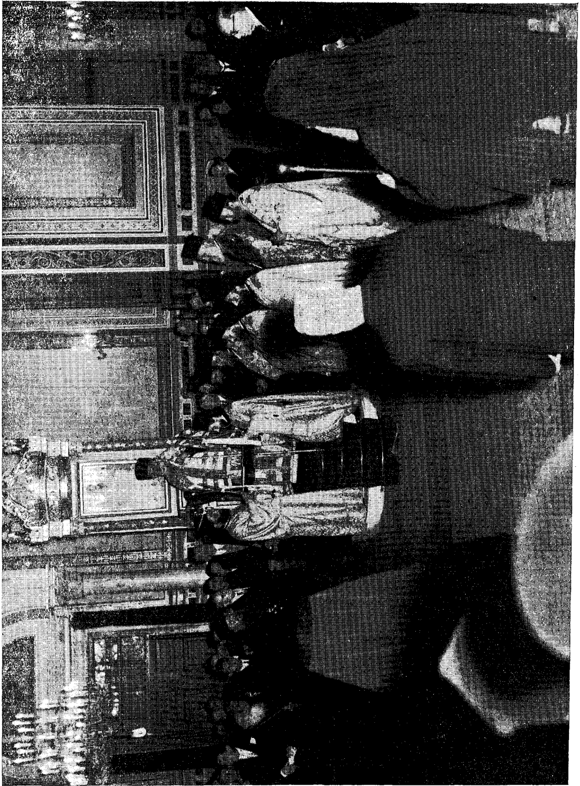
‘Ο Μον. ‘Αρχιεπίσκοπος ‘Αθηνών και πάσης ‘Ελλάδος Κύριος Διορόβιος κατά την τελετήν τῆς ἐνθρονίσεως.