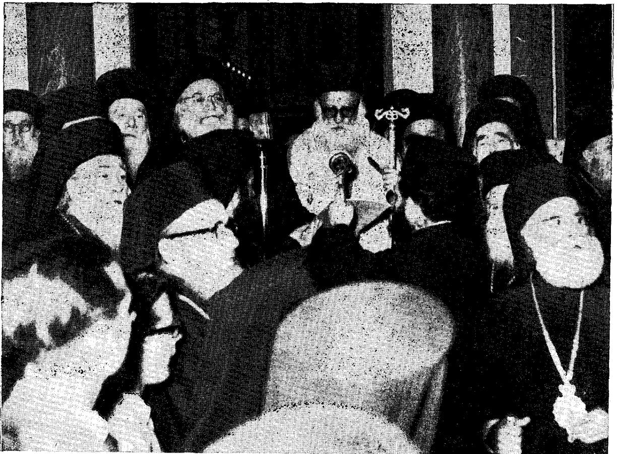
Ὁ νέος Ἀρχιεπίσκοπος Ἀθηνῶν καὶ πάσης Ἑλλάδος Μακαριώτατος κ. Δωρόθεος, τελῶν τὸ Μέγα Μήνυμα, εὐθὺς μετὰ τὴν ἐκλογὴν.

« Δόξα Σοὶ ὁ Θεὸς, ἡ ἐλπίς ἡμῶν, δόξα Σοὶ. Χριστὸς ὁ ἀληθινὸς Θεὸς ἡμῶν, ταῖς πρεσβείαις τῆς Παναχράντου καὶ Παναμώμου Ἁγίας Αὐτοῦ Μητρὸς, τῶν ἁγίων ἐνδόξων καὶ Πανευφήμων Ἀποστόλων