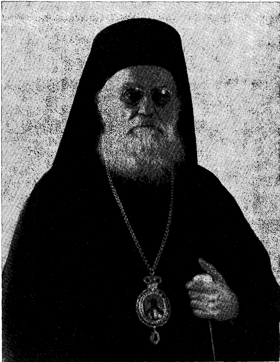
Ο ΜΑΚΑΡΙΩΤΑΤΟΣ ΑΡΧΙΕΠΙΣΚΟΠΟΣ ΑΘΗΝΩΝ ΚΑΙ ΠΑΣΗΣ ΕΛΛΑΔΟΣ ΚΥΡΙΟΣ ΔΩΡΟΘΕΟΣ