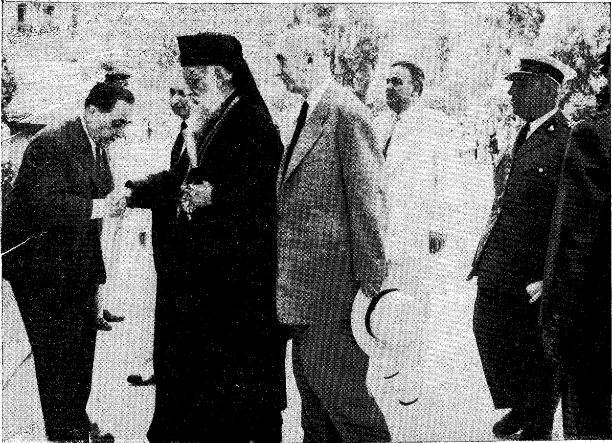
'Απὸ τὸν ἁγιασμὸν τῆς θεμελιώσεως τοῦ ἱ. Ναοῦ τῆς ἁγίας Τριάδος Πειραιῶς.

Καί, πρῶτον, ἄπτομαι τοῦ γεωγραφικοῦ προσδιορισμοῦ τοῦ Σχίσματος. Στοιχοῦντες τῇ συνηθείᾳ τῶν δυτικῶν συγγραφέων, ὀνομάζετε ἐν τῇ ἐπιστολῇ 'Υμῶν τὸ Σχίσμα «'Ανατολικόν». Καὶ ἡμεῖς, ὡς γνωρίζετε, καθορίζοντες γεωγραφικῶς τὸ Σχίσμα, θεωροῦμεν