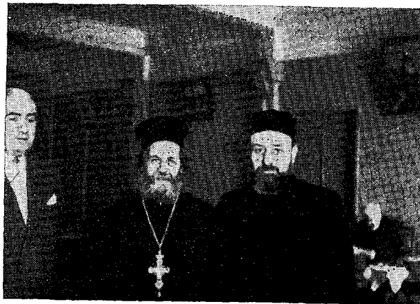
Ὁ Παναγιώτατος Καθολικὸς Πατριάρχης τοῦ Ἐτσηματζίν Vasken Balgian (δεξιᾶ), καὶ ὁ Μ. Πρωτ. Κ. Μωραϊτάκης.

Ὅπως ἡ ἡμετέρα Ὀρθόδοξος Ἀνατολικὴ Ἐκκλησία οὕτω καὶ ἡ Ἀρμενικὴ ἔχει τέσσαρας Πατριαρχικούς θρόνους: 1) Τοῦ Ἐτσηματζίν, 2) Τῆς Κιλικίας, 3) Τῆς Κωνσταντινουπόλεως καὶ 4) τῶν Ἱεροσολύμων. Οἱ δύο πρῶτοι ὀνομαζόμενοι «Καθολικοί», τιλοφοροῦνται διὰ τοῦ «ἡ Α. Παναγιότης», «ἡ Α. Μεγαλειότης» καὶ φέρουσι τοὺς δακτυλίους των εἰς τὸν παράμεσον δάκτυλον, ἐν ᾧ οἱ δύο ἕτεροι Πα-