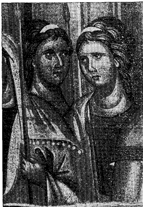
Νεάνιδες. Τμήμα, ἐκ τῶν Εἰσοδίων τῆς Θεοτόκου.

(Ἐκ τοιχογραφίας τοῦ διασήμου Πανσελήνου)