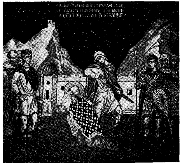
Μαρτύριον ἁγίου Χαραλάμπους. Τοιχογραφία ἰ. ναοῦ ἁγίου Χαραλάμπους Πολυγώνου. Διὰ χειρὸς Φ. Κ.

† Ὁ ἅγιος ἱερομάρτυς Χαραλάμης. Γέρον φαλακρὸς, μακρυγένειος καὶ ὀξυγένειος, φέρων ἱερατικὴν στολὴν, ἤτοι φελόνιον καὶ ἐπιτραχή-