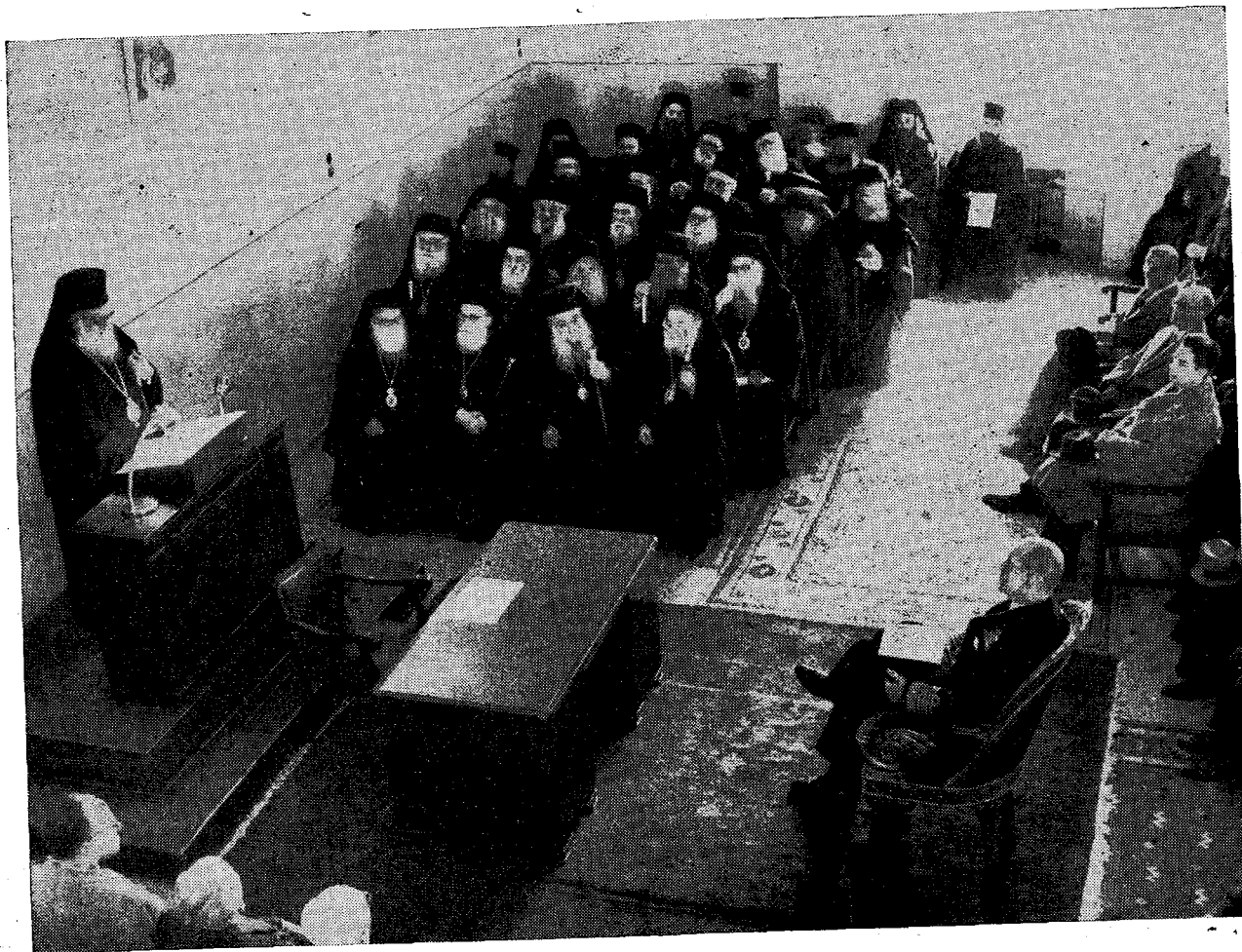
Ὁ Μακαριώτατος Ἀρχιεπίσκοπος ἐκφωνῶν τὸν εἰσαγωγικὸν αὐτοῦ λόγον εἰς τὸ Α' Συνέδριον τῶν Ἱεροκλήρυκων.

Ἀπόδειξις τούτου ὁ Ἅγιος προφήτης Ἱερεμίας ὁ ὁποῖος λέγει: «Καὶ εἶπα: οὐ μὴ ὀνομάσω τὸ ὄνομα Κυρίου, οὐ μὴ λαλήσω ἐπὶ τῷ ὀνόματι αὐτοῦ· καὶ ἐγένετο ὡς πῦρ καιόμενον φλέγον ἐν τοῖς ὀστέοις μου καὶ παρεῖμαι πάντοθεν καὶ οὐ δύναμαι φέρειν» ('Ιερεμίας κ', 9). Ὁ δὲ πομμέγιστος Ἀπ. Παῦ-