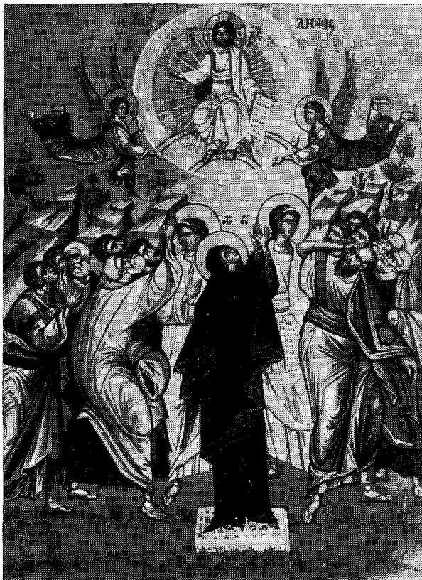
Φορητὴ εἰκὼν τῆς Ἀναλήψεως (Χεῖρ Φ.Κ.)