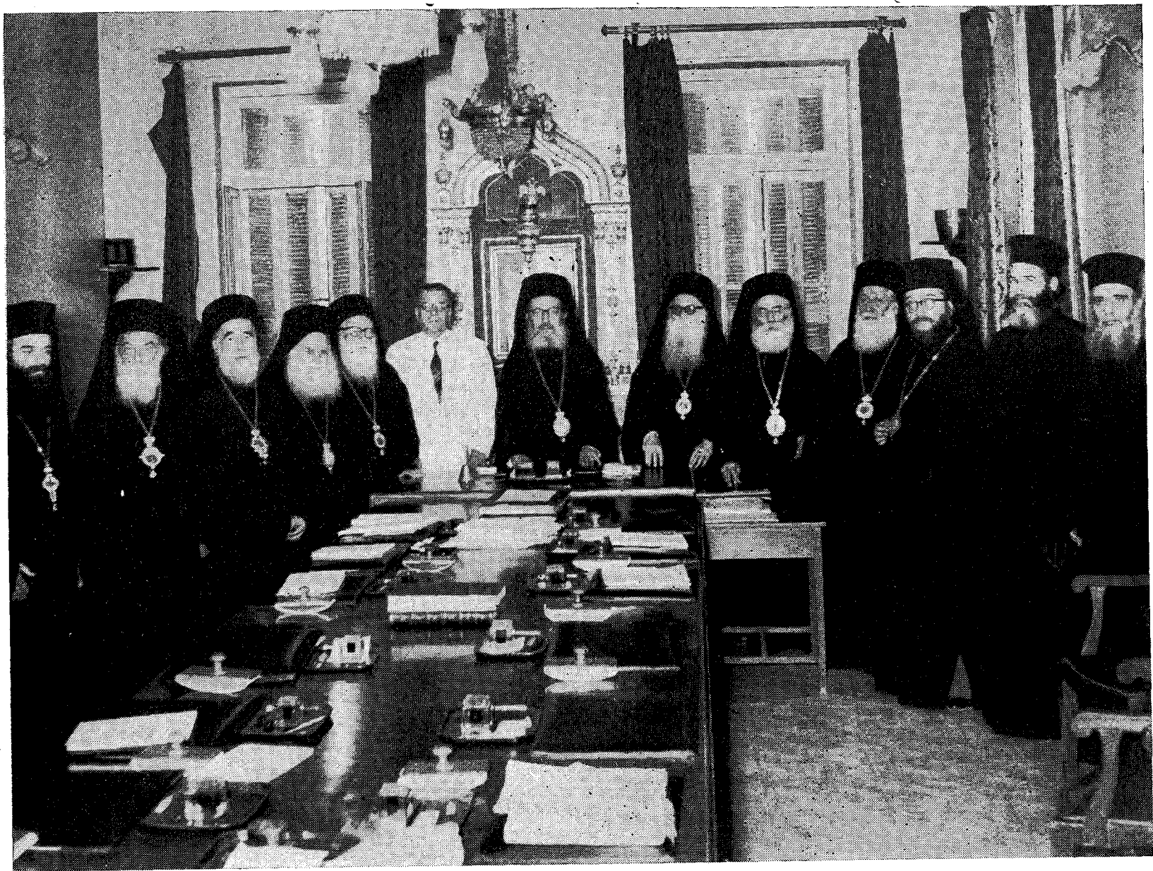
Ἡ ὑπὸ τὴν Προεδρίαν τοῦ Μακ. Ἀρχιεπισκόπου Ἀθηνῶν καὶ πάσης Ἑλλάδος κ. Θεοκλήτου πρώτη Συνεδρία τῆς Ἱερᾶς Συνόδου (13-8-57).