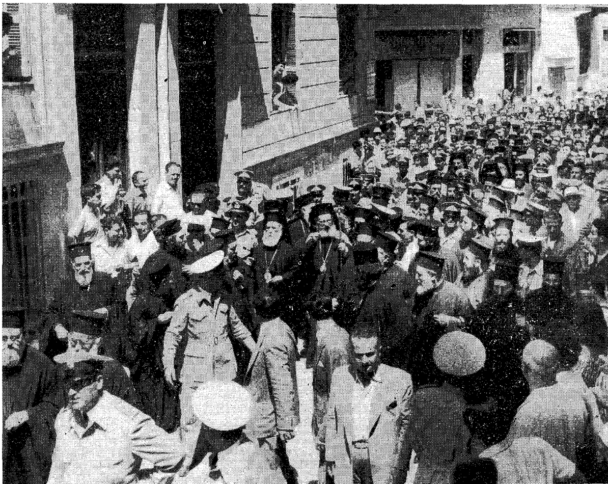
Ἡ Α. Μακαριότης ὁ νέος Ἀρχιεπίσκοπος, προσερχόμενος εἰς τὸ Ἀρχιεπισκοπικὸν Μέγαρον μετὰ τὴν ἐκλογὴν του.

Εἰς τὰ προαύλια τοῦ ἱεροῦ Ναοῦ ὑπεδέχθησαν τὴν Α. Μακαριότητα οἱ Σεβ. Μητροπολίται Θεσσαλονίκης κ. Παντελεήμων, ὅστις καὶ παρέδωκε τῷ Μακαριωτάτῳ τὴν ποιμαντορικὴν αὐτοῦ ράβδον, καὶ ὁ Σεβ. Μητροπολίτης Ἄρτης κ. Σεραφεῖμ. Ὁ Πρωτοσύγκελλος τῆς Ἱ. Ἀρχιεπισκοπῆς Ἀθηνῶν Πανος. Ἀρχιμ. κ. Γαβριὴλ Καλοκαιρινός, ἱστάμενος πρὸ τῆς κυρίας εἰσόδου καὶ φέρων τὸν Μανδύαν, ἐνέδυσσε τὴν Α. Μακαριότητα, μεθ' ἧς σχηματισθεῖσα πομπή, προηγουμένου τοῦ ἐκτελοῦντος χρέη Τελετάρχου Σεβ.