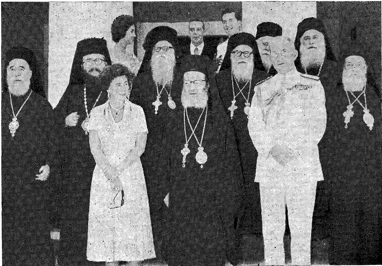
Τὰ μέλη τῆς Βασιλικῆς Οἰκογενείας, φωτογραφούμενα μετὰ τοῦ Μακαριωτάτου Ἀρχιεπισκόπου Ἀθηνῶν καὶ πάσης Ἑλλάδος κ. Θεοκλήτου καὶ τῶν μελῶν τῆς Ἱερᾶς Συνόδου μετὰ τὴν τελετὴν τῆς Διαβεβαιώσεως.

Ἐν ἀνεχεῖα, μετὰ τὴν ὑπὸ τοῦ Μακαριωτάτου Ἀρχιεπισκόπου γενομένην ἀπόλυσιν, οἱ χοροὶ ἔψαλαν τὴν φήμην τοῦ Μακαριωτάτου Ἀρχιεπισκόπου καὶ τὸν Βασιλικὸν πολυχρονισμόν. Μετὰ ταῦτα ἡ Α. Μακαριότης ἐδέχθη τὰ συγχαρητήρια τοῦ ἐκπροσωποῦντος τὴν Α. Μεγαλειότητα Μ. Αὐλάρχου κ. Λεβίδου, τῶν παρισταμένων Ὑπουργῶν, Ἀρχηγῶν κομμάτων καὶ λοιπῶν ἐπισήμων, ἀκολούθως δέ, συνοδευομένη ὑπὸ τῶν Σεβ. Ἀρχιερέων καὶ τοῦ Ἱεροῦ Κλήρου μετέβη, ζωηρῶς ἐπευφημουμένη ὑπὸ τοῦ κατακλύσαντος τὴν πλατεῖαν Μητροπόλεως καὶ τὴν ὁδὸν Ἁγ. Φιλοθέης πλήθους εἰς τὸ Ἀρχιεπισκοπικὸν μέγαρον, ἔνθα ἐδέχθη τὰς συγχαρητηρίους εὐχὰς τῶν Μελῶν τῆς Σ. Ἱεραρχίας καὶ τὰ εὐλαβῆ συγχαρητήρια τοῦ Κλήρου καὶ τοῦ Λαοῦ.