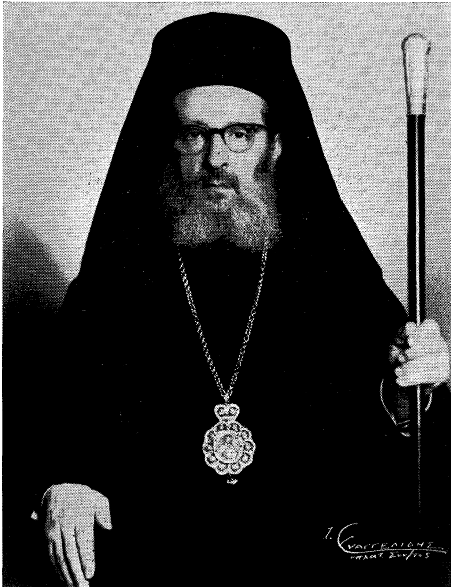
Ο ΜΑΚΑΡΙΩΤΑΤΟΣ ΑΡΧΙΕΠΙΣΚΟΠΟΣ ΑΘΗΝΩΝ ΚΑΙ ΠΑΣΗΣ ΕΛΛΑΔΟΣ ΚΥΡΙΟΣ ΘΕΟΚΛΗΤΟΣ

ΕΤΟΣ ΛΔ' | ΑΘΗΝΑΙ, ΦΙΛΟΘΕΗΣ 19 — ΤΗΛ. 27.689 | 1-15 ΣΕΠΤΕΜΒΡΙΟΥ 1957 | ΑΡΙΘ. 17-18