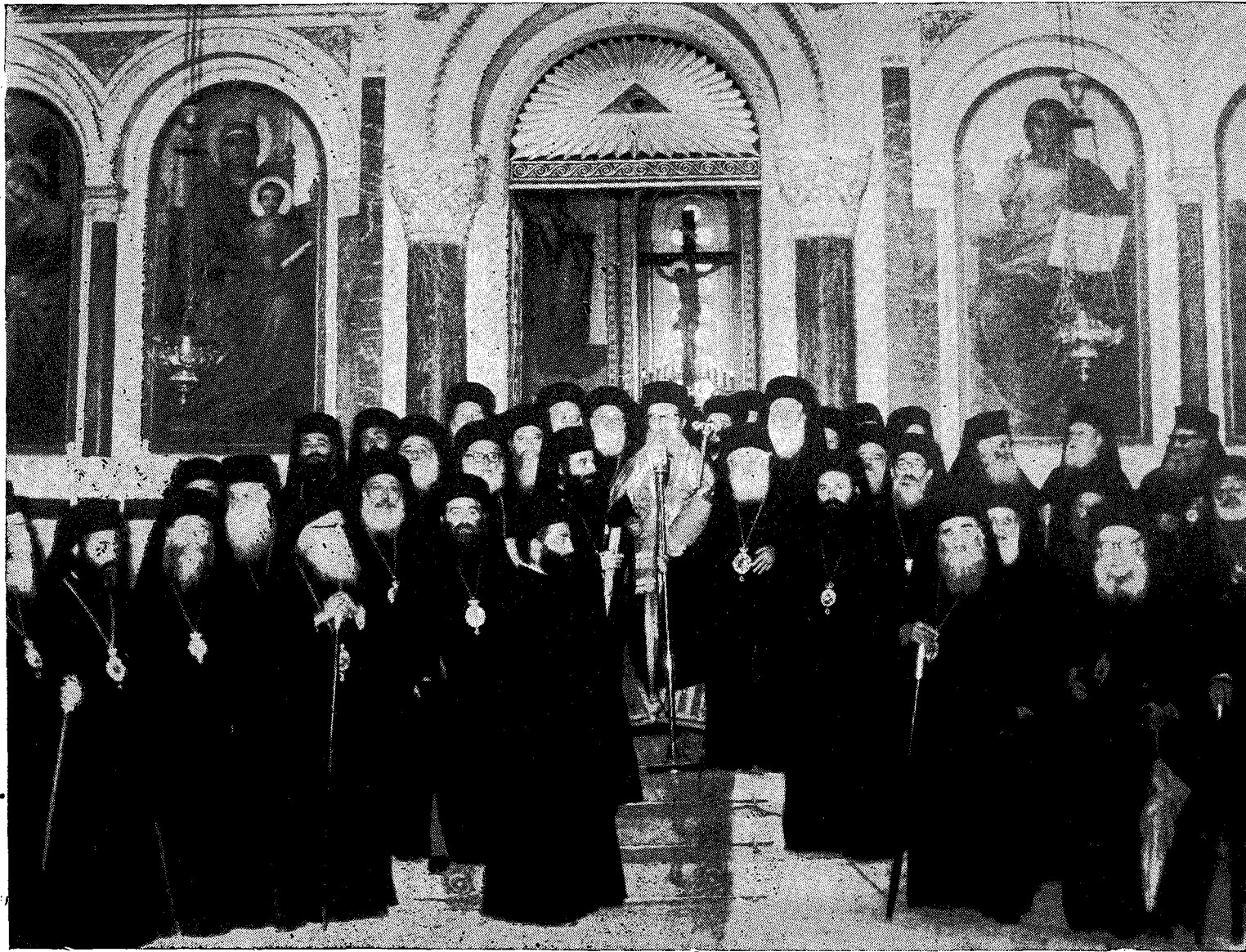
Ὁ νέος Ἀρχιεπίσκοπος Ἀθηνῶν καὶ πάσης Ἑλλάδος κ. Θεόκλητος τελῶν τὸ Μέγα Μήνυμα εὐθὺς μετὰ τὴν ἐκλογήν.