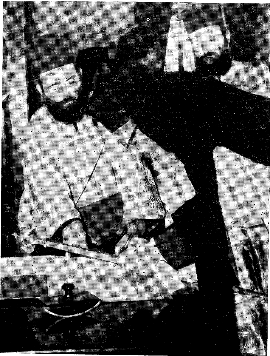
Ὁ Μακαριώτατος Ἀρχιεπίσκοπος Ἀθηνῶν καὶ πάσης Ἑλλάδος κ. Θεόκλητος ὑπογράφων τὸ πρωτόκολλον τῆς Διαβεβαιώσεως.

Ἐτι δεόμεθα ὑπὲρ τῶν εὐσεβῶν καὶ Ὁρθοδόξων Χριστιανῶν.