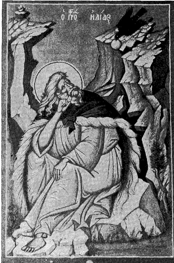
Ὁ Προφήτης Ἡλίας εἰς τὸ Καρμήλιον ὄρος.

Στεῖριον , βουνὸν κοινῶς λεγόμενον Στεῖρι, ὅπου καὶ χωρίον ὁμώνυμον. Ἐκεῖ πλησίον εὕρισκεται ἡ Μονὴ τοῦ ὁσίου Λουκά τοῦ Στεϊρίτου. Εἰς ἐκεῖνα τὰ μέρη ἤσκητευσαν πολλοὶ ὄσιοι, ἐν οἷς ὁ ὄσιος Δαυὶδ ὁ Γέρων ὁ ἐν Εὐβοίᾳ.