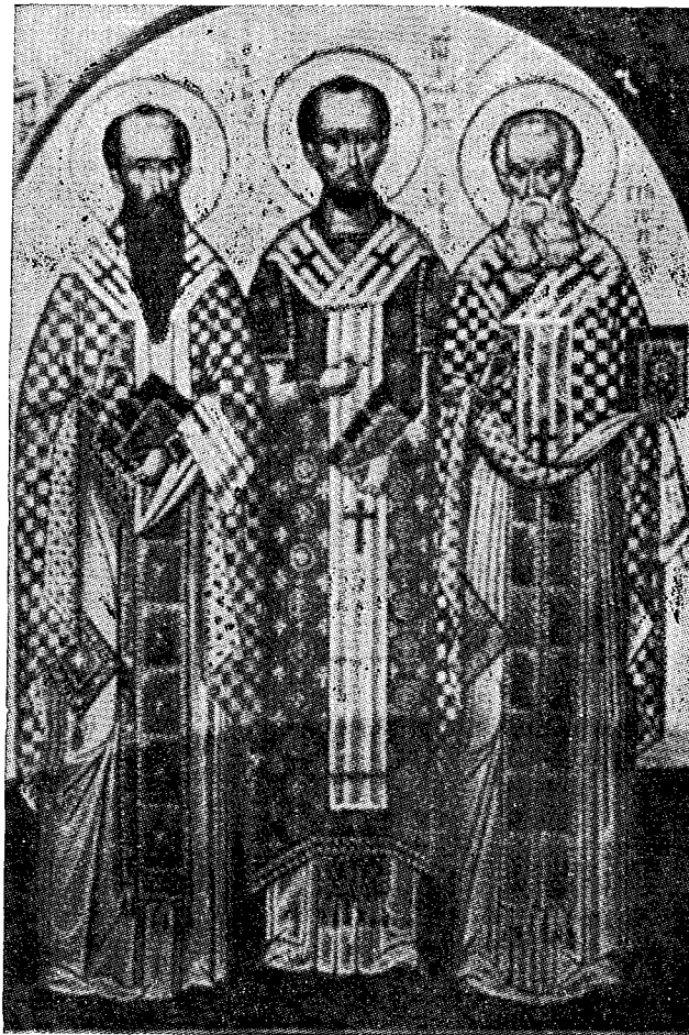
Οἱ Τρεῖς Ἱεράρχαι.

Θὰ ηὐχόμεθα δὲ ἀπὸ ψυχῆς νὰ ἐγίνετο ἐπιλογή τῶν λαμπρῶν αὐτῶν ὀμιλιῶν. Καὶ