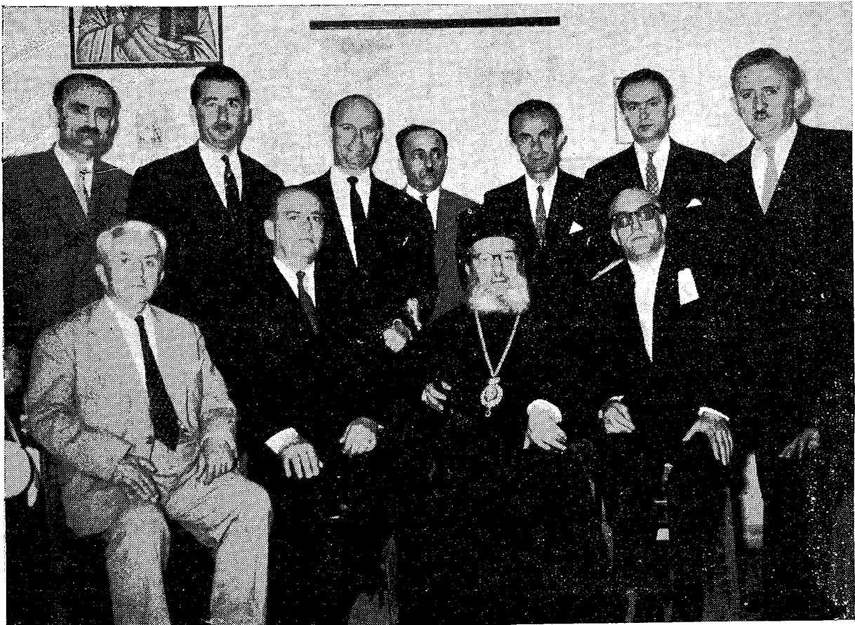
Ἄ Ο Μακ. Ἀρχιεπίσκοπος κ. Θεόκλητος μετὰ τοῦ Γεν. Διευθυντοῦ Ὁρησκευμάτων Καθηγητοῦ κ. Βασιλείου Ἰωαννίδου καὶ μετ' ἐκπροσώπων τῶν ἐργατικῶν τάξεων.

Ἄ Ἡ συγκέντρωσις πάντων ὑμῶν ἐντὸς τοῦ χώρου τοῦ Ἐκκλησιαστικοῦ τούτου πνευματικοῦ Κέντρου τῆς Ἀποστολικῆς Διακονίας, τῆς ὁποίας σκοπὸς τυγχάνει ἡ συστηματοποίησις τῶν πρακτικῶν δυνάμεων τῆς Ἐκκλησίας καὶ ὁ συγχρονισμὸς τοῦ Ἐκκλησιαστικοῦ ἔργου, ὥστε νὰ ἀκτινοβολήσῃ τὸ Ὀρθόδοξον Χριστιανικὸν Πνεῦμα λαμπρότερον εἰς τὰς ψυχὰς τῶν τέκνων τῆς, ἀποτελεῖ τὸν πλέον ἐκφραστικὸν συμβολισμόν καὶ τοῦ τρόπου, κατὰ τὸν ὁποῖον ἡ Ἐκκλησία μας ἀντιμετωπίζει οὐ μόνον τὴν ἐργασίαν καὶ τὸν ἐργαζόμενον ἄνθρωπον, ἀλλὰ καὶ τὴν ῥύθμισιν τῶν μεταξὺ τῶν