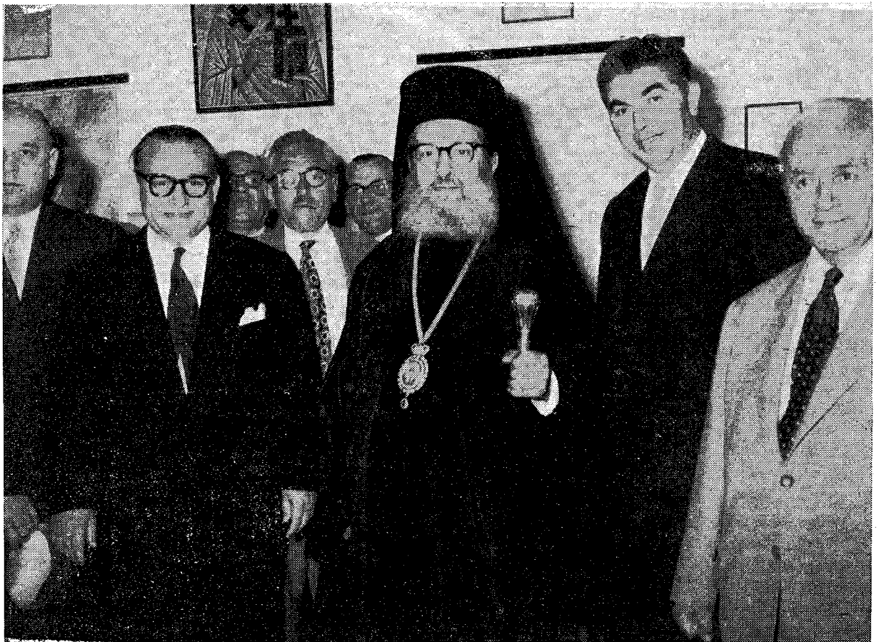
Ὁ Μακ. Ἀρχιεπίσκοπος κ. Θεόκλητος ἐν μέσῳ τοῦ Ὑπουργοῦ Ἐργασίας κ. Δημητράτου, τοῦ Γεν. Δ/ντοῦ Ὁρησκειμάτων, Καθ. κ. Β. Ἰωαννίδου, τοῦ Γεν. Διευθυντοῦ τῆς Ἀποστολικῆς Διακονίας, Καθηγητοῦ κ. Ἀνδρ. Φυτράκη, και ἄλλων προσώπων, λαβόντων μέρος εἰς τὸν πρῶτον ἑορτασμὸν τῆς ἁ' Ἐκκλησ. Ἡμέρας τοῦ Ἐργάτου.