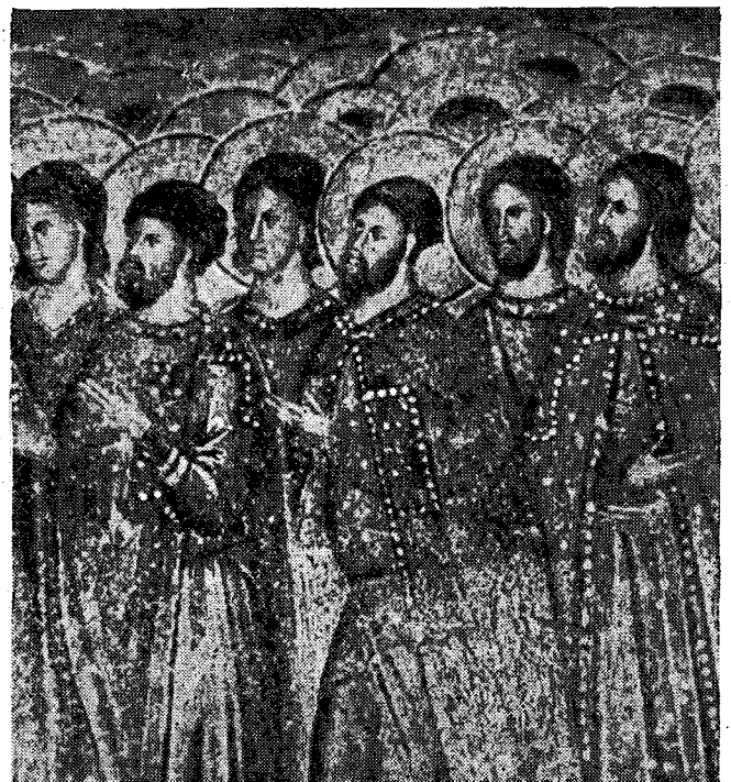
Τμήμα τοιχογραφίας ἐκ τοῦ ναοῦ Ὁδηγητῆρας (Ἄφεντικὸ) Μυστρά. Μάρτυρες (14ος αἰών).