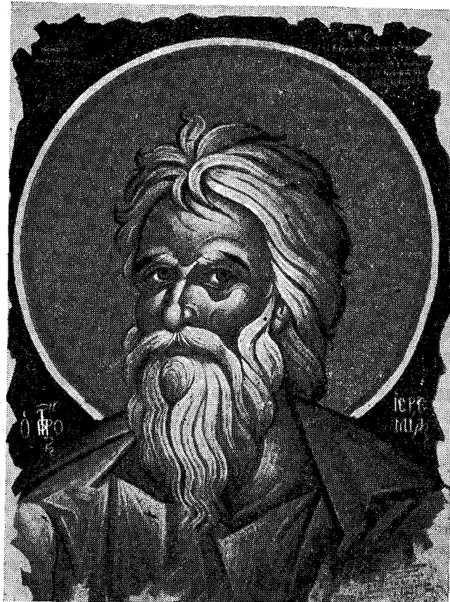
Ο ΠΡΟΦΗΤΗΣ ΙΕΡΕΜΙΑΣ

Ἐν ἀντιθέσει πρὸς τὴν γραμμὴν ταύτην τῆς Ὁρθοδοξίας ἡ Ἐκκλησιαστικὴ τέχνη τῆς Δύσεως, μὴ ἀποβλέπουσα εἰς τὸ βάθος ἀλλ' εἰς τὴν ἐπιφάνειαν, διεμόρφωσε τύπους τῶν ἱερωτάτων προσώπων βάσει ὀρισμένων φυσικῶν προτύπων (modèles). Οὕτως «ὠραῖοι» καὶ ὄνειροπόλοι νεανῖαι τῆς Δύσεως ἔγιναν τύποι τοῦ Χριστοῦ, ὀρισμένοι δὲ γυναῖκες, εὐνοούμεναι τῶν ἐκεῖ ζωγράφων, κατέστησαν ὑποδείγματα διὰ τὴν μορφήν τῆς Θεοτόκου. Ἄλλαις λέξεσιν αὕτη, ἡ ἐκείνη, ἡ αἰσθησιακῶς ὠραία γυνή, ἐδάνεισε τὴν μορφήν της, εἰς πλείστους ζωγράφους, διὰ τὴν ἀπεικονιστὴν τῆς ἀχράντου, Ὑπεραγίας Θεοτόκου! Τοιοῦτο-