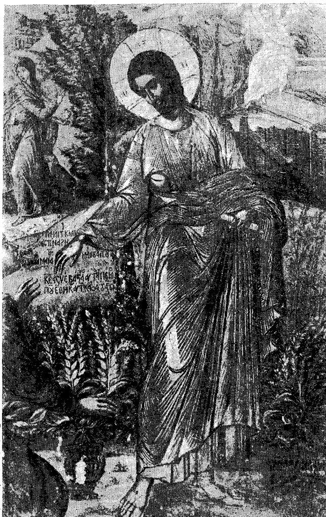
Σκηνή της Άναστάσεως. Ο Χριστός εμφανίζεται εις την Μαρίαν την Μαγδαληνήν: Λεπτομέρεια εικόνας του περιφήμου ζωγράφου Μιχαήλ Δαμασκηνού (16ος αιών).