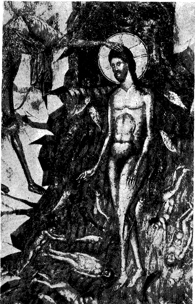
Ἡ Βάπτισις τοῦ Χριστοῦ, τοῦ Ναοῦ τῆς Περίβλεπτον τοῦ Μυστρά (14ος αἰών).