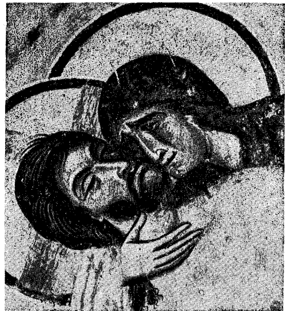
Ὁ ἐπιτάφιος θρῆνος. Λεπτομέρεια βυζαντινῆς τοιχογραφίας εἰς Νέρεζι Σερβίας, τέλους τοῦ 12ου αἰῶνος.