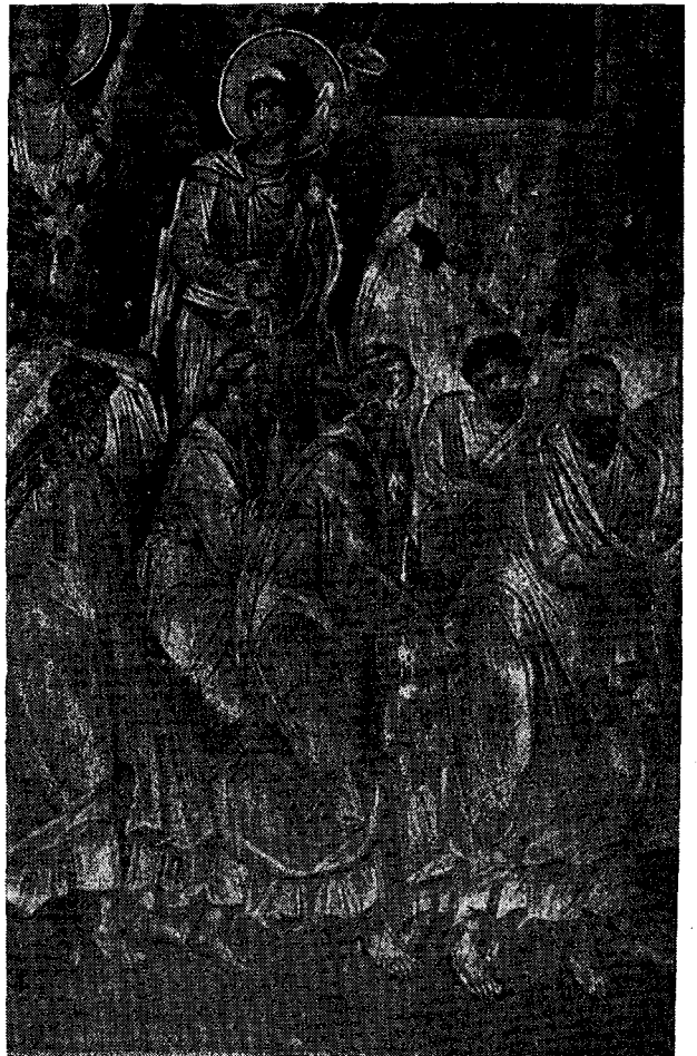
Ἄποστολοι. Λεπτομέρεια βυζαντινῆς τοιχογραφίας τῆς Κοιμήσεως τῆς Θεοτόκου ἐκ τῆς Σερβικῆς Gratchanitsa (1321).