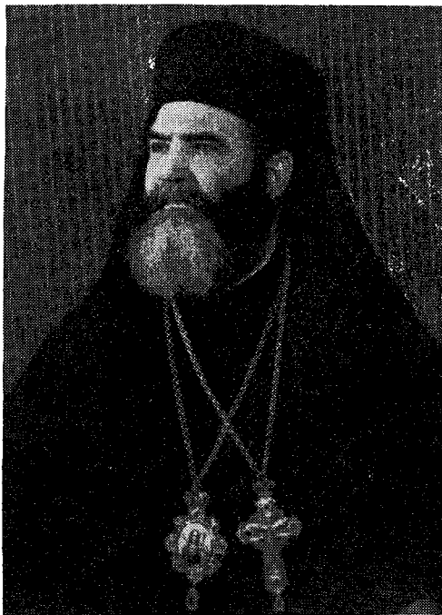
Ὁ Σεβ. Μητροπολίτης Φθιώτιδος κ. Δαμασκηνός

Πέραν τούτων φιλοδοξοῦμεν, ὅπως, πρὸς δόξαν τοῦ ὀνόματος τοῦ Μεγάλου Θεοῦ καὶ Σωτῆρος ἡμῶν Ἰησοῦ Χριστοῦ καὶ πρὸς σωτηρίαν τῶν ψυχῶν, καταστήσωμεν τὸ Ἐπισκοπεῖον ἡμῶν προσίτον τοῖς πᾶσι, πρότυπον Ἐκκλησιαστικῆς ζωῆς, σεμνότητος βίου, ἀντιλήψεως καθήκοντος, ἀφωσιωμένης διακονίας, πειθαρχίας καὶ τοιαύτης καθ' ὅλα παραστάσεως, ὥστε τοῦτο νὰ ἀποτελέσῃ δι' ὅλους τοὺς ἔχοντας τὰ βλέμματα ἐστραμμένα πρὸς αὐτὸ ἀφορμὴν μόνον ἐπαίνου,