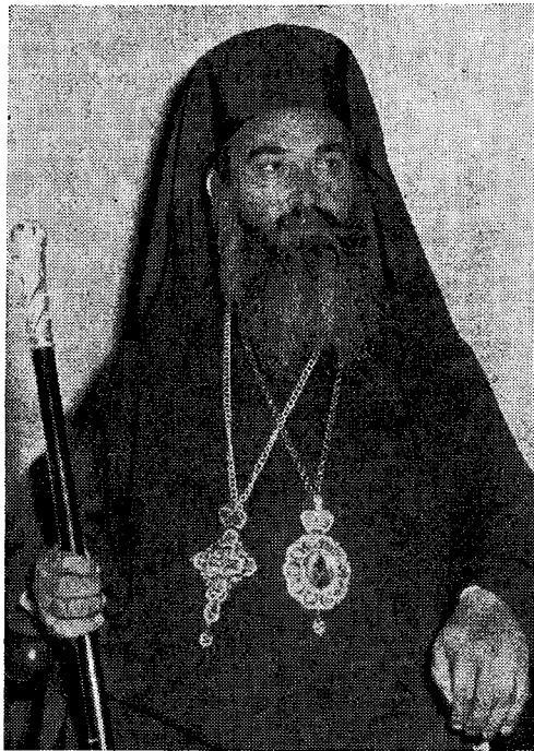
Ὁ Σεβ. Μητροπολίτης Τριφυλίας καὶ Ὀλυμπίας κ. Στέφανος

Μὲ τοιαύτας σκέψεις καὶ μὲ τοιαύτην συνειδήσιν, χριστεπώνυμε λαέ, ἀναβαίνω εἰς τὸν θρόνον τοῦτον. Ἐν ὀνόματι Κυρίου ἐρχομαι πρὸς Ὑμᾶς καὶ τὴν εὐλογίαν ἄδου κομίζω ὑμῖν, τῷ «Χαίρε» τῆς Ἀναστάσεως προσφωνῶν πάντας ὑμᾶς, τὸν τε ἐδλαβέστατον ἱερόν