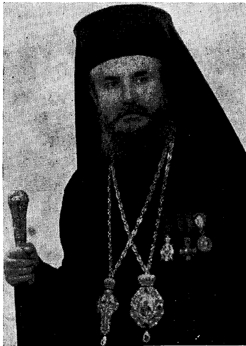
Ὁ Σεβ. Μητροπολίτης Λαρίσης καὶ Πλαταμῶνος κ. Ἰάκωβος

Θὰ ἠθέλωμεν δὲ νὰ γνωρίζῃ ἀπὸ τοῦδε τὸ ποιμνιον ἡμῶν, ὅτι διὰ πᾶν δίκαιον αὐτοῦ αἴτημα θὰ δύναται