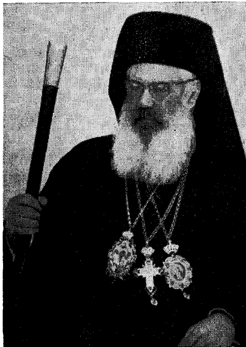
Ὁ Σεβ. Μητροπολίτης Κασσανδρείας κ. Συνέσιος

Πολλὰς τὰς χάριτας ὁμολογῶ πρὸς τὸν πολυσέβαστόν μου Πατέρα καὶ Δεσπότην, τὸν Σεβασμιώτατον Μητροπολίτην Χαλκίδος Κύριον Γρηγόριον, τοῦ ὁποίου δὲν ἔχομεν τὴν χαρὰν τῆς παρουσίας ἐν μέσῳ ἡμῶν. Τὸ μῆκος τῆς ὁδοῦ, αἱ συμπαραομαρτοῦσαι ταλαιπωρίαι καὶ οἱ ἀναπόφευκτοὶ κόποι, τὸ σχετικῶς προκωρημένον τοῦ βίου Αὐτοῦ με ἠνάγκασαν νὰ παρακαλέσω, ὅπως μὴ ἐπιμείνῃ ἐπὶ τοῦ σχεδίου του τιμητικῆς