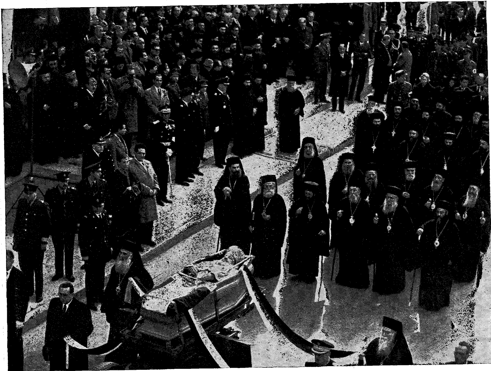
Ἡ ἐκφορά τοῦ σεπτοῦ σκηνώματος.