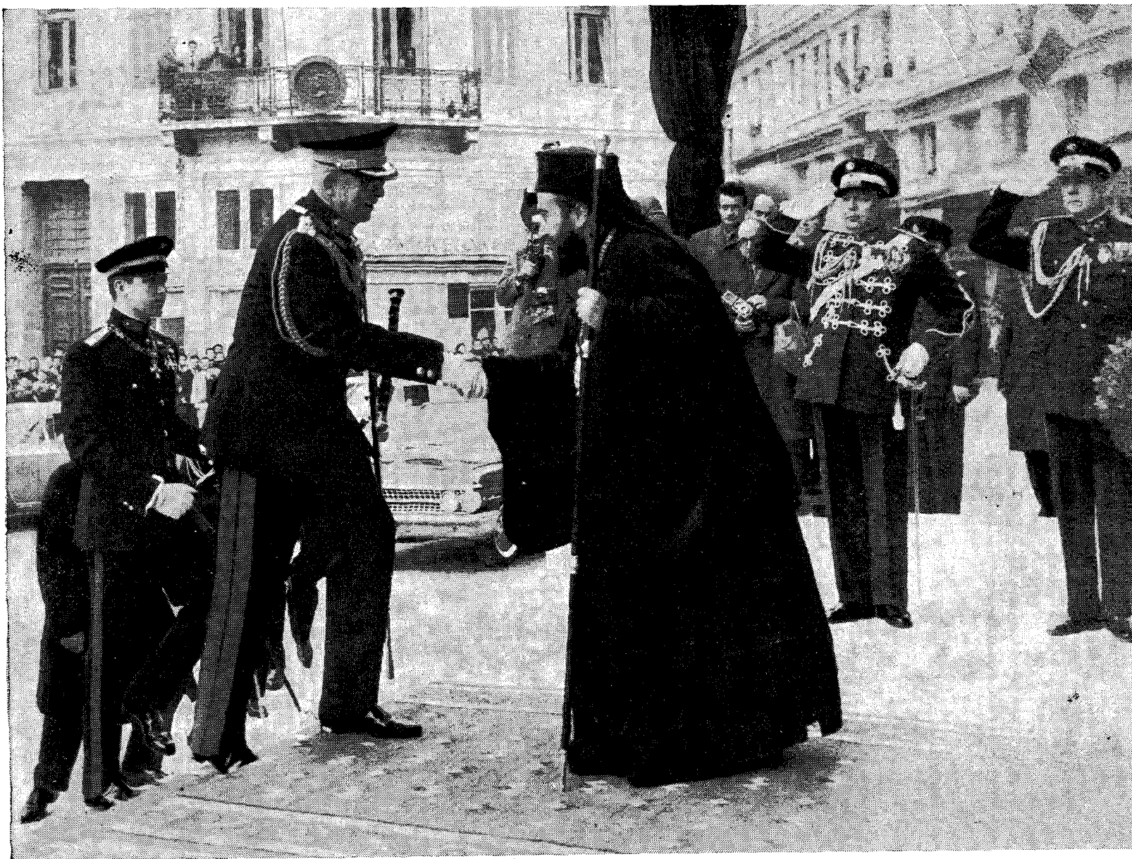
Ο έκτελών χρέη τελετάρχου κατά την κηδείαν Σεβ. Μητροπολίτης Νικοπόλεως και Πρεβέζης κ. Στυλιανός υποδεχόμενος έν τῷ Ἱ. Μητροπολιτικῷ Ναῶ τὴν Α. Μ. τὸν Βασιλέα Παῦλον καὶ τὴν Α. Β. Υ. τὸν Διάδοχον Κωνσταντῖνον.