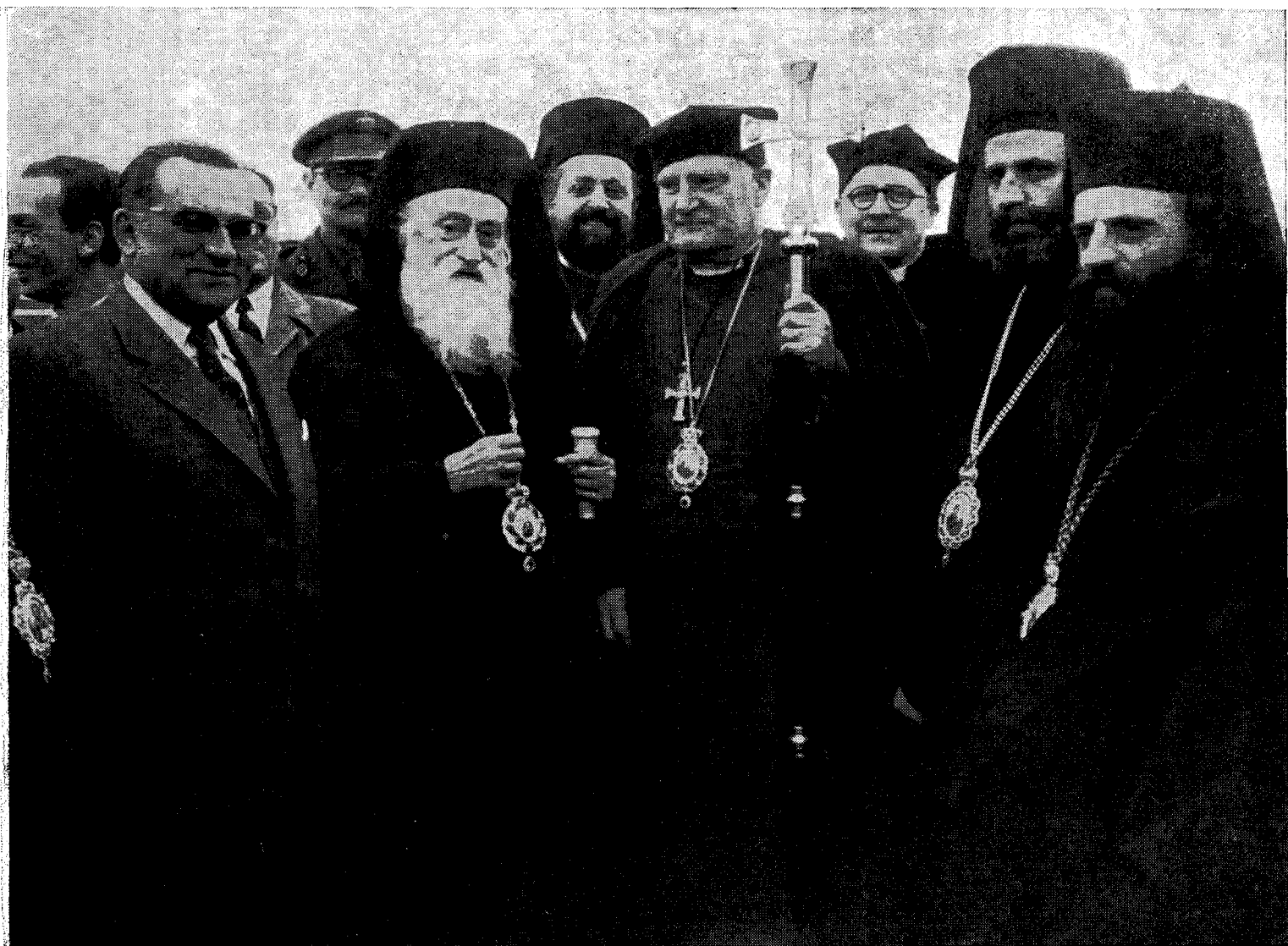
Ἀπὸ τὴν ὑποδοχὴν τοῦ Ἀρχιεπισκόπου Κανταουρίας. Ἡ Α. Μ. ὁ Ἀρχιεπίσκοπος Ἀθηνῶν καὶ πάσης Ἑλλάδος κ. Χρυσόστομος μετὰ τῆς Α. Χάριτος τοῦ Ἀρχιεπισκόπου Κανταουρίας καὶ Πριμάρτου πάσης Ἀγγλίας Δρ. Ράμσεϋ καὶ τοῦ Ἐξοχωτάτου Ὑπουργοῦ Ἐθνικῆς Παιδείας καὶ Θρησκευμάτων κ. Γρηγ. Κασσιμάτη, καὶ ἄλλων ἐπισήμων.