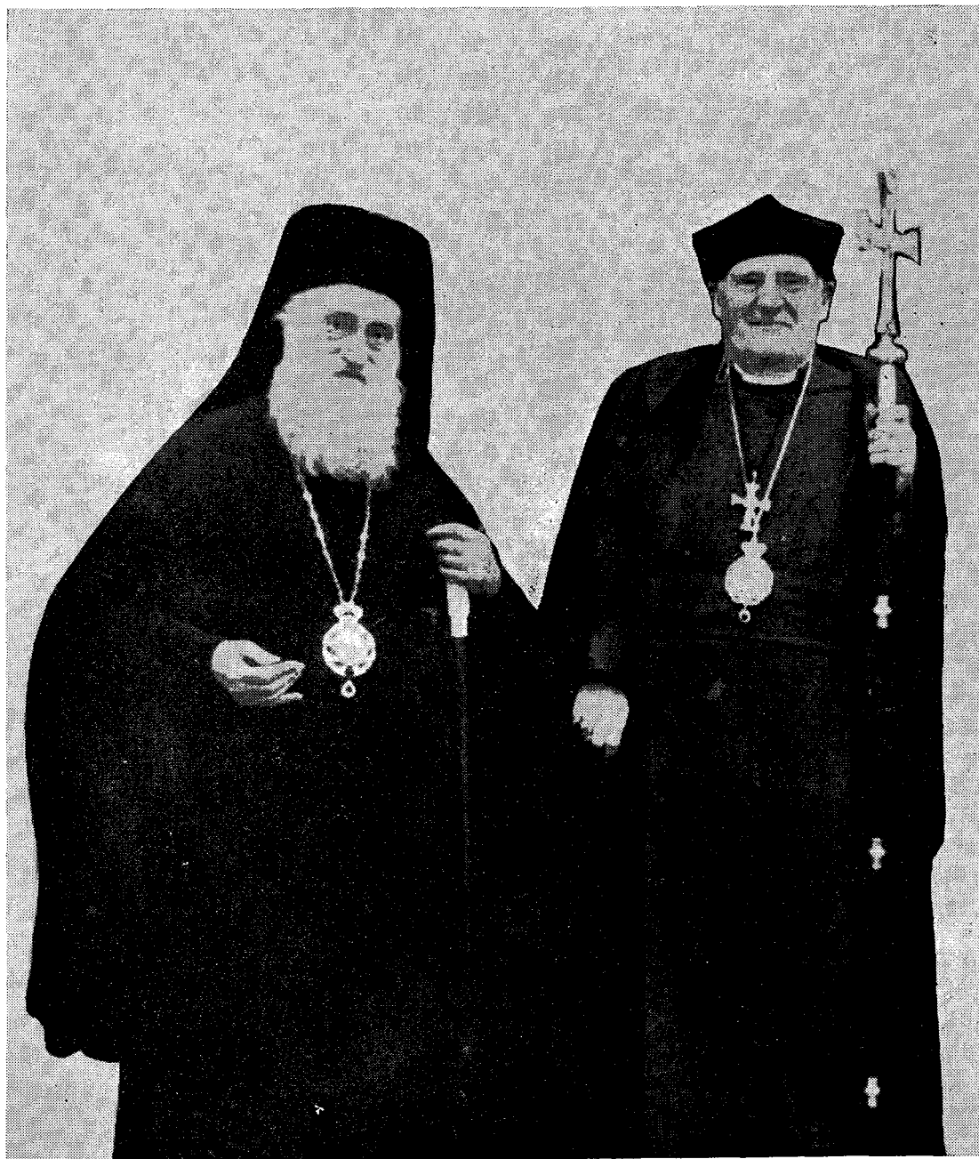
Ὁ Μακ. Ἀρχιεπίσκοπος Ἀθηνῶν καὶ πάσης Ἑλλάδος κ. Χρυσόστομος μετὰ τῆς Α. Χάριτος τοῦ Ἀρχιεπισκόπου Καντουαρίας κ. Μ. Ράμσεϋ.

ΕΤΟΣ ΛΘ' | ΑΘΗΝΑΙ, ΦΙΛΟΘΕΗΣ 19 — ΤΗΛ. 227.689 | 15 ΜΑΪΟΥ 1962 | ΑΡΙΘ. 10