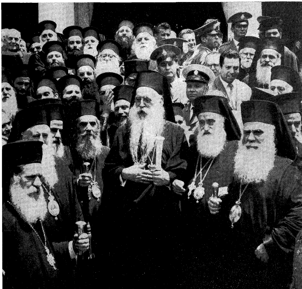
Ἡ Α.Θ.Π. ὁ Οἰκουμενικὸς Πατριάρχης κ. Ἀθηναγόρας πρὸ τοῦ Μητροπολιτικοῦ Ναοῦ ἐν τῷ μέσῳ τοῦ Μακαριωτάτου Πατριάρχου Ἱεροσολύμων κ. Βενεδίκτου καὶ τοῦ Μακαριωτάτου Ἀρχιεπισκόπου Ἀθηνῶν κ. Χρυσοστόμου.

Ὡς ἄλλος θεόπτης Μωϋσῆς κατήλθατε ἀπὸ τοῦ ὄρους τοῦ ἁγιονόμου, ὅπου ἐλαμπύνατε διὰ τῆς παρουσίας Σας τὸν ἑορτασμὸν τῆς 1000ετηρίδος ἀπὸ τῆς ἰδρύσεως ἐν αὐτῷ τῆς πρώτης μοναστικῆς πολιτείας, κομίζοντες οὐχὶ τὰς λιθίνας πλάκας τοῦ νόμου εἰς ἡμᾶς, ἀλλὰ τὴν χάριν καὶ τὴν εὐλογίαν τοῦ τόπου αὐτοῦ τῆς ἀσκήσεως, ὡς καὶ τὸ ἄρωμα τῶν εὐαγγελικῶν ἀρετῶν τῶν ἐν ἀσκήσει διαλαμπάντων ὁσίων πατέρων καὶ τῶν καὶ νῦν ἀσκουμένων ἐν Χριστῷ ἀδελ-