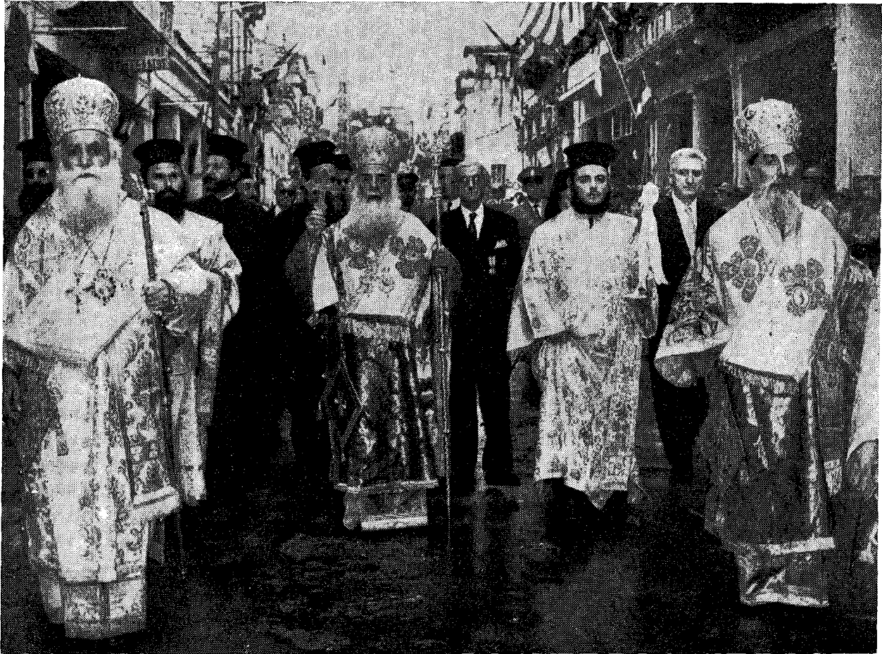
Ἄπὸ τὴν λιτάνευσιν τῆς τιμίας Κάρας τοῦ Ἁγ. Ἀποστόλου Ἀνδρέου.

Περαιτέρω, πληροφοροῦμεθα ἀρμοδίως, ὅτι ἐξητήθη ὑπὸ τῶν ἐν Ρώμῃ, ἵνα ἡ ἐπιστρεφομένη ἡμῖν τιμία Κάρα ἐναποτεθῇ πρότερον ἐν τῷ ἐν Ἀθήναις ρωμαιοκαθολικῷ Ἱ. Ναῷ ἢ (ἐφ' ὅσον τοῦτο ἐθεωρήθη πρόκλησις καὶ δὲν ἐγένετο δεκτὸν) τοῦλάχιστον ἐν τῷ ἐν Πάτραις ὁμοίῳ, πρὸ τῆς παραδόσεως αὐτῆς εἰς τὴν ἡμετέραν Ἐκκλησίαν. Καὶ ἐχρειάσθη νὰ ἀντιτάξῃ ἐπίμονον ἄρνησιν ὁ Σεβ. Μητροπολίτης Πατρῶν, ἀξιῶσας ἵνα ἅμα τῇ ἀφίξει τῆς Κάρας εἰς τὴν πόλιν τῶν Πατρῶν παραδοθῇ αὕτη εἰς αὐτόν, ὡς δικαιοῦχον καὶ ἀρμόδιον διὰ τὰ περαιτέρω, ὅπερ καὶ ἐγένετο, κατανοηθέντος (;) ὑπὸ τῶν κύκλων τοῦ Βατικανοῦ ὅτι τοιαῦται ἀπαιτήσεις δὲν εἶναι εὐθεῖαι, ἀλλὰ σκολιαί, καὶ δὲν προάγουν τὴν ἀγάπην καὶ τὴν ἐνότητα.