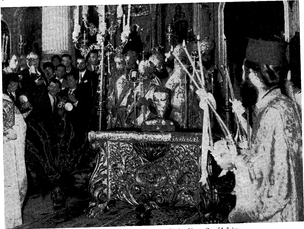
Ἡ λειψανοθήκη τῆς Τιμίας Κάρας τοῦ Ἁγίου Ἀποστόλου Ἀνδρέου.

«Ὅθεν νῦν, ὅτε ἡ τιμιωτάτη αὕτη Κάρα ἐπανερχεται εἰς τὸν ἀρχικὸν αὐτῆς τόπον, Παῦλος ὡς ὁ Πῖος, Ἐπίσκοπος τῆς Καθολικῆς Ἐκκλησίας καὶ εἰκόδοχος τοῦ Πέτρου, ἀναφωνεῖ δεόμενος: Ἁγιῆ Ἀνδρέα Προτόκλητε, ὁ εἰς τὸ ὑψηλότερον ἀποστολικὸν ἀξίωμα ἀναδειχθεὶς καὶ Σίμωνα τὸν συναίμονα καλέσας, τοῦ Κυρίου μαθητὰ καὶ Πέτρον σύγγονε, συναπόσταλε καὶ συμμάρτις, ἰκέτευε Χριστῷ τῷ Θεῷ ἡμῶν ὅπως τὸ πολυτίμον τοῦτο λείψανον, τὸ παρὰ τὸν τάφον τοῦ ἀδελφοῦ καταφυγῆν εὐχόν, ἀποβῆ σύμβολον καὶ προτροπὴ ἀδελφωσύνης ἐν μιᾷ ἐν Χριστῷ πίστει καὶ ἐδλαβείᾳ καὶ ἀμοιβαίᾳ ἀγάπῃ. Νῦν δὲ ἐπανερχόμενος τῇ πατρίδι σου, τῇ ὑπὸ τοῦ μαρτυρίου Σου λαμπροποίησιν καὶ τῆς αὐτῆς ἀπολαμβάνων τιμῆς, ἧς ἐν τῇ