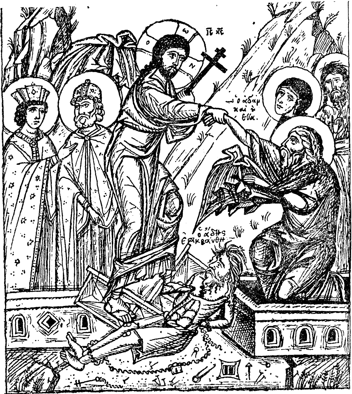
Ἡ εἰς ἄδου κάθοδος.

ΕΤΟΣ ΜΒ' | ΑΘΗΝΑΙ, ΦΙΛΟΘΕΗΣ 19. — Τηλ. 227-689 | 15 ΑΠΡΙΛΙΟΥ 1965 | ΑΡΙΘ. 8