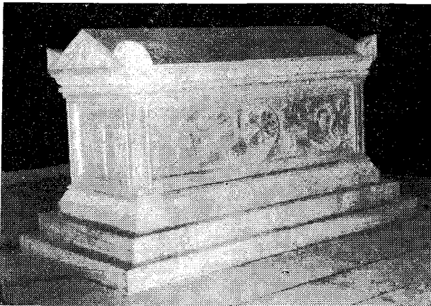
Ἡ σαρκοφάγος ἐντὸς τῆς ὁποίας ἐναπετέθη τὸ σεπτὸν σκῆνωμα τοῦ Μητροπολίτου Οὐγγροβλαχίας Ἰγνατίου τοῦ Λεσβίου.

Ἡ τελετὴ ἀπετέλει συντεταγμένην νεκρώσιμον ἀκολουθίαν τὴν ὅποιαν ἔψαλον ἐμμελῶς καὶ μετὰ βαθυτάτης κατανύξεως οἱ Σεβ. Ἀρχιερεῖς μετὰ τοῦ ἱεροῦ κλήρου, ὡς καὶ ἡ χορωδία Μυτιλήνης ἦτις, κατὰ κοινήν ὁμολογίαν, ἐξετέλεσεν ἄριστα τοὺς στίχους τοῦ «Ἀμώμου», τὸ «Μετὰ τῶν ἁγίων ἀνάπαυσον Χριστέ...» ὡς καὶ τὸ «αἰωνία ἡ μνήμη...» προκαλέσασα βαθεῖαν κατάνυξιν. Μετὰ τὴν ἀπό-