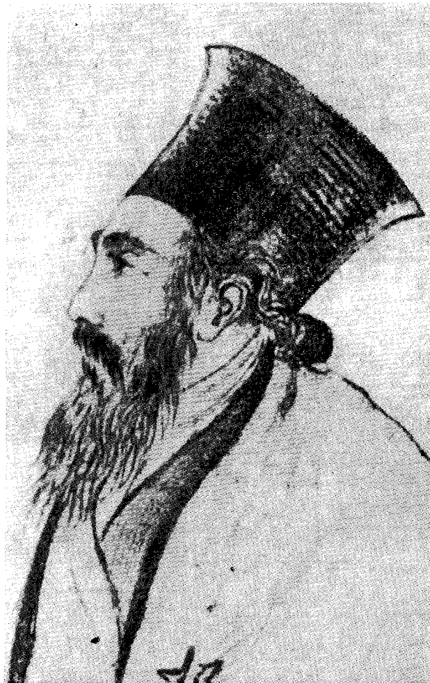
Ὁ Μητροπολίτης Οὐγγροβλαχίας Ἰγνάτιος ὁ Λέσβιος

Ὁ ἐνταφιασμὸς τῆς σεπτῆς σοροῦ γενόμενος τὴν Κυριακὴν 21 Μαρτίου ἀπετέλεσε διὰ τὴν Μυτιλήνην συγκινητικὸν μὲν, ἀλλὰ καὶ πανευφρόσυνον γεγονός. Ἡ σκέψις ὅτι θὰ ἀνεπαύετο πλέον εἰς τὰς ἀγκάλας τῆς Λέσβου τὸ τόσον τετιμημένον τέκνον τῆς, ἡ συμμετοχὴ τῶσων προσωπικοτήτων, Σεβασμιωτάτων Μητροπολιτῶν, Ὑπουργῶν καὶ ἄλλων