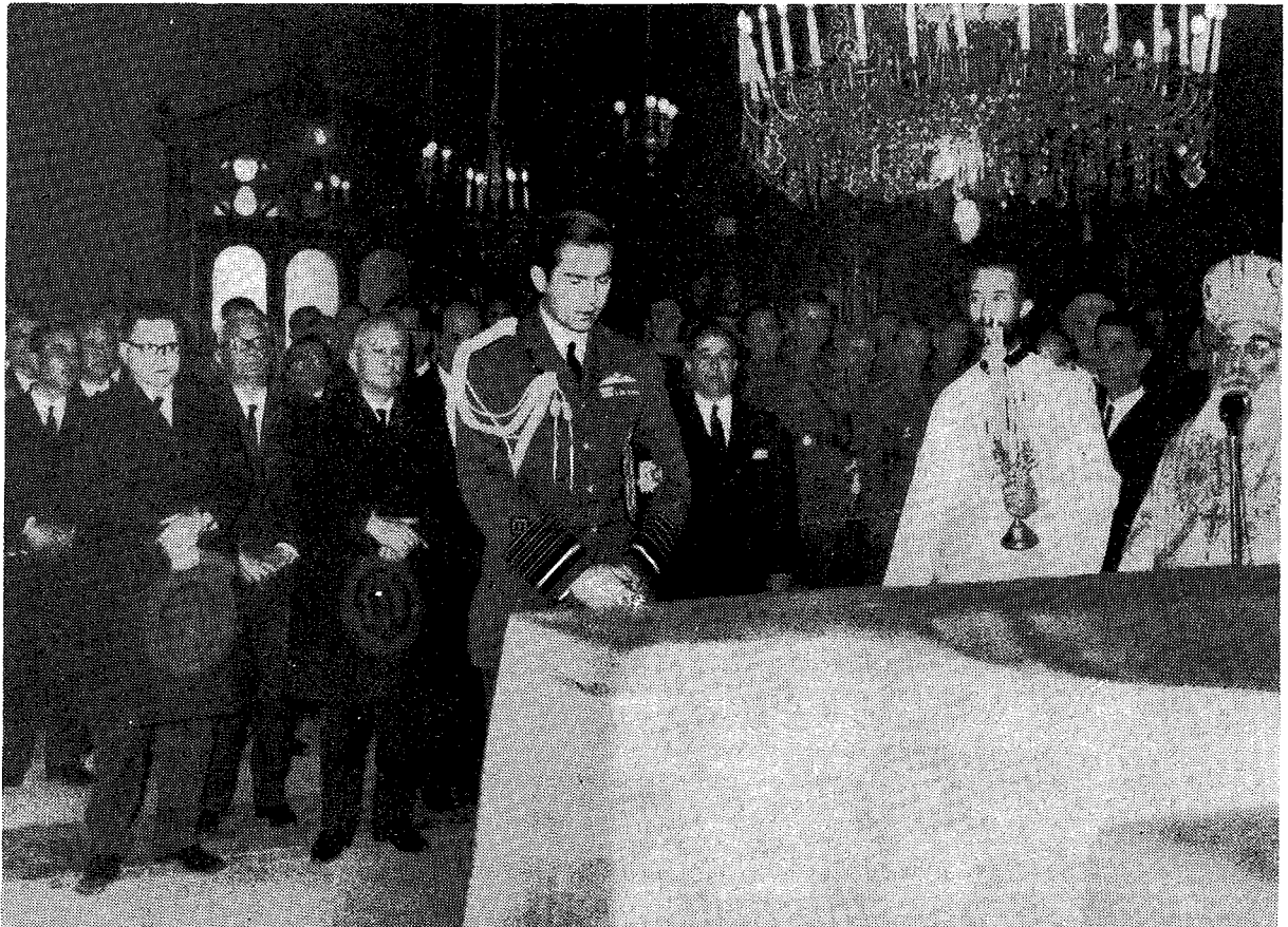
Ἡ Α.Μ. ὁ Βασιλεὺς μετὰ τὴν ταφὴν βαθύτατα συγκινημένος προσεύχεται.

Ἡ Α.Μ. ὁ Βασιλεὺς συνοδευόμενος ὑπὸ τοῦ Αὐτάρχου μετεκινήθη ἐκ τοῦ Σωλείου καὶ ἔλαβε θέσιν πρὸ τῆς σαρκοφάγου. Τότε προσελθὼν ἐκ τῆς Ὡραίας Πύλης ὁ Σεβ. Μητροπολίτης Μυτιλήνης πλησίον τοῦ φερέτρου ἀφήρσεν τὰ ἐπ' αὐτοῦ εὑρισκόμενα ἀρχιερατικὰ διάσημα, ἦτοι τὴν Μίτραν, τὴν ποιμαντορικὴν ράβδον ὡς καὶ τὸ ἱερὸν εὐαγγέλιον. Ἀμέσως τότε ἐν μέσῳ ἄκρας σιγῆς, τέσσαρες εὐσταλεῖς στρατιῶται παρέλαβον τὸ φέρετον ἀπὸ τὸν Σωλεῖαν, τὸ ἐκράτησαν ἐπὶ τῶν ὤμων καὶ μὲ βραδὺ βᾶδισμα ἐν ἄκρᾳ εὐλαβείᾳ, προπορευομένων μόνον τοῦ Τιμίου Σταυροῦ καὶ τοῦ Σεβ. Μητροπολίτου