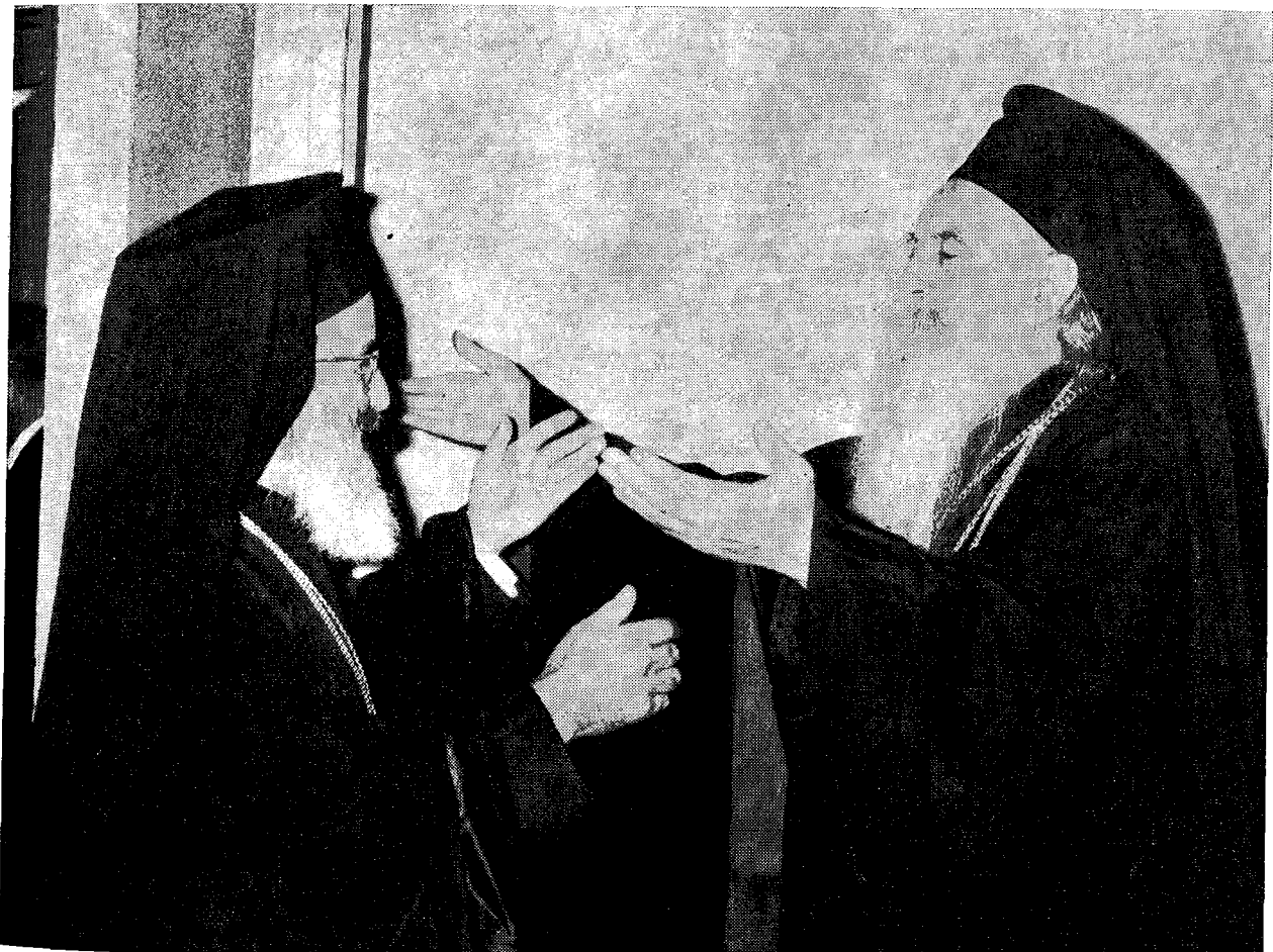
Ἡ Α.Θ.Π. ὁ Οἰκουμενικὸς Πατριάρχης κ. Ἀθηναγόρας καὶ ἡ Α. Μακαριότης ὁ Ἀρχιεπίσκοπος Ἀθηνῶν καὶ πάσης Ἑλλάδος κ. Ἱερώνυμος ἔτοιμοι νὰ ἀνταλλάξουν τὸν ἀσπασμὸν τῆς ἀγάπης.

Τὸ ἑσπέρας τῆς ἰδίας ἡμέρας οἱ Προκαθήμενοι τῶν δύο Ἐκκλησιῶν εἶχον κατ' ἰδίαν σύσκεψιν ἐπὶ