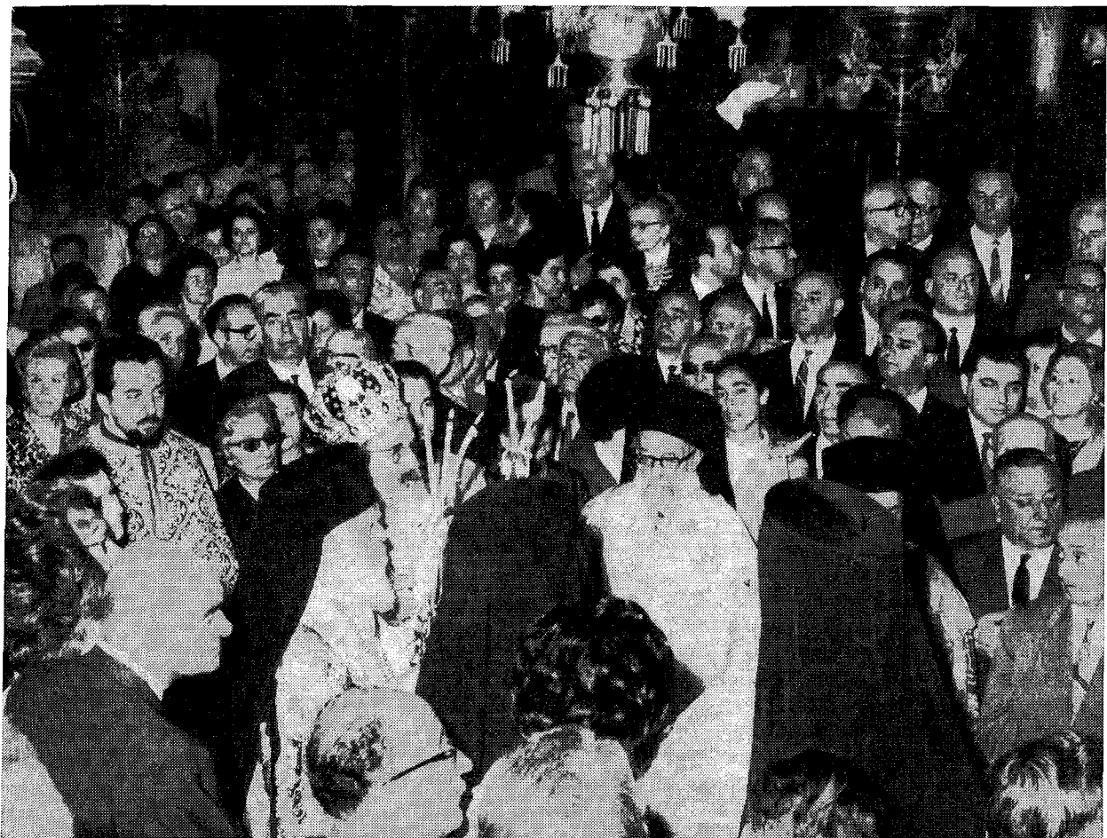
Στιγμιότυπον ἀπὸ τὴν θείαν Λειτουργίαν, τὴν ὁποίαν ἐτέλεσεν ἡ Α. Μακαριότης ὁ Ἀρχιεπίσκοπος Ἀθηνῶν καὶ πάσης Ἑλλάδος κ. Ἱερώνυμος εἰς τὸν ἐν ΚΠόλει πατριαρχικὸν ναὸν τοῦ Ἁγίου Γεωργίου.

νήσεως ταῦτα, ἐξέφρασε δὲ τὰ συγχαρητήρια διὰ τὰ λίαν εὐχάριστα συμπεράσματα τῶν διεξαχθειῶν συνομιλιῶν καὶ ηὐχέθη εἰς τὸν Μακαριώτατον ὑγείαν μακρὰν πρὸς πραγμάτων τῶν συμφωνηθέντων. Ἡ Ἱερὰ Σύνοδος ἐπεκρότησεν ἐκθύμως τόσον τὴν πρὸς τὴν Α.Θ.Π. γενομένην ὑπὸ τοῦ Μ. Ἀρχιεπισκόπου πρόσκλησιν, ὅπως οὗτος ἐπισκεφθῆ καὶ πάλιν τὴν Ἐκκλησίαν τῆς Ἑλλάδος εἰς προσεχῆ περιοδείαν Αὐτοῦ, ὅσον καὶ τὴν πρὸς τὸν Παναγιώτατον δοθεῖσαν διαβεβαίωσιν τοῦ Μακαριωτάτου, ὅτι διὰ τὴν ἀνανέωσιν τῆς φιλίας τῶν δύο λαῶν θὰ πράξῃ πᾶν τὸ δυνατόν. Ἐξεφράσθησαν ἐπίσης αἱ θερμαὶ τῆς Ἱερᾶς Συνόδου εὐχαριστίαι πρὸς τὴν Α.Θ.Π. τὸν Οἰκονομικὸν Πατριάρχην διὰ τὰς προσγενομένας τῷ Μακαριωτάτῳ καὶ τῇ συνοδείᾳ Αὐτοῦ τιμὰς, αἱ ὁποῖαι ἀντανταλοῦν εἰς τὴν καθόλου Ἐκκλησίαν τῆς Ἑλλάδος».