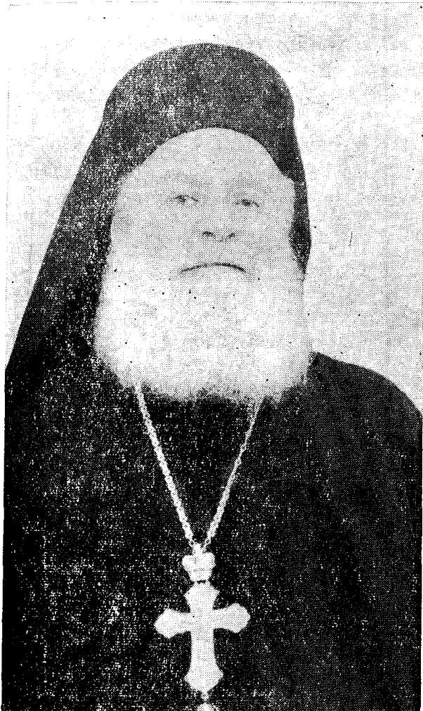
† Ὁ Ἀλεξανδρουπόλεως κ. Κωνστάντιος

Εἰς περισσότερα ἀπὸ 15 χωρία τῆς ἐπαρχίας