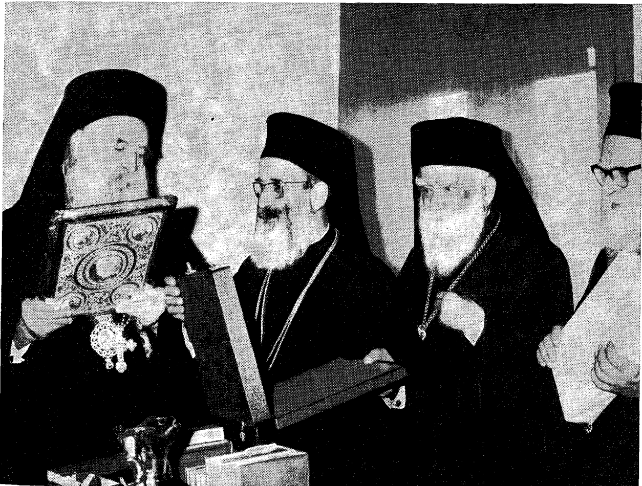
Ἡ Α.Θ.Π. ὁ Οἰκουμενικὸς [Πατριάρχης] κ. Ἀθηναγόρας παραλαμβάνει τὸ βαρύτιμον Εὐαγγέλιον, ὅπερ προσέφερεν εἰς αὐτὸν ὁ Προκαθήμενος τῆς Ἐκκλησίας τῆς Ἑλλάδος κ. Ἱερώνυμος.

Συνεχίζων ὁ Μακαριώτατος ἀνεφέρθη εἰς τὴν ἔκ- κλησιν τοῦ Παναγιωτάτου Πατριάρχου διὰ τὴν πλήρη ἀποκατάστασιν τῶν σχέσεων μεταξὺ τῆς Ἑλλάδος καὶ τῆς Τουρκίας, διαβεβαιώσας ὅτι αὐτὴ εἶναι καὶ ἡ ἐπι- θυμία τῆς Ἑλλάδος, διότι αἱ δύο χώραι ἔχουν κοινὴν ἀποστολὴν. Ἐν κατακλειδί ὁ Μακαριώτατος ὑπεγράμ-