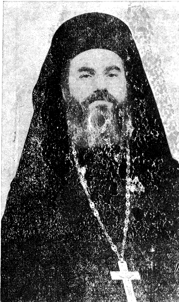
† Ὁ Δρυϊνουπόλεως κ. Σεβαστιανός

εις τὸ τότε Ἱεροδιδασκαλεῖον Κορίνθου, τούτου δὲ καταργηθέντος ἐφοίτησεν ἐν συνεχείᾳ εἰς τὸ Γυμνάσιον Καρδίτσας, ἐκ τοῦ ὁποῦ ἐλαβε τὸ ἀπολυτήριον τὸ 1941. Ἐγγραφεῖς εἰς τὴν Θεολογικὴν Σχολὴν τοῦ ἐν Ἀθήναις Πανεπιστημίου ἀνεκηρύχθη