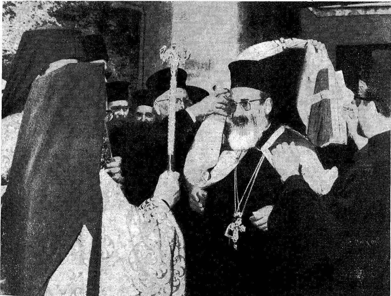
Ἡ Α. Μακαριότης ὁ Ἀρχιεπίσκοπος Ἀθηνῶν καὶ πάσης Ἑλλάδος κ. Ἱερώνυμος ἐνδύόμενος τὸν μανδύαν πρὸ τῆς τελέσεως τῆς Δοξολογίας εἰς τὸν πατριαρχικὸν ναὸν ΚΠόλεως.

Τὰ αἰσθήματα ταῦτα, Παναγιώτατε, τὰ συμμερί-