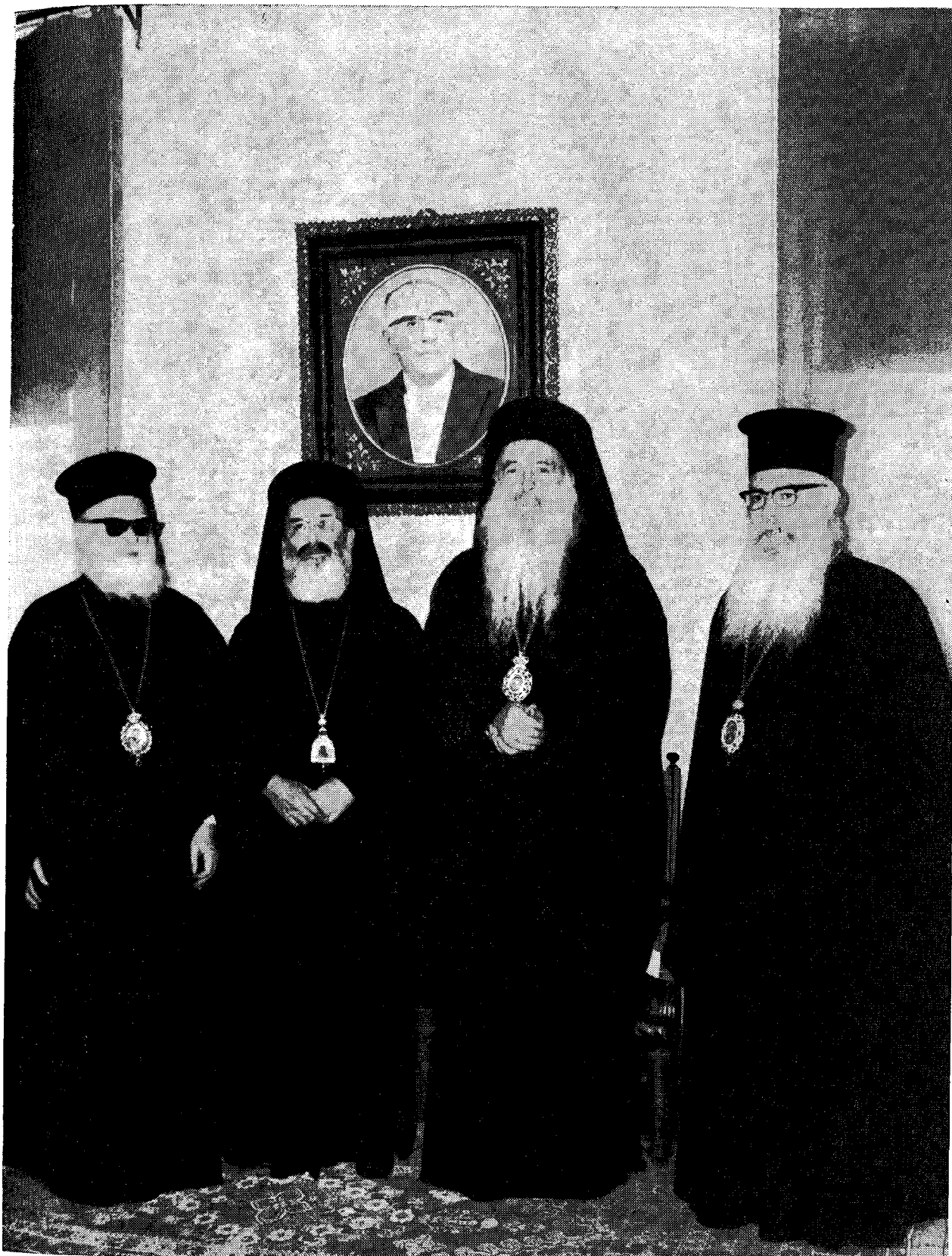
Ἡ Α.Θ.Π. ὁ Οἰκουμενικὸς Πατριάρχης κ. Ἀθηναγόρας καὶ ἡ Α. Μακαριότης ὁ Ἀρχιεπίσκοπος Ἀθηνῶν καὶ πάσης Ἑλλάδος κ. Ἱερώνυμος ἔχοντες ἐκατέρωθεν τὸν τοῦ Σεβ. Μητροπολίτου Πατρῶν κ. Κωνσταντίνου καὶ Κασσανδρείας κ. Συνέσιον,