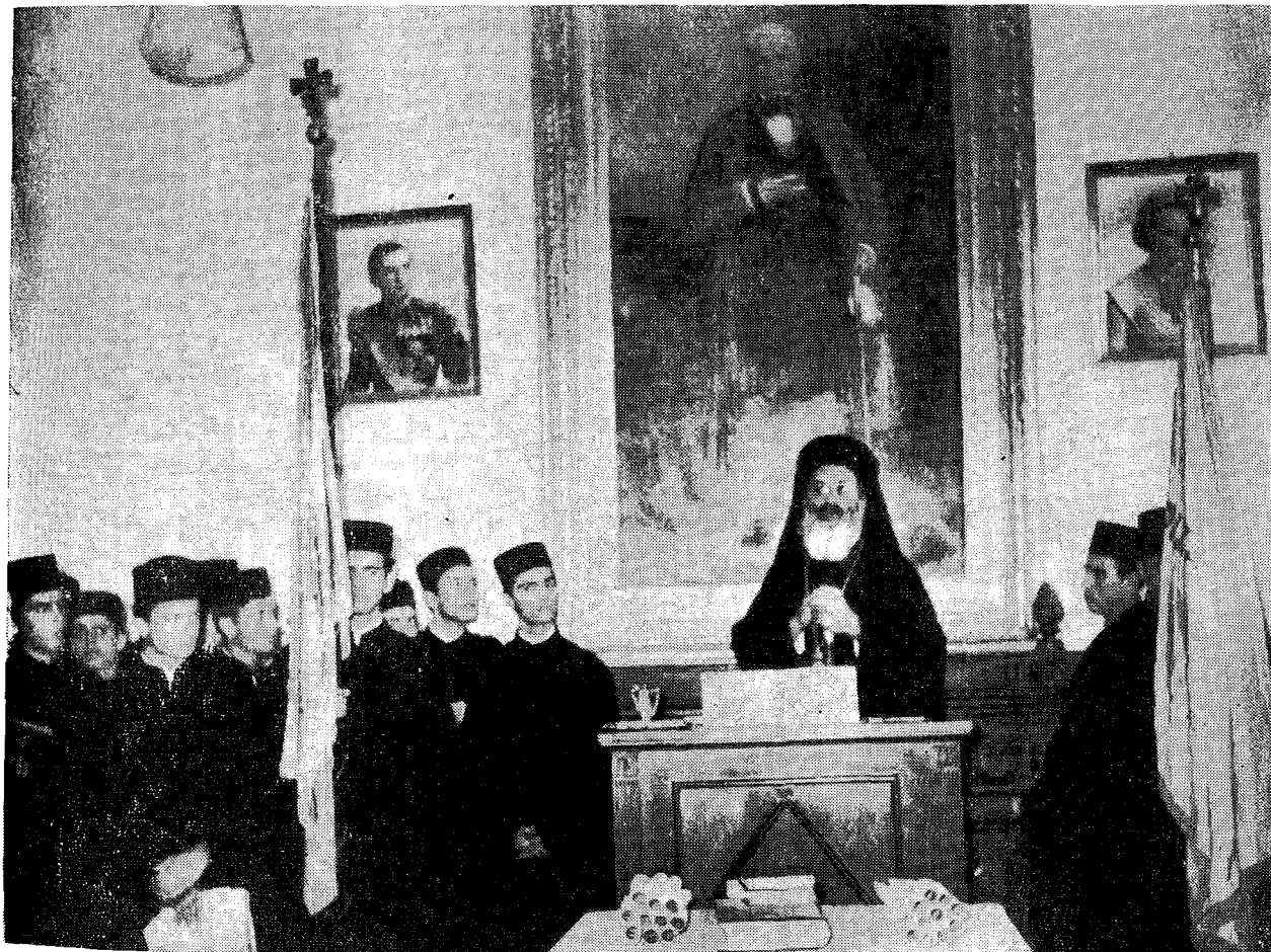
Ὁ Μακ. Ἀρχιεπίσκοπος κ. Ἱερώνυμος ὁμιλῶν πρὸς τοὺς σπουδαστὰς τοῦ Ἀνωτέρου Ἐκκλησιαστικοῦ Φροντιστηρίου καὶ τῆς Ριζαρείου Ἐκκλησιαστικῆς Σχολῆς.

Ὁ κ. Πρόεδρος τοῦ Διοικητικοῦ Συμβουλίου τῆς