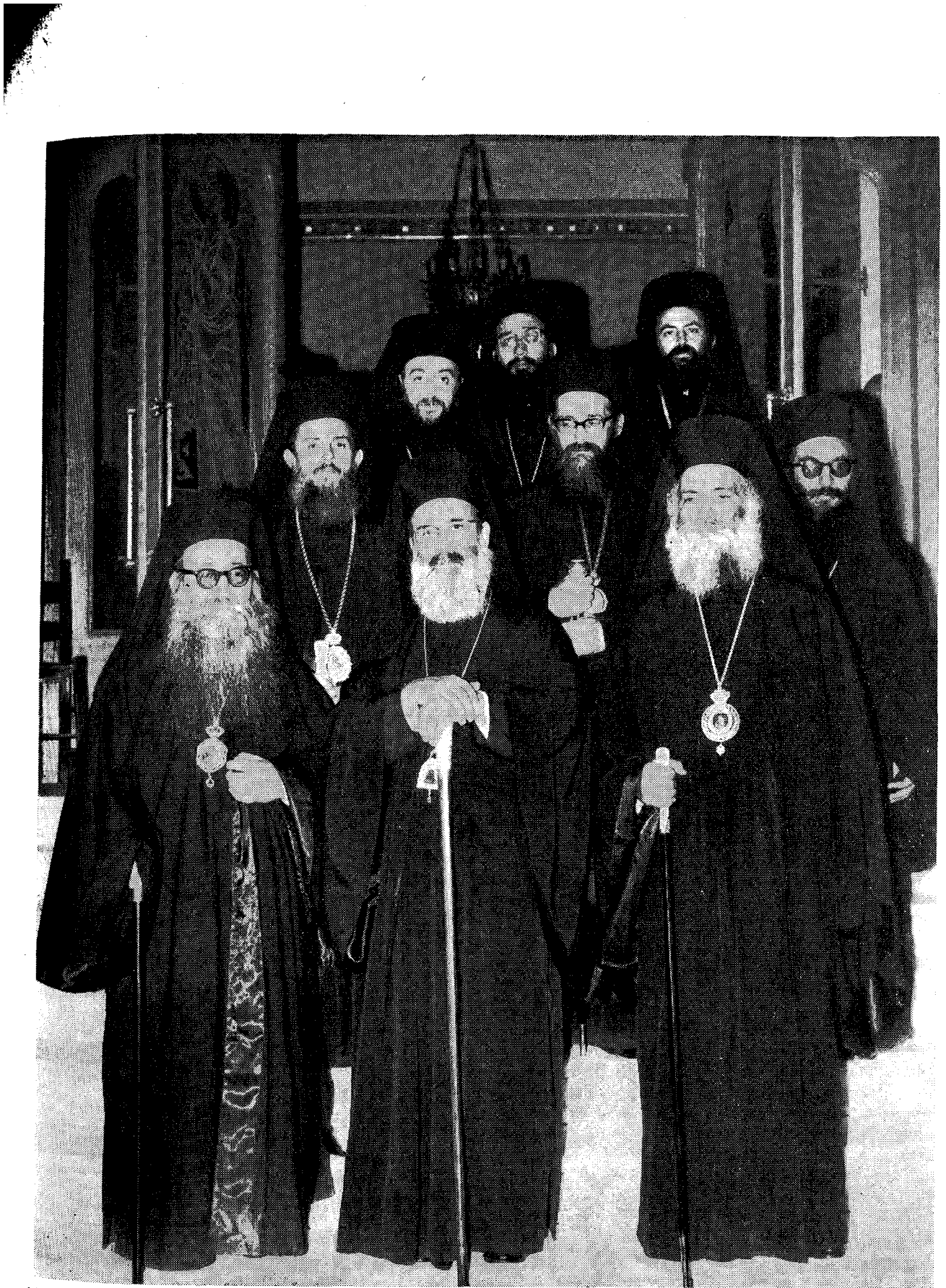
Ὁ Μακαριώτατος Ἀρχιεπίσκοπος κ. Ἱερώνυμος ἐν μέσῳ τῶν νέων Σεβ. Μητροπολιτῶν μετὰ τὴν Διαβεβαίωσιν τῶν ἐνώπιον τῆς Α.Μ. τοῦ Βασιλέως.