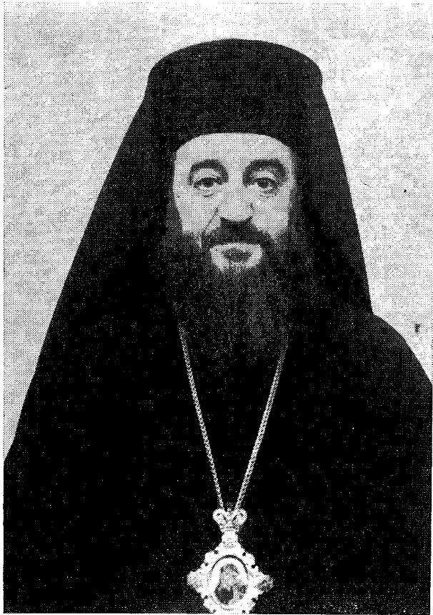
† Ὁ Νικαίας κ. Γεώργιος

Εἰς τὴν Ἱ. Μητρόπολιν Φθιώτιδος εἰργάσθη