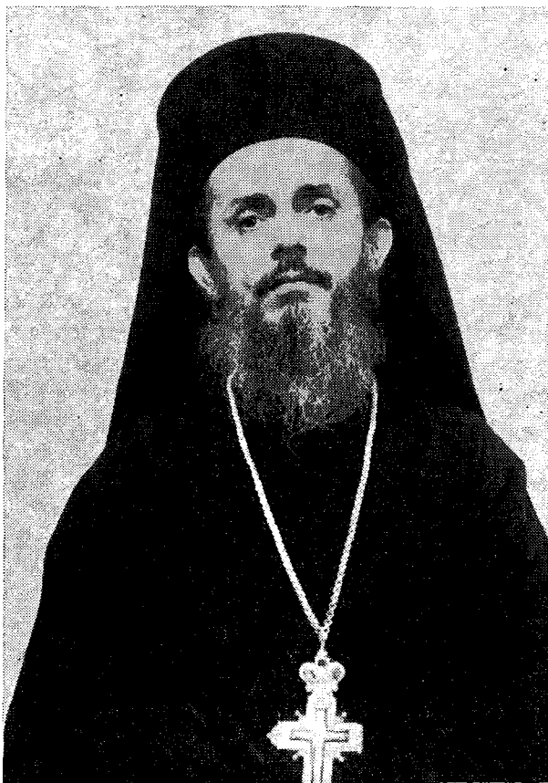
† Ὁ Ἐδέσσης καὶ Πέλλης κ. Καλλίνικος

Ὁ Σεβασμιώτατος Μητροπολίτης Ἐδέσσης καὶ Πέλλης κ. Καλλίνικος Ποῦλος ἐγεννήθη τὸ 1919 εἰς τὸ χωρίον Σιταράλωνα Ἀγρινίου. Ἀριστοῦχος